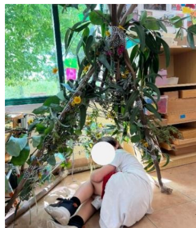
Figura 1-Exploração dos elementos da Natureza