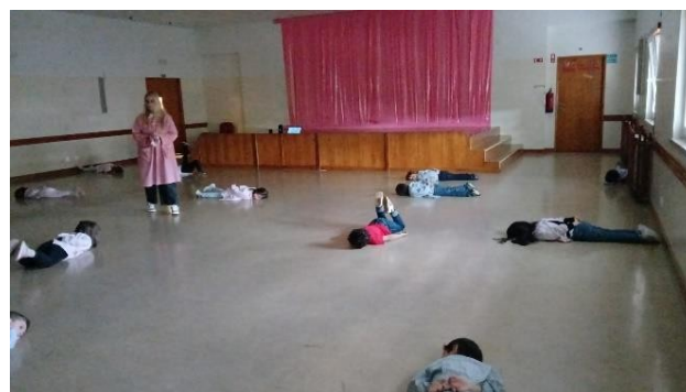
Figura 9- Exercício de relaxamento