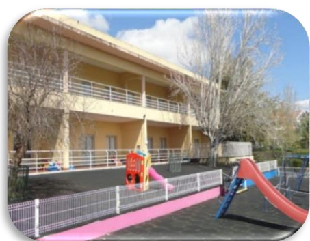
Figura 8- Espaço exterior

Na parte exterior do jardim, existiam três parques de exploração, sendo esses, o primeiro destinado às salas da creche, o segundo destinado ao pré-escolar e por fim o terceiro era o parque de merendas, destinado às crianças do C.A.T.L e do pré-escolar.