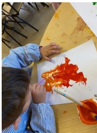
Figura 10- Construção do "Monstro da raiva"