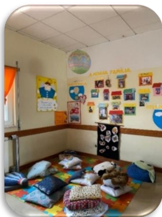
Figura 6-Sala principal