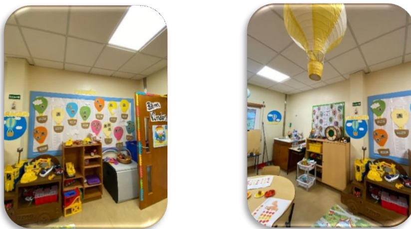
Figura 5-Sala secundária, entrada da sala "O Balão Mágico"

A sala secundária (figura5), incluía placares informativos, área da garagem e pintura, e um bebedouro acessível à criança(s), promovendo autonomia e responsabilidade.