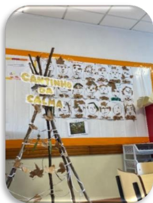
Figura 7- Nova área, o "Cantinho da calma"

O espaço exterior, sinalizado na figura 8 era utilizado de forma rotativa pelas salas, garantindo equidade no acesso e promovendo experiências motoras e sócias diversificadas.