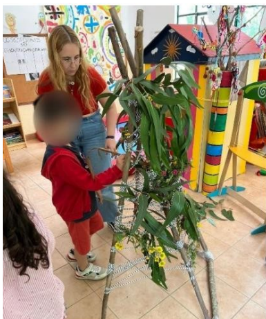
Figura 2-Elaboração do cantinho da natureza

forma autónoma, reduzindo a necessidade de orientação emocional por parte do adulto. Estes resultados reforçam a importância de práticas pedagógicas que integram ambientes reguladores e promovem a autonomia emocional.