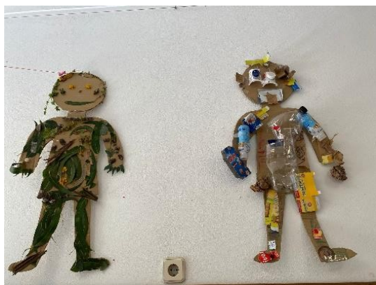
Figura 4-Resultado da exploração