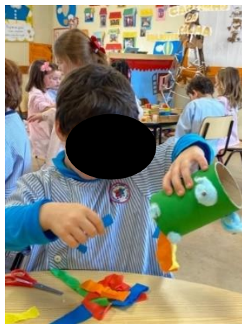
Figura 11-Elaboração do "Dragão sereno"