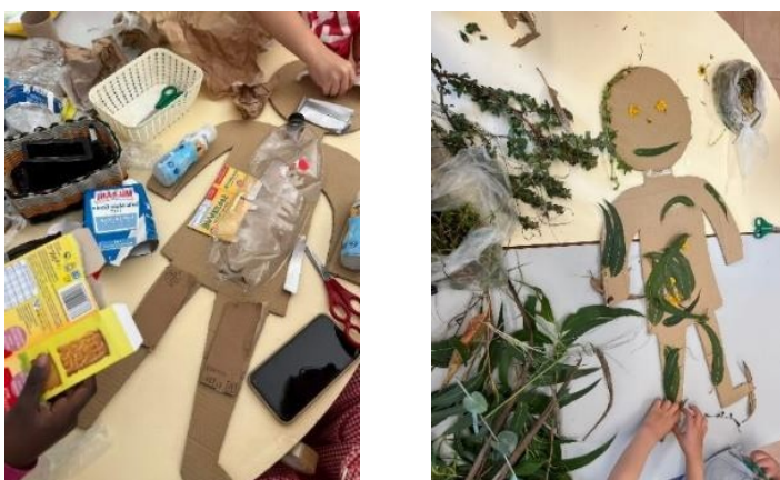
Figura 3-Construção do robô explorador

A intencionalidade pedagógica desta atividade centrou-se na promoção ecológica, na valorização de práticas sustentáveis e no desenvolvimento do pensamento crítico relativamente aos cuidados a ter com o meio ambiente.