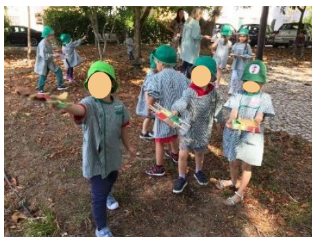
Figura 26 - Exploração do espaço exterior

As crianças exploraram o espaço exterior, procurando elementos da natureza de acordo com as quatro cores representadas nas pranchetas (Figura 25-b). A maioria das crianças demonstrou autonomia na exploração, mas algumas crianças mostraram alguma dificuldade em encontrar os materiais de cor vermelha e amarela e também em colocar os materiais na respetiva mola. Foi possível observar as crianças mais velhas a ajudarem as crianças mais novas nesta tarefa (Figura 26), demonstrando assim competências pessoais e sociais, como ajudar o outro.