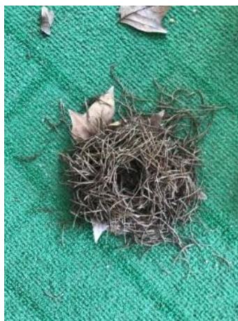
Figura 34 - Representação de um ninho

Quando as crianças terminaram as suas obras de arte, existiu um momento de discussão para perceber que materiais tinham recolhido para construírem a sua obra de arte. Pelos resultados apresentados verifica-se que as crianças recolheram maioritariamente folhas das árvores, areia, flores, ervas e pedras. Uma utilizou também água. Durante a discussão, todas as crianças referiram o que utilizaram, esperando pela sua vez para falarem, respeitando a explicação dos outros colegas. Também todas foram capazes de explicar o material utilizado e identificar o que realizaram, desenvolvendo assim competências pessoais e sociais. Para além disto, algumas crianças juntaram-se, fazendo a sua obra de arte em conjunto, partilhando ideias entre si. Foi possível verificar que todas as crianças desenvolveram a autonomia na exploração do espaço e recolha de material. As crianças desenvolveram a criatividade ao criarem uma obra de arte a partir de materiais da natureza.