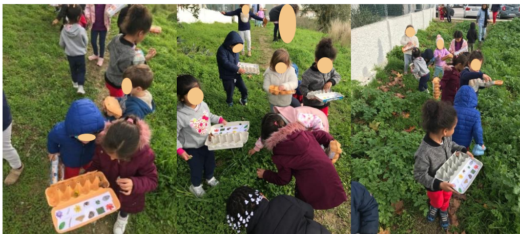
Figura 35 - Exploração do espaço exterior a), b) e c)

Ao realizarem esta atividade, as crianças aprenderam alguns nomes de elementos da natureza que lhes eram desconhecidos (como por exemplo o trevo) e a estarem atentas e concentradas para encontrarem os elementos da natureza. Estas foram também capazes de respeitar as regras estipuladas antes da saída da escola, percebendo que existem perigos em certos lugares. Ao longo da exploração, algumas crianças demonstraram independência e autonomia, demonstrando responsabilidade pela sua segurança e dos outros, bem como consciência de perigos que podiam ocorrer.