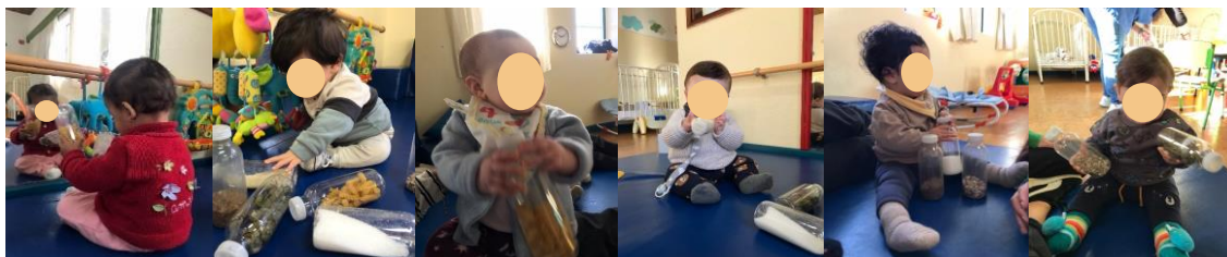
Figura 2 - Atividade de expressão musical a), b), c), d), e) e f)

A atividade da leitura da história foi a atividade mais desafiante e também a que correu melhor, pois foi a atividade em que as crianças se envolveram mais. Começámos por projetar uma imagem do fundo do mar na parede e contámos uma pequena história criada por nós, estagiárias, que incluía alguns animais marinhos. A história iniciou-se com o fundo do mar, que foi representado colocando um lençol por cima das crianças, agitando-o. De seguida, iam surgindo alguns animais marinhos que representavam um gesto e foram mostradas imagens desses animais. A estrela-do-mar representava cocegas, o tubarão representava “morder com as mãos”, o peixe representava dar beijinhos e o polvo representava dar abraços (Figura 3 – a). No final foi cantada uma canção e projetado um vídeo do fundo do mar. Para as crianças, a diferença entre uma