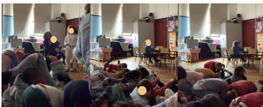
Figura 19 – Yoga a), b) e c)

exterior na hora do almoço. Antes de encaminhar as crianças para a sala, começou-se a falar em voz baixa e calmamente. Foi pedido às crianças que quando chegassem à sala descalçassem os seus sapatos, para ficarem mais confortáveis e se sentassem no tapete. Procedeu-se à leitura da história “Eu sou yoga” de Susan Verde (2019). Este livro contém algumas posições de yoga e momentos de relaxamento. Assim, em cada momento da história em que apareciam as posições de yoga, foi dado um tempo para os adultos auxiliarem as crianças. As crianças conseguiram realizar a maior parte das posições de yoga e no final estavam tão relaxadas que ficaram mais tempo em silêncio e deitadas do que estava planeado (Figura 19 – a, b e c).