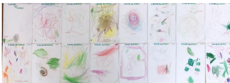
Figura 16 - Couve ou alface?

Foram apresentadas duas novas questões: “O que o caracol come? Será que gosta mais de alface ou de couve?”. Foi mostrada uma folha de cada para as crianças melhor as distinguirem. A maioria mencionou que o caracol comia alface e poucos mencionaram que comia couve. Para estudar a questão, os caracóis foram colocados numa caixa com uma folha de couve e uma folha de alface. Os caracóis ficaram na caixa até ao dia seguinte para depois se verificar qual das folhas tinham comido mais quantidade. Ainda nesse dia, foi pedido às crianças que desenhassem no seu bloco de cientista o que achavam que os caracóis mais iriam comer, se a folha de couve ou se a folha de alface. Em cada desenho escreveu-se o que cada criança escolheu (Figura 16). No dia seguinte, voltou-se a perguntar e a maioria das crianças manteve a sua resposta. Abriu-se a caixa e as crianças puderam observar o que aconteceu durante aquele tempo. Verificaram que os caracóis comeram a folha de couve toda e que não tocaram na folha de alface (Figura 17 – b e c).