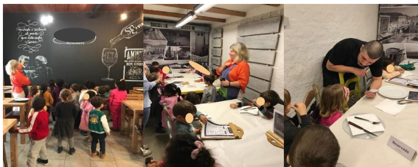
Figura 12 - Visita ao restaurante