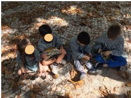
Figura 21 - Momento de discussão

Ao construírem o quadro, as crianças desenvolveram a criatividade e a capacidade expressiva. Através dos materiais recolhidos, as crianças atribuíram-lhes significados. A maioria do grupo referiu ter representado jardins, parques e flores. Apenas uma criança representou um sol, uma nuvem, plantas e a ela própria, como é possível observar na figura 22, evidenciando a sua interpretação do mundo que a rodeia e da importância dos seus elementos.