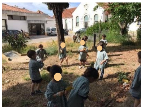
Figura 23 - Exploração do espaço e recolha de material