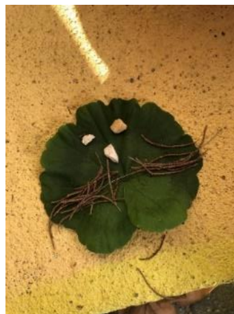
Figura 30 - Representação de um gato

A Criança V construiu uma “casa de passarinhos e um rio”. Para tal utilizou folhas, areia e água. É possível observar na figura 31 que as folhas e a areia representam a casa dos passarinhos e a água o rio, molhando o cimento.