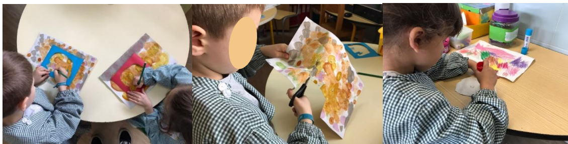
Figura 7 - Reproduções finais