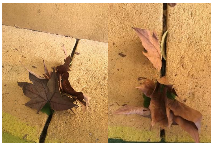
Figura 32 - Representação de “é uma festa para o sapo, uma cama para o sapo e um barco para o sapo” a) e b)

A Criança D, a Criança J e a Criança A construíram em conjunto uma pizza e utilizaram ervas castanhas e areia. Na figura 33 é possível observar as crianças a colaborar para representar a “pizza” com as ervas castanhas e a “pimenta” com a areia.