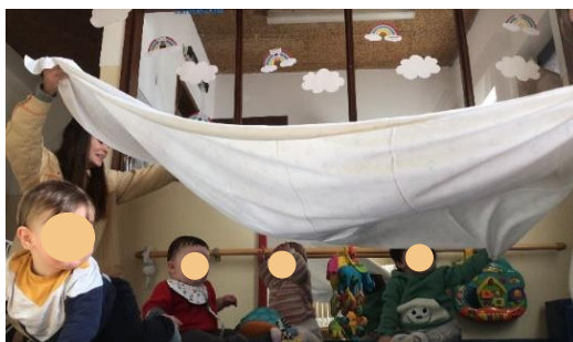
Figura 1 - Atividade motora

Numa atividade de expressão musical foram construídas maracas com garrafas transparentes, para que apelassem tanto ao sentido visual das crianças bem como à sua audição, desenvolvendo assim o conhecimento dos sons fortes e fracos. No interior de cada maraca foi colocado um material diferente, de forma a produzirem sons diversos. As crianças exploraram as garrafas durante três dias, todas as crianças quiseram mexer e agitar (Figura 2). Foi realizado também um momento onde colocávamos as garrafas atrás das crianças e agitávamos de forma a entender se as mesmas conseguiam identificar de onde vinha o som, e todas elas conseguiram. As garrafas continham no seu interior materiais que faziam diversos sons, uns mais fortes e outros mais fracos. As garrafas que as crianças gostaram mais foram as dos sons mais fortes como as pedras e a massa.