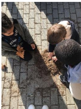
Figura 33 - Representação de uma pizza

A Criança F construiu um ninho e utilizou ervas castanhas, areia e algumas folhas, fazendo um buraco no centro para dar o efeito de ninho.