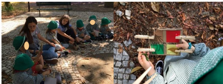
Figura 25 - Momento de discussão a) e b)

As crianças exploraram o espaço exterior, procurando elementos da natureza de acordo com as quatro cores representadas nas pranchetas (Figura 25-b). A maioria das crianças demonstrou autonomia na exploração, mas algumas crianças mostraram alguma dificuldade em encontrar os materiais de cor vermelha e amarela e também em colocar os materiais na respetiva mola. Foi possível observar as crianças mais velhas a ajudarem as crianças mais novas nesta tarefa (Figura 26), demonstrando assim competências pessoais e sociais, como ajudar o outro.