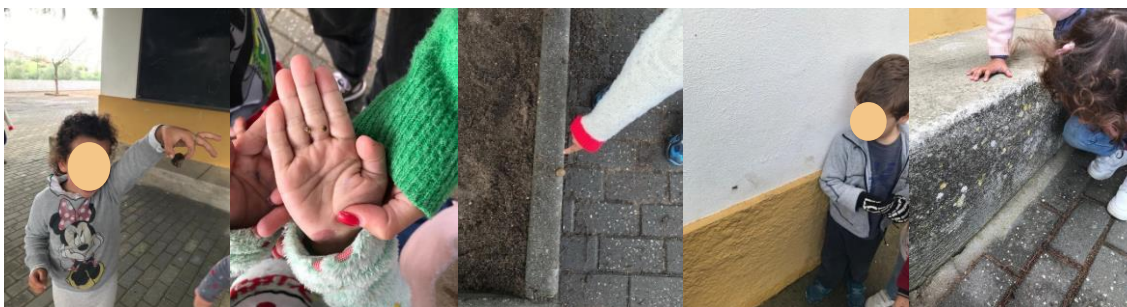
Figura 277- Seres vivos encontrados pelas crianças no espaço exterior a), b), c), d) e e)

Em seguida são sistematizadas as principais observações das crianças nos dois momentos. Durante a primeira exploração do espaço exterior, a Criança A encontrou um caracol ao pé da areia, a Criança F encontrou uma formiga no cimento perto da parede, a Criança J encontrou um caracol no muro da escola e a Criança R encontrou uma aranha. Enquanto reuníamos as crianças observaram um passarinho que passou por baixo do alpendre. Na segunda exploração do espaço exterior para encontrarem mais seres vivos, quando as crianças encontravam algum ser vivo chamava o grupo todo para o observarem. Então a Criança T encontrou uma joaninha, uma mosca e um bicho das ervas (a Criança F mencionou que o bicho parecia uma folha e a Criança T disse que o bicho “esconde-se de folha”), a Criança F encontrou uma planta, uma árvore e uma abelha, a Criança V encontrou um caracol, a Criança J também encontrou um caracol, a Criança R encontrou uma formiga, a Criança I encontrou uma minhoca, a Criança A encontrou uma maria café e muitas plantas, a Criança B encontrou um caracol, a Criança C encontrou uma planta, a Criança E encontrou uma maria café, a Criança D encontrou uma pedra pensando que era um caracol, ao qual mencionei que a pedra é um ser não vivo. Alguns dos seres vivos encontrados pelas crianças encontram-se na figura 27.