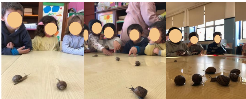
Figura 18 - O caracol gosta mais de água a), b) e c)

Por último, destaco uma atividade que foi realizada na semana do “Corpo e movimento”. Nesta atividade foi pretendido que as crianças fossem capazes de imitar posições de yoga, tal como praticar a meditação, através de um livro. Esta ideia surgiu depois de visualizar a auxiliar da sala a fazer sessões de relaxamento, quando as crianças estavam mais agitadas. De acordo com Morgado (2019), este tipo de atividades proporciona momentos de pausa, onde a criança aprende a sentir o seu corpo, combater a ansiedade e controlar as suas emoções. A mesma autora defende também que momentos de relaxamento facilitam a aprendizagem da criança, tal como o desenvolvimento de competências sociais.