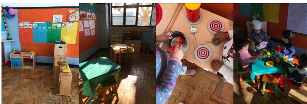
Figura 9 - Área do restaurante a), b), c) e d)

A maioria das crianças mostrou interesse pela área, mas foi possível verificar que os rapazes mais velhos preferiram continuar a brincar com as construções e carros. Com a criação da área do restaurante na sala, ao brincarem ao faz-de-conta (Figura 9 – c) no restaurante, as crianças aprenderam diversas coisas, tais como a pôr uma mesa, como já foi referido, a arrumar os utensílios da cozinha nos respetivos lugares, a postura correta de estar sentado à mesa, etc. Aqui foi também possível trabalhar tópicos de matemática, a partir da utilização de uma caixa registadora, onde é possível as crianças visualizarem os números de 1 a 9; na criação dos pratos pedidos pelos clientes, agrupando os alimentos pedidos; ao pôr a mesa; e dos pagamentos dos pedidos das crianças. De acordo com as Orientações Curriculares para a Educação Pré-Escolar (ME, 2016), através do brincar e da exploração do espaço e dos objetos, as crianças praticam a resolução de problemas e desenvolvem o pensamento e o raciocínio matemáticos, também do jogo dramático e do brincar surgem situações reais ou imaginárias que representam a realidade no momento, favorecendo o envolvimento da criança na resolução de problemas, oferecendo também múltiplas oportunidades para o desenvolvimento do raciocínio matemáticos e também favorecendo a autonomia da criança. Depois das crianças brincarem livremente na área, voltou-se a reunir o grupo no tapete para uma discussão sobre o nome do restaurante. A educadora na semana