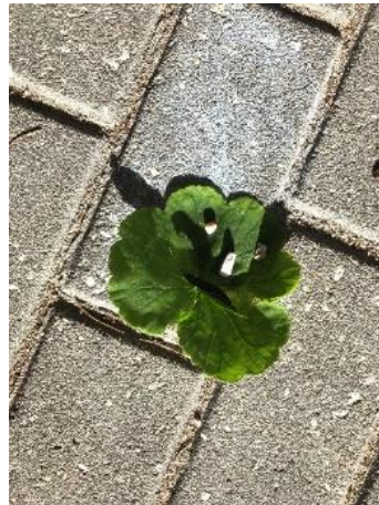
Figura 29 - Representação de uma cara

A Criança M e a Criança A construíram, juntas, um gato e utilizaram folhas, ervas castanhas e pedras. De acordo com a figura 30, representam a cara com uma folha verde, os bigodes com ervas e o nariz e os olhos com pedras.