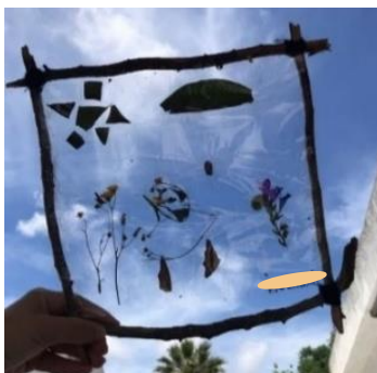
Figura 22 - Representação da criança B

Durante a exploração do espaço e a recolha dos materiais, as crianças desenvolveram a sua autonomia, explorando o jardim e o ambiente exterior autonomamente, como é possível verificar na figura 23.