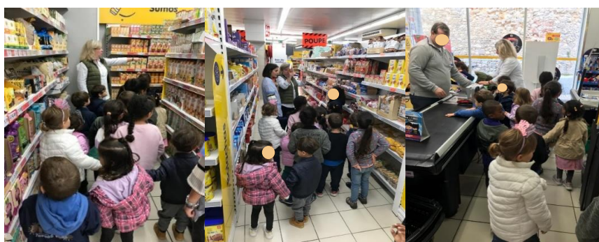
Figura 11 - Visita ao supermercado a), b) e c)

No dia seguinte o processo foi idêntico, mas com uma visita a um restaurante. Existiu um diálogo inicial, onde as crianças foram questionadas se costumavam ir a restaurantes e que restaurantes conheciam. Ao chegar ao restaurante foram referidas algumas regras para a visita, como: não fazer barulho para não incomodar os outros clientes, sentar direito à mesa, etc. As crianças também foram informadas que não iriam almoçar no restaurante, seria apenas uma visita, iriam almoçar o almoço da escola. A dona do restaurante realizou uma visita guiada e mostrou a parte de trás do balcão, ensinando as crianças como se tira um café, mostrou a cozinha e a casa de banho, e ao chegar às salas de refeição as crianças começaram a sentarem-se como se fossem lá almoçar. A senhora trouxe as ementas para as crianças escolherem o seu prato e chamou um senhor para fazer o pedido de cada criança (Figura 12 – c). Terminada a visita, a dona do restaurante fez um convite às crianças para irem almoçar lá um dia combinado com a educadora, de forma a terem mesmo a experiência de almoçarem no restaurante. De volta à escola, existiu um diálogo para se perceber qual das visitas gostaram mais de realizar, tendo a maioria manifestado ter gostado mais da visita ao restaurante, dizendo que queriam muito comer lá. Alguns disseram que gostaram das duas visitas e uma ou duas crianças mencionaram ter gostado mais da visita ao supermercado.