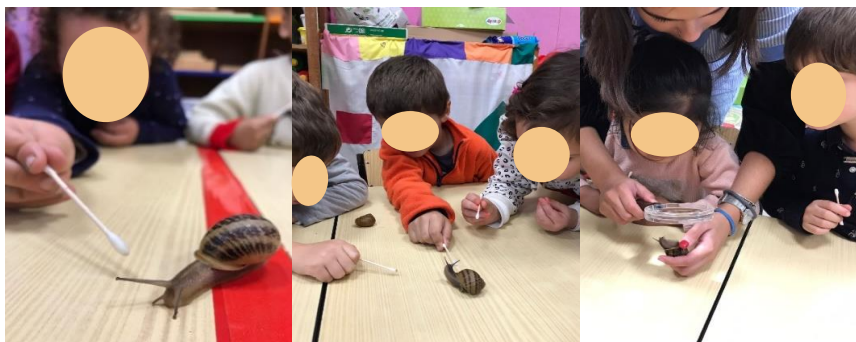
Figura 15 - O caracol consegue cheirar? a), b) e c)

Foram apresentadas duas novas questões: “O que o caracol come? Será que gosta mais de alface ou de couve?”. Foi mostrada uma folha de cada para as crianças melhor as distinguirem. A maioria mencionou que o caracol comia alface e poucos mencionaram que comia couve. Para estudar a questão, os caracóis foram colocados numa caixa com uma folha de couve e uma folha de alface. Os caracóis ficaram na caixa até ao dia seguinte para depois se verificar qual das folhas tinham comido mais quantidade. Ainda nesse dia, foi pedido às crianças que desenhassem no seu bloco de cientista o que achavam que os caracóis mais iriam comer, se a folha de couve ou se a folha de alface. Em cada desenho escreveu-se o que cada criança escolheu (Figura 16). No dia seguinte, voltou-se a perguntar e a maioria das crianças manteve a sua resposta. Abriu-se a caixa e as crianças puderam observar o que aconteceu durante aquele tempo. Verificaram que os caracóis comeram a folha de couve toda e que não tocaram na folha de alface (Figura 17 – b e c).