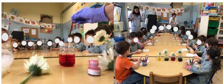
Figura 8 - Atividade experimental a) e b)

Num diálogo com as crianças, estas foram questionadas em que parte da flor iria ficar a cor e as respostas foram: “na flor”, “nas pétalas”, “no caule”, “na cabeça da flor”. Uma das crianças disse a outra que a água entrava no “buraquinho” da flor, então foi pedido a esta criança que explicasse qual e onde era o “buraquinho” da flor que estava a falar. Perguntando o que iria acontecer com o buraco, a criança respondeu “vai trazer a cor de volta”. De seguida, foi pedido às crianças que desenhassem como achavam que iriam ficar as flores (Figura 8 – b). Nos dias seguintes, de modo a irem acompanhando o processo, foi também pedido que registassem graficamente no diário de registo da flor, o estado das flores, até perceberem que estariam totalmente da cor do respetivo corante. As crianças realizaram o registo das flores apenas nos dois dias seguintes, pois apesar de três das quatro flores terem obtido as cores dos corantes, ao terceiro dia encontravam-se iguais ao dia anterior. Logo, as conclusões tiradas pelas crianças foram que o corante verde não alterou o branco da flor e todos os outros mudaram a cor da flor. As crianças achavam que a cor que iria ficar mais forte era o azul e na verdade foi a vermelha.