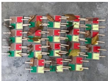
Figura 24 - Representações finais das cores

No final da exploração do espaço e da recolha dos materiais, foi realizado um diálogo sobre o que cada criança apanhou (Figura 25 – a). Neste momento as crianças desenvolveram competências pessoais e sociais, uma vez que foram capazes de