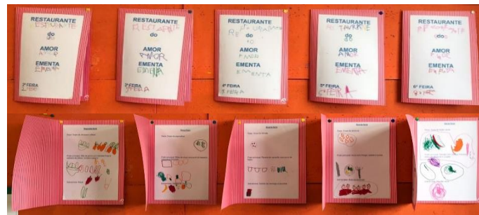
Figura 13 - Ementa do Restaurante do Amor

Outra atividade que destaco desta prática pedagógica foi uma atividade experimental que derivou de um grande interesse mostrado pelas crianças por caracóis, numa atividade implementada anteriormente. Nessa atividade anterior, as crianças ficaram bastante curiosas e foram questionadas sobre se gostariam de saber mais sobre estes animais, ao que as crianças responderam imediatamente que “sim”. Procurámos então realizar uma atividade em que fosse possível esclarecer mais sobre os animais que tanto lhes interessava. Segundo as OCEPE (ME, 2016), conteúdos relativos à biologia, tal como o conhecimento dos animais e o habitat dos mesmos, são ótimos para serem desenvolvidos em experiências a realizar com as crianças, sendo que estas permitem que as crianças adquiram vários saberes. Assim, foram definidos como objetivos: desenvolver a atenção e a concentração; compreender os acontecimentos desta experiência; reproduzir o que estão a ver para o papel; interagir recorrendo aos seus conhecimentos prévios; perceber os conteúdos e fenómenos abordados.