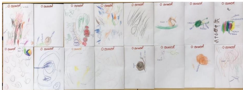
Figura 14 - O caracol

Foram realizadas algumas questões às crianças para que investigassem. Uma das questões foi: “Será que o caracol consegue cheirar?”. Antes de fazerem a experiência, metade das crianças mencionou que sim e outra metade que não. Para conseguirem investigar para responderem a essa questão, foram disponibilizados os materiais necessários e foi pedido às crianças que molhassem um cotonete em vinagre. Para verificarem se o caracol consegue sentir o cheiro do vinagre, foi dito às crianças que podiam aproximar lentamente os cotonetes com vinagre dos caracóis para observarem a sua reação (Figura 15 – a e b). As crianças aproximaram o cotonete muito devagar para não assustarem o caracol. Os caracóis encolheram-se para dentro da sua concha e voltou-se a perguntar se os caracóis cheiram e a maioria disse que sim, havendo duas ou três crianças a referirem que não. Perguntou-se às crianças o que estava a acontecer com o caracol quando aproximavam o cotonete e porquê e, uma das crianças respondeu “está a encolher porque não gosta”. Foi pedido a uma das crianças que respondeu que sim para explicar a sua resposta, ao que mencionou: “porque esconde-se, não gosta do cheiro, então o caracol cheira”. Pediu-se também a uma das crianças que mencionou que não para justificar e a mesma mencionou “porque não tem nariz”. De seguida, explicou-se que os caracóis cheiram por um buraco escondido pela