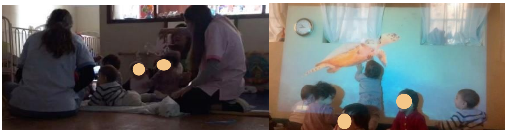
Figura 3 - Atividade da leitura a) e b)

história e uma canção é a melodia das palavras, a expressividade de como são ditas. As crianças desenvolveram também a motricidade, já que na parte final as crianças tentaram colocar-se em pé para “apanharem” os peixes que estavam a ser projetados (Figura 3 – b).