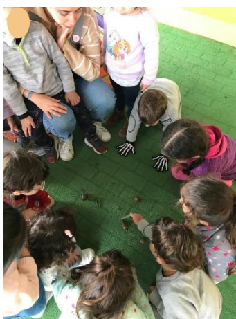
Figura 288 – Análise dos caracóis

Durante as duas explorações do espaço exterior foi possível verificar que as crianças demonstraram autonomia, pois só chamavam o adulto para mostrarem os seres vivos que tinham observado ou encontrado.