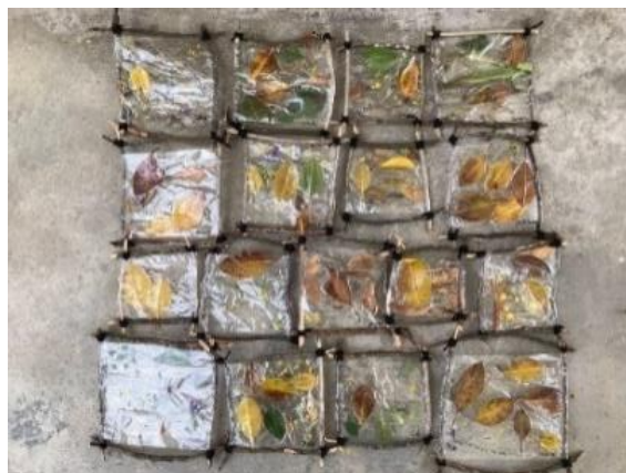
Figura 20 - Representações das crianças

Terminados os quadros da natureza, foi realizada uma reunião onde foram discutidos e analisados os quadros de todas as crianças, pedindo a cada uma que explicasse que material utilizou no seu quadro e o que representava a sua obra de arte. Todas as crianças puderam apreciar os quadros dos seus colegas. Na realização desta reunião, as crianças desenvolveram competências pessoais e sociais, uma vez que foram capazes de explicar e partilhar o trabalho realizado, desenvolvendo assim a expressividade e sentido crítico, e ainda enriquecendo o seu imaginário. As crianças