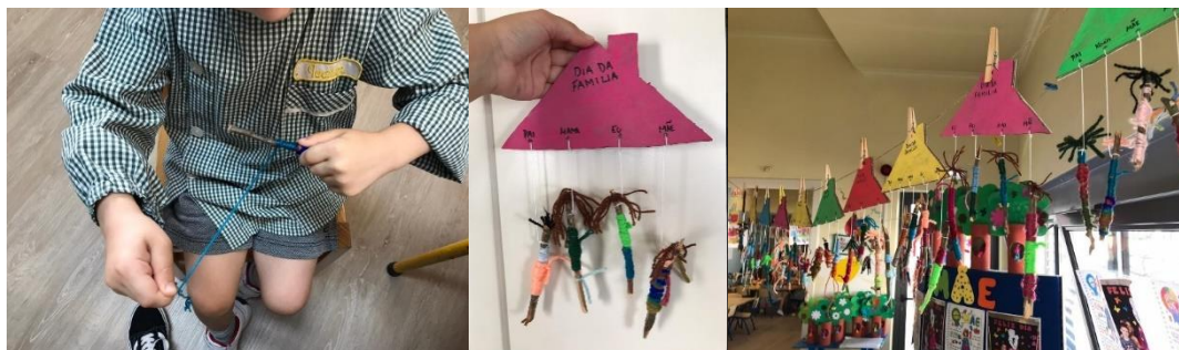
Figura 4 - Construção da família a), b) e c)

A segunda atividade surgiu do gosto das crianças por pintar. Desse modo, foram criadas tintas com alimentos, especiarias e argila. Esta atividade contemplava os objetivos: criar arte com diferentes materiais; desenvolver a criatividade e a imaginação; desenvolver o sentido estético; ter interesse em comunicar; ouvir atentamente a história; adquirir novas palavras no seu vocabulário; desenvolver a motricidade fina.