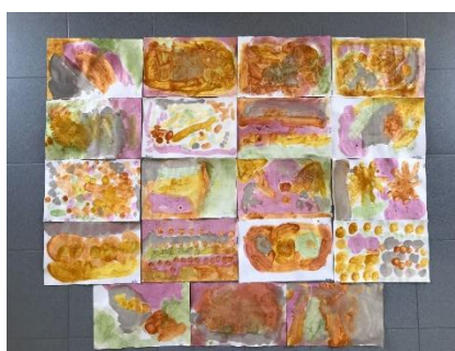
Figura 5 - Pinturas das crianças com as tintas naturais

imagens no computador, para que ficaram a saber que na arte figurativa se percebe as formas com facilidade e a arte abstrata não se identificam formas facilmente. Algumas das tintas ficaram mais líquidas e outras mais espessas. Durante a pintura, para além das crianças quererem explorar as cinco cores, surgiram algumas reações como: “se eu misturar laranja e amarelo faz uma cor bonita”; com outra mistura referiram “parece lilás a sério”. No decorrer desta tarefa, uma das crianças sujou a mão com argila e reparou que quando secou, ficou “duro”. Foi explicado às crianças que a argila é utilizada muitas vezes para hidratar a pele, o que fez com que as crianças quisessem colocar um pouco de argila na cara.