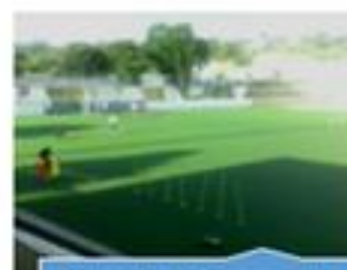
Relvado do Campo da Caridade (Lado Norte)