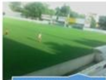
Relvado do Campo da Caridade (Lado Sul)