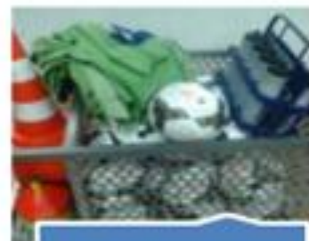
Carrinho do Material