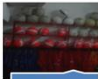
Sala do Material