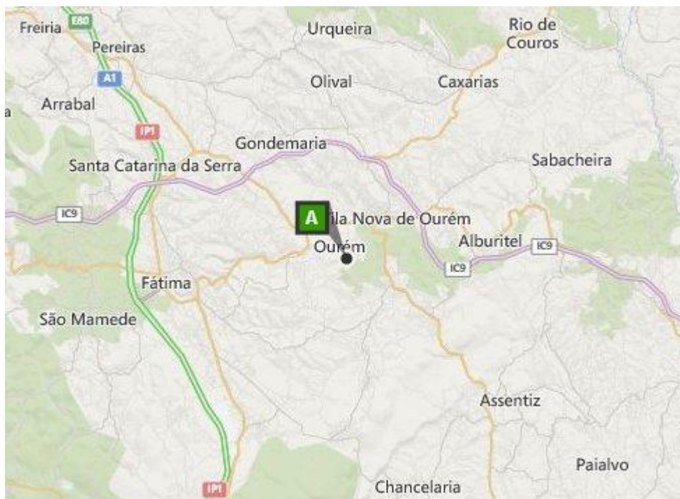
Figura 1 Enquadramento geográfico do clube

Modalidades: Futebol (masculino e feminino) em todos os escalões.