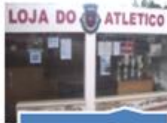
Loja do CAO