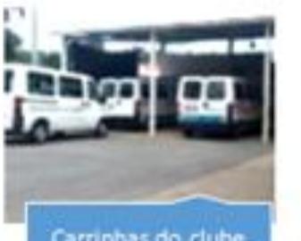
Carrinhas do clube