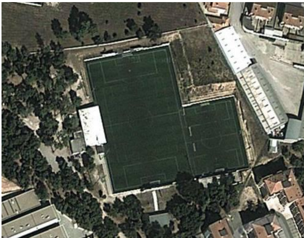
Figura 3 Campo da Caridade