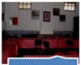
Sala de Refeições