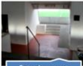
Entrada para as bancadas