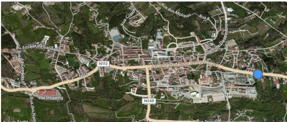
Figura 2 Localidade de Ourém