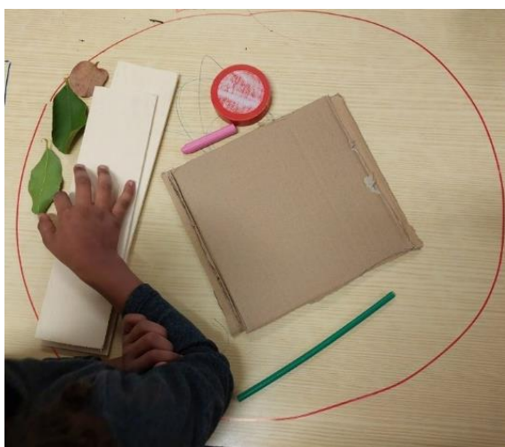
Figura 7 - Conjunto do Liso

Numa das mesas da sala foram desenhados dois conjuntos, um círculo para simbolizar o conjunto do liso (figura 7) e um quadrado para simbolizar o conjunto do rugoso (figura 8). Optou-se por se fazer duas figuras geométricas diferentes para as crianças entenderem que eram dois conjuntos diferentes.