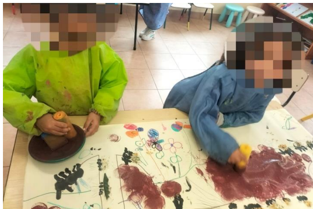
Figura 12 - Pintura do cenário

Na conclusão deste trabalho, todo o cenário foi pintado utilizando a técnica da esponja (figura 12), complementada pela pintura com canetas de feltro. Esta etapa final não só acrescentou cores ao cenário, mas também permitiu que as crianças contribuíssem para a finalização do mesmo de forma significativa.