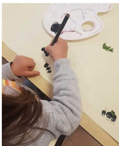
Figura 10 - Pintura de formigas

Uma outra etapa deste trabalho envolveu a colocação de alimentos nas costas das formigas. As crianças foram incentivadas a colocar uma variedade de alimentos, como milho, bagos de arroz, pequenos grãos e folhas (figura 11), para simular o comportamento natural das formigas na recolha e transporte de alimentos para dentro do formigueiro.