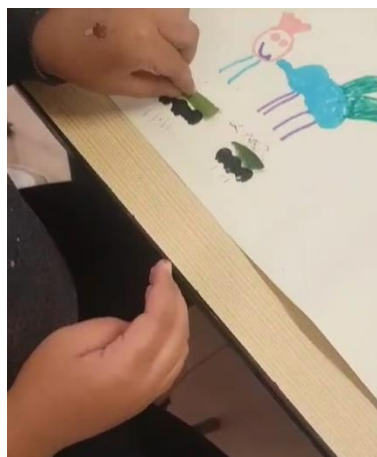
Figura 11 - Colagem de pedaços de folhas