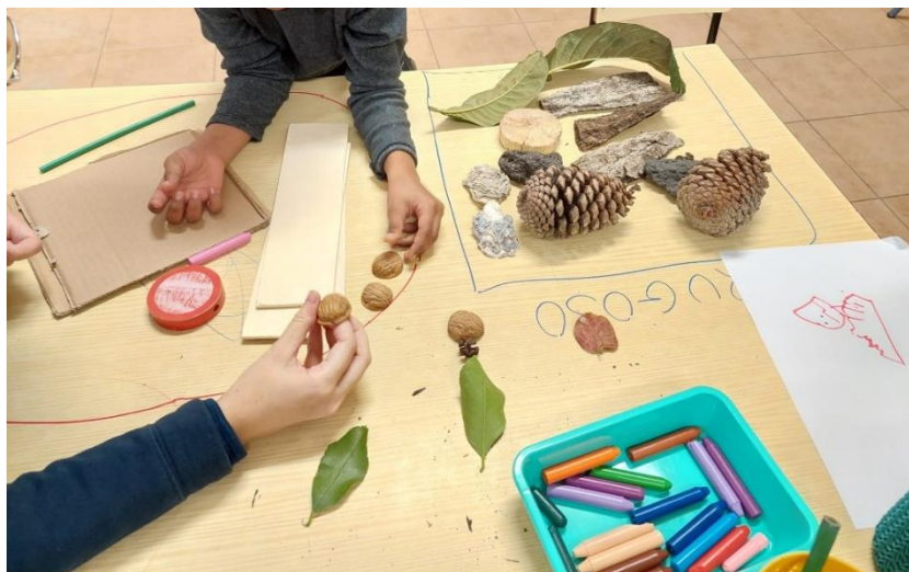
Figura 9 – Separação de materiais lisos e rugosos