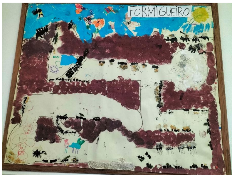
Figura 13 - Formigueiro Coletivo

O facto de o resultado desta atividade ter sido colocado no placar fora da sala (figura 13), permitiu que todos pudessem ver o trabalho realizado pelas crianças. Esta decisão resultou no contentamento das próprias crianças, que ficaram visivelmente felizes e orgulhosas do seu trabalho em destaque. Além de promover um ambiente de valorização e reconhecimento, a exposição do trabalho também incentivou as crianças a compartilharem as suas experiências e aprendizagens com os colegas, contribuindo para um clima de colaboração e motivação.