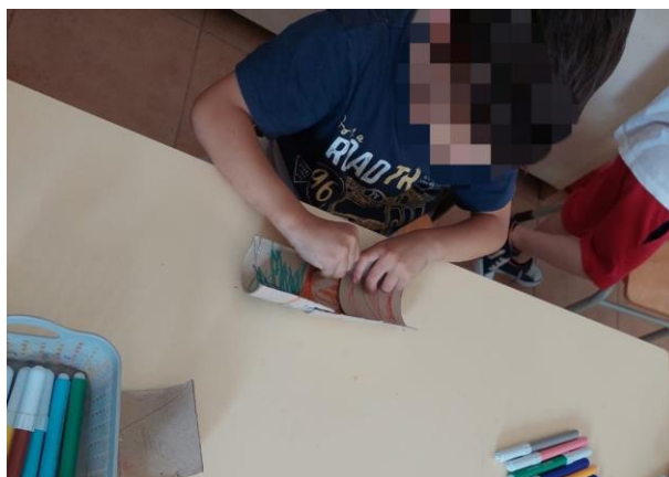
Figura 5 - Construção do aqueduto

Será apresentada uma atividade implementada, como exemplo do projeto educativo desenvolvido: a atividade teve como título “Construção de um aqueduto” e como ponto de partida uma visita de estudo a Óbidos, em que as crianças ficaram a