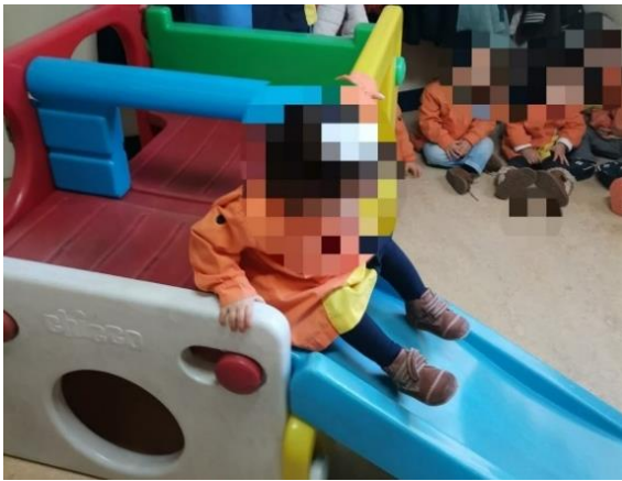
Figura 2 - Crianças a passar pelo escorrega

passaram por estabelecer relações com os pares, desenvolver a expressão do corpo, entre outros.