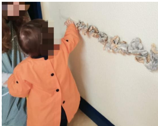
Figura 4 – Criança a colar a bola numa fita suspensa

Refletindo sobre a atividade, as crianças mostraram-se bastante recetivas ao ir para o escorrega, no entanto, algumas delas tiveram medo de entrar dentro do túnel. A atividade poderia ter sido feita de forma mais exploratória, na medida em que as crianças poderiam brincar e explorar livremente os materiais, sendo que na parte de colar a bola de papel na fita adesiva, iriam ser chamadas uma de cada vez para o fazer.