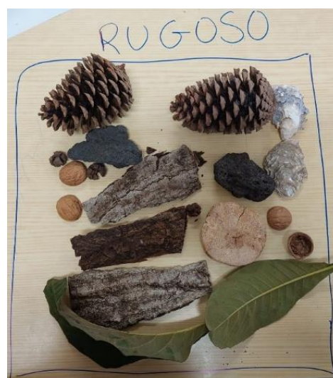
Figura 8 - Conjunto do Rugoso

O jogo foi feito com uma criança de cada vez, de modo a perceber se elas entendiam os conceitos principais. Foram espalhados materiais como pinhas, bocados de tronco, tábuas de madeira, lápis de cera lisos, casca de noz, pedaços de cartão e foi pedido que classificassem como liso e rugoso. Algumas das crianças tiveram algumas dificuldades em perceber os conceitos, mas no final do jogo todas as crianças conseguiram entender estes dois conceitos. O facto de ter sido feito individualmente foi uma mais-valia, pois as crianças distraíam-se menos e conseguiram concentrar-se melhor na atividade, facilitando assim a sua compreensão e aprendizagem das características dos materiais presentes.