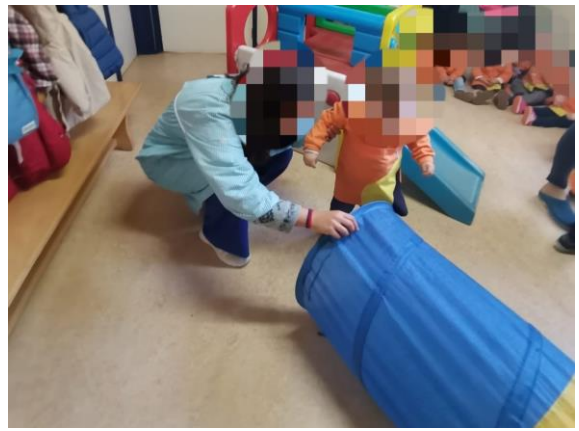
Figura 3 – Criança a passar pelo túnel