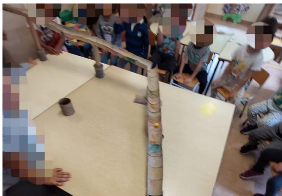
Figura 6 - Aqueduto

conhecer a história da rainha Catarina de Áustria. Como introdução à atividade foram feitas algumas questões, como por exemplo, “Como se chamava a 3. a rainha que conhecemos em Óbidos?” e “O que ela construiu?”. De seguida, com rolos de papel cortados ao meio foi pedido