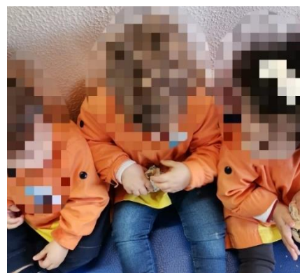
Figura 1 – Crianças a amachucar folhas de papel de jornal

A educadora permitiu-nos a realização de algumas atividades, será destacada apenas uma, como exemplo. Na atividade desenvolvida, as crianças tinham de amachucar uma folha de jornal de modo a formar uma bola (figura 1), com essa bola fizeram um percurso, na qual tinham de passar por um escorrega (figura 2) e por um túnel (figura 3) até chegarem ao final e colarem a bola numa fita adesiva suspensa (figura 4). Os objetivos