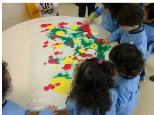
Fig. 41 - Exploração livre de um plástico transparente com diferentes tintas no seu interior.