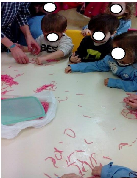
Figura 9 – Estagiária: - “De que cor é esta esparquete?”