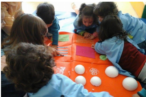
Figura 24 – Várias crianças a explorar o tapete e a conversarem sozinhas e entre si acerca das sensações.