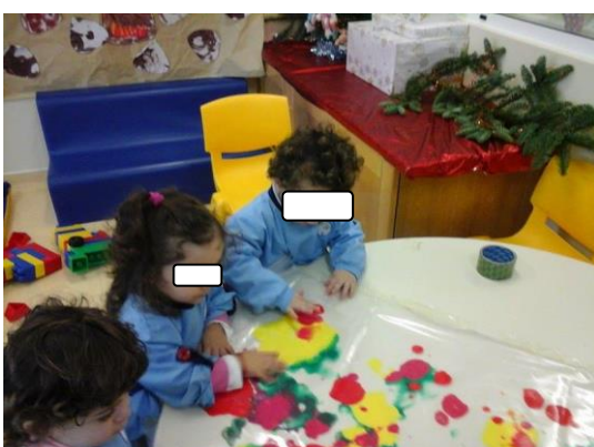
Fig. 42 - Exploração livre de um plástico transparente com diferentes tintas no seu interior.