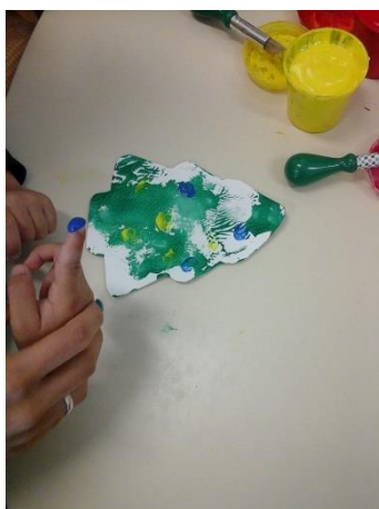
Figura 16 – Conversa entre a estagiária e Raf* acerca da cor