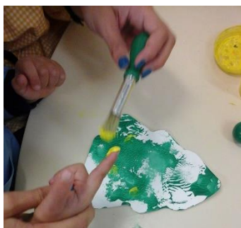
Figura 19 – Conversa com Conc* acerca da sensação sentida (“Faz cócegas, Conc*?”; “Amarelo. Diga você” Conc* : “Amarelo”).