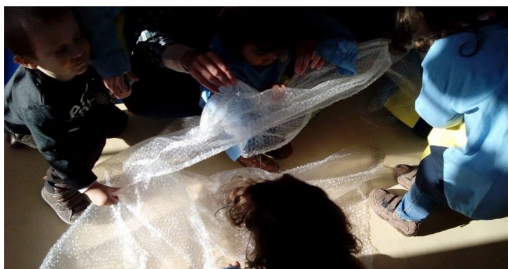
Figura 12 – As crianças exploram o material.