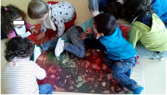
Fig. 44 - Exploração livre de um plástico transparente com diferentes tintas no seu interior.