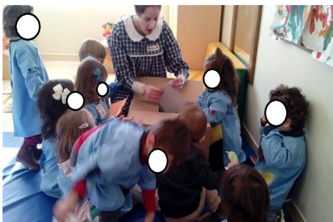
Figura 5 – Estagiária: “- Olhem o que eu tenho aqui. Tenho muitos papéis e tecido. Quem quer mexer neste tecido (dracalon)?”