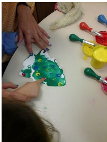
Figura 15 – Franc* a pintar bolas vermelhas na árvore de Natal