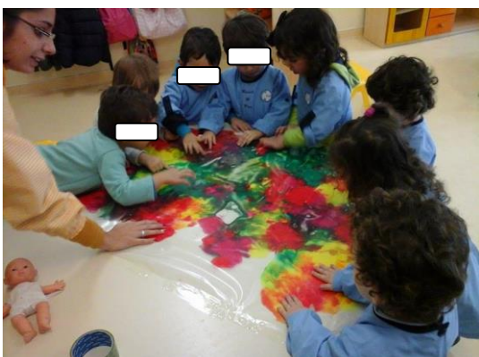
Fig. 40 - Exploração livre de um plástico transparente com diferentes tintas no seu interior.