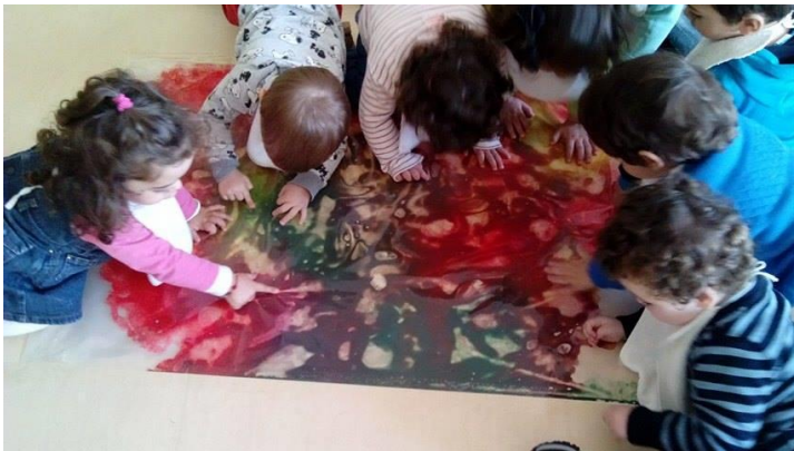
Fig. 46 - Exploração livre de um plástico transparente com diferentes tintas no seu interior.