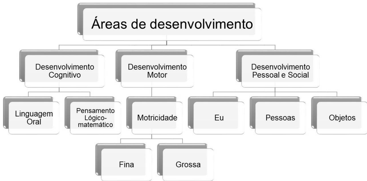
Figura 1 - Áreas de Desenvolvimento

Em conversas informais ocorridas em período de PES – Observação – foi-nos referido, pela Educadora Cooperante, que a Sala de Atividades dos dois anos é considerado, pela Comunidade Educativa, como um espaço em que tem como principal intento que as crianças passem momentos de qualidade com brincadeira, afeto, sendo que as aprendizagens são efetuadas de forma lúdica, tendo, desta forma, um ambiente divertido e de ternura. Estes fatores têm extrema importância nos primeiros anos de vida da criança, tal como referiu a Educadora Cooperante numa das conversas informais.