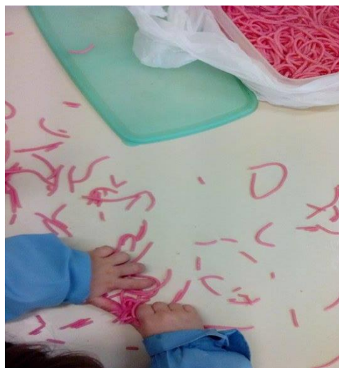
Figura 10 – As crianças exploram livremente a esparquete cozido colorido.