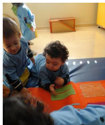
Figura 26 – Raf* a explorar a textura da renda.