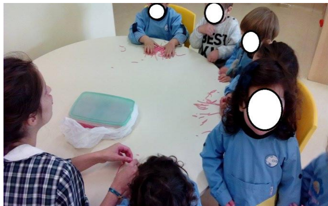
Figura 8 – Estagiária:“ - Vejam lá se a esparquete dá para partir em bocadinhos.” Criança X “- Dá!”