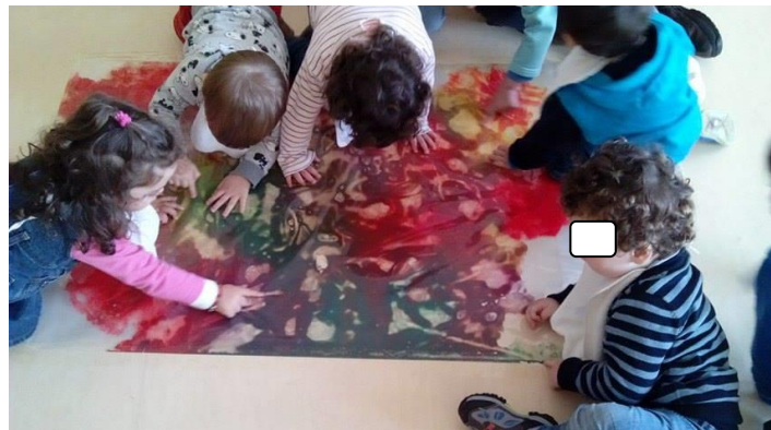
Fig. 47 - Exploração livre de um plástico transparente com diferentes tintas no seu interior.