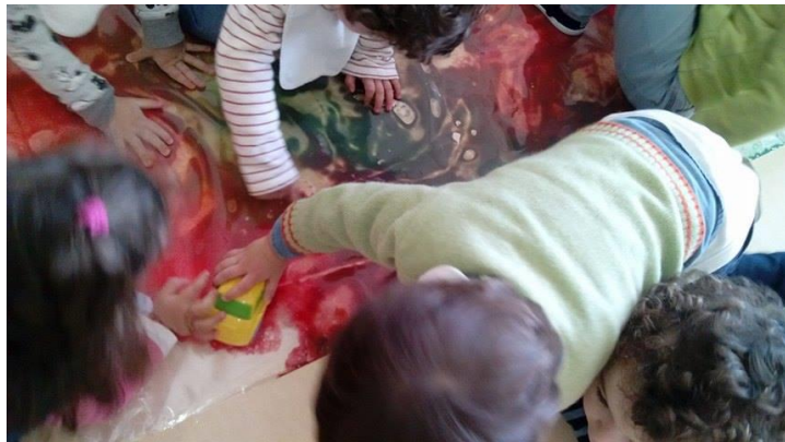
Fig. 45 - Exploração livre de um plástico transparente com diferentes tintas no seu interior.