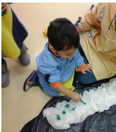
Figura 21 – Rub* a pintar o pedaço de cartão forrado com papel higiénico, utilizando o pincel.