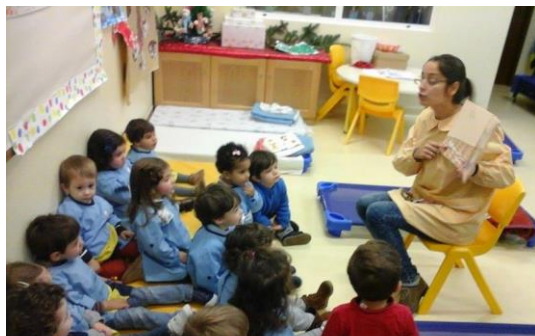
Fig. 35 - Leitura da história "Todos no Sofá", utilizando o livro e fantoches de dedo.