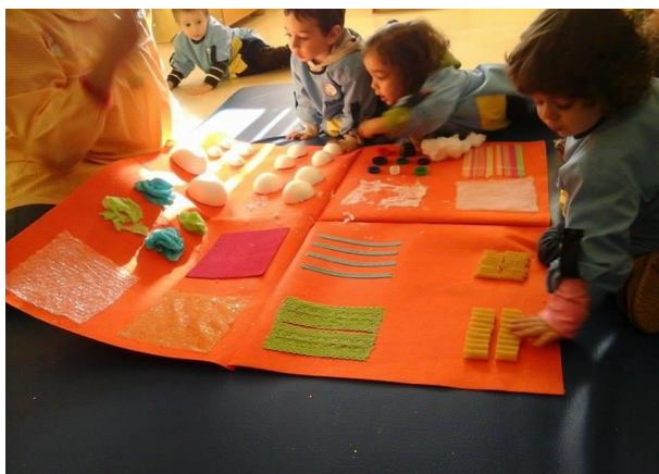
Figura 25 – Joa** a explorar a textura das massas.