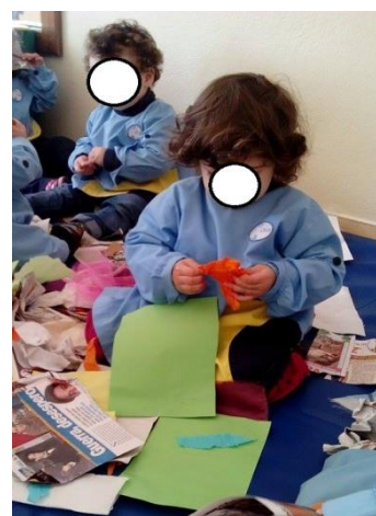
Figura 6 – As crianças exploram livremente os materiais.