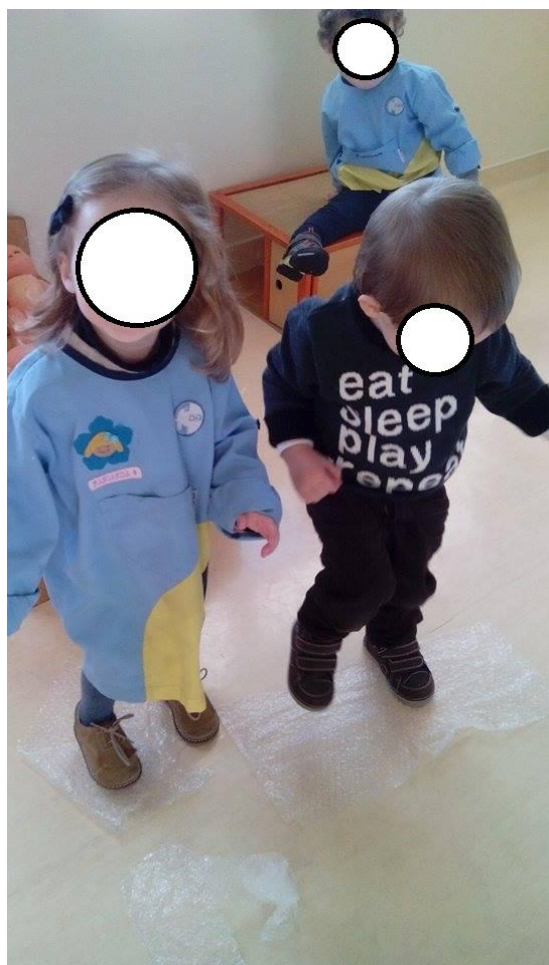
Figura 13 – Estagiária “- Saltem em cima das bolhinhas para ver se faz barulho também.”