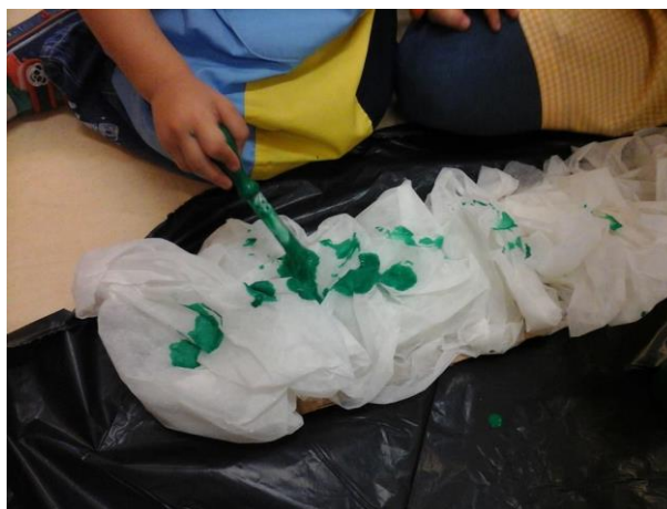
Figura 22 – Tom* a pintar com tinta verde o pedaço de cartão forrado com papel higiénico, utilizando corretamente o pincel.