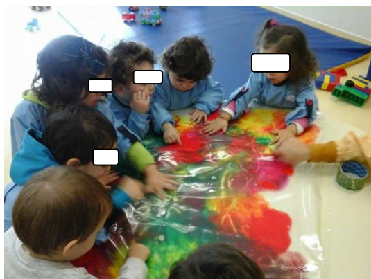
Fig. 43 - Exploração livre de um plástico transparente com diferentes tintas no seu interior.