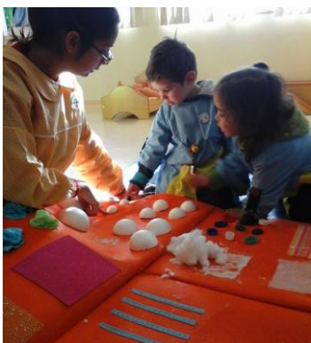
Figura 23 – Den* a explorar o tamanho das bolas de esferovite.