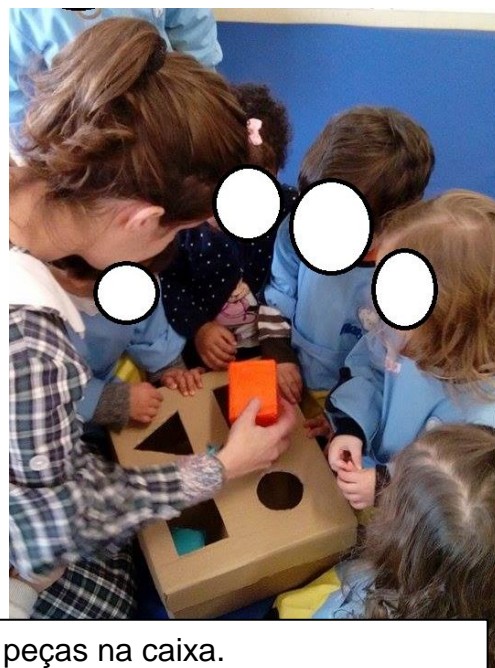
Figura 30 e 31: As crianças colocam as peças na caixa.

Estagiária: “- X onde é que vais colocar a peça?”