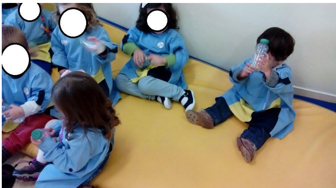
Figura 33: As crianças exploram livremente as garrafas e os sons que são produzidos.

Vai retirando do saco uma garrafa de cada vez e em simultâneo vai mostrando os diferentes sons.