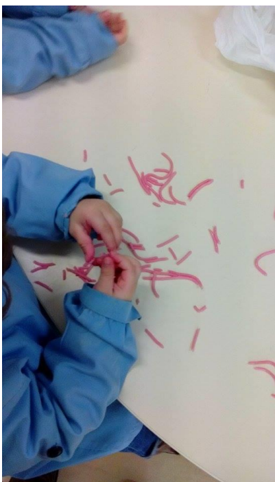
Figura 7 – As crianças exploram livremente a esparquete cozido colorido.