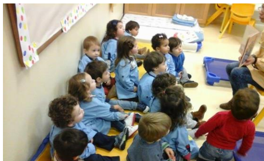
Fig. 37 - Leitura da história "Todos no Sofá", utilizando o livro e fantoches de dedo.