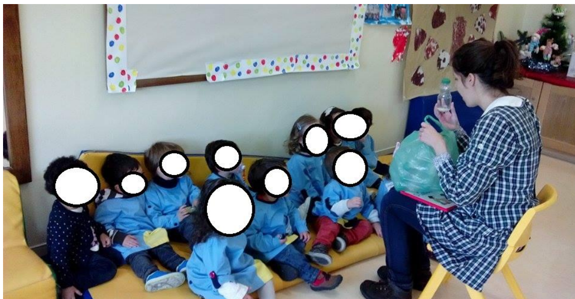
Figura 32: A estagiária apresenta a atividade às crianças.

Vai retirando do saco uma garrafa de cada vez e em simultâneo vai mostrando os diferentes sons.