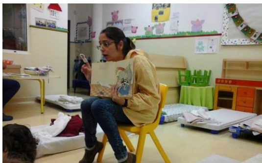
Fig. 36 - Leitura da história "Todos no Sofá", utilizando o livro e fantoches de dedo.