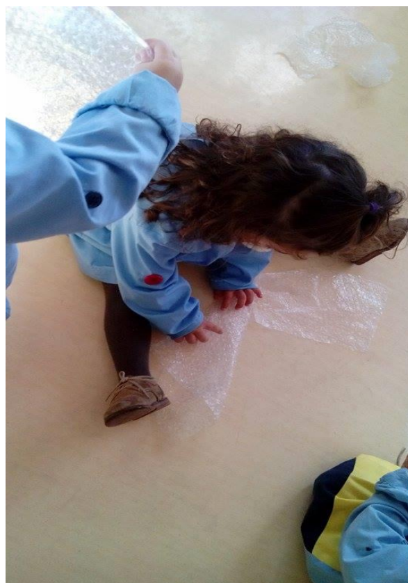
Figura 14 – As crianças exploram o material.