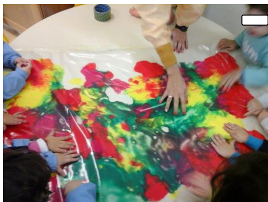
Fig. 39 - Exploração livre de um plástico transparente com diferentes tintas no seu interior.