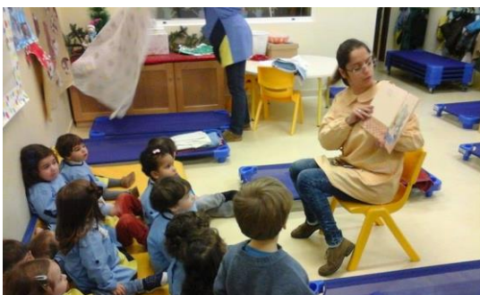
Fig. 34 - Leitura da história "Todos no Sofá", utilizando o livro e fantoches de dedo.