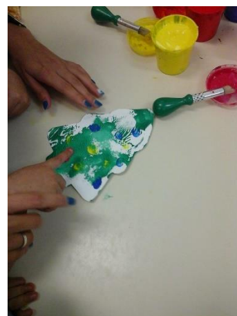
Figura 17 – Estagiária “Uma bola azul, duas bolas azuis, três bolas azuis”