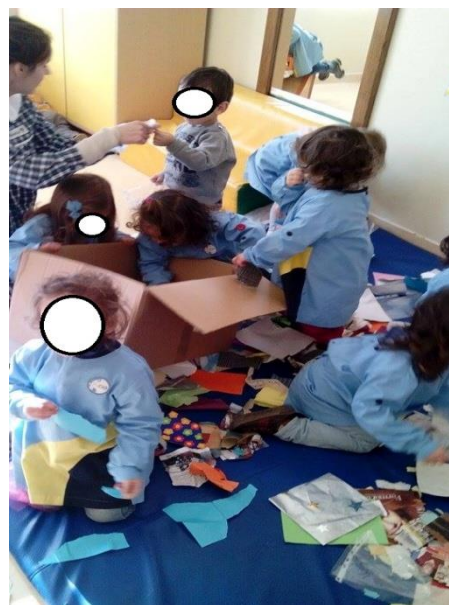
Figura 4 – Estagiária: “ – Olha aqui este tecido/papel. De que cor é?”