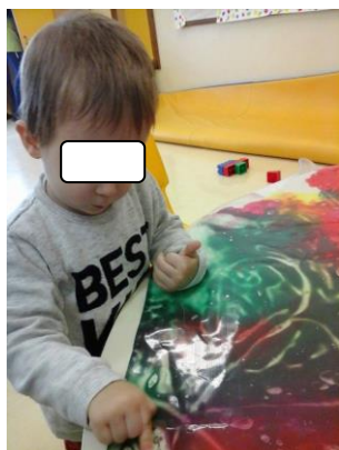
Fig. 38 - Exploração livre de um plástico transparente com diferentes tintas no seu interior.