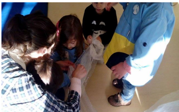
Figura 11 – Estagiária: “- Ouçam com atenção!”