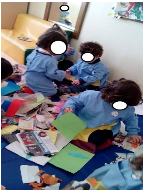
Figura 3 – As crianças exploram livremente os materiais.