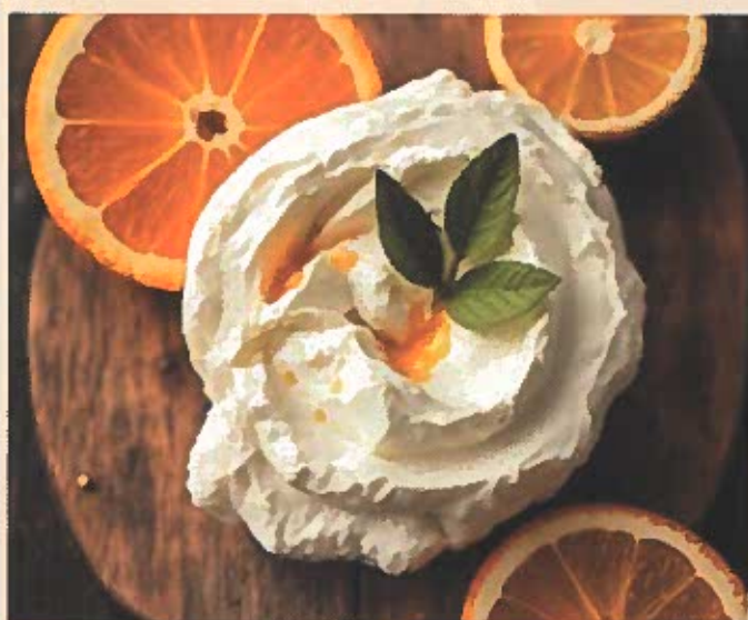
Figura 1. Queijo fermentado à base de kefir com 1% de incorporação de casca de laranja

O objetivo deste trabalho foi desenvolver um queijo kefir funcional enriquecido com casca de laranja natural e fermentada, promovendo a valorização de resíduos agroindustriais e a inovação na sustentabilidade alimentar (Figura 1).