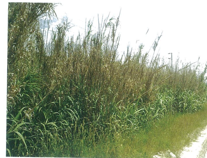
Figura 2 Aspeto geral do Arundo donax L. a margem de um caminho rural.

O interesse pelas culturas energéticas perenes iniciou-se na Europa a partir de meados da década de oitenta. De um conjunto de 20 espécies foram selecionadas 4 que provaram apresentar melhor adaptação e potencial produtivo: Miscanthus spp. ; Phalaris arundinacea ; Arundo donax e Panicum virgatum [8]. Vários autores têm provado o interesse