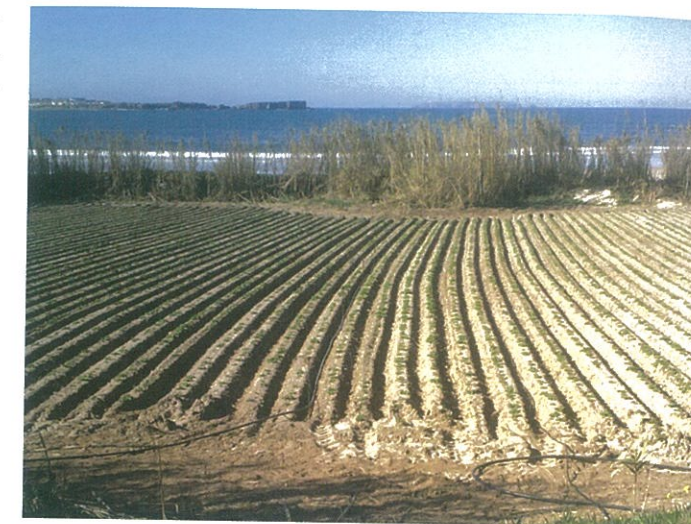
Figura 1 Utilização das canas ( Arundo donax L. ) na proteção de uma parcela agrícola junto ao litoral.

A cana apresenta uma enorme capacidade de se adaptar a diferentes condições ecológicas: embora prefira solos bem drenados e com