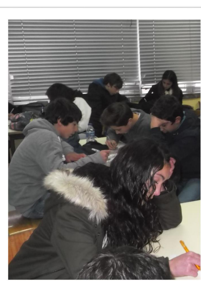
Figura 2 – Preenchimento dos Questionários

QUESTIONÁRIO FINAL: avaliar a compreensão dos conteúdos e a sua pertinência. • 2 perguntas de resposta fechada: legislação da publicidade ao tabaco em Portugal e estratégias de marketing utilizadas pela indústria tabaqueira para promover o consumo de tabaco. • Grelha com 5 parâmetros relativos à satisfação e qualidade da sessão (classificação de 1 a 5)