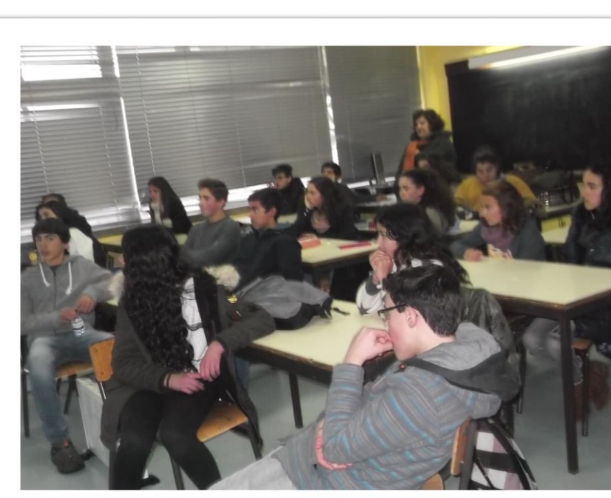
Figura 3– Dinamização da Sessão