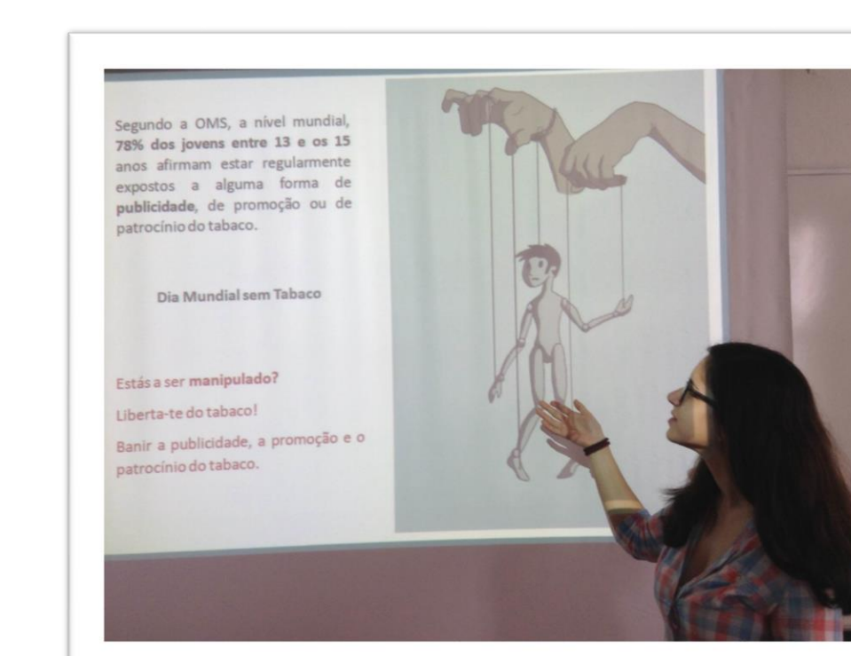
Figura 5 – Dinamização da Sessão