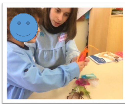
Figura 1- Atividade de preferência de cheiros