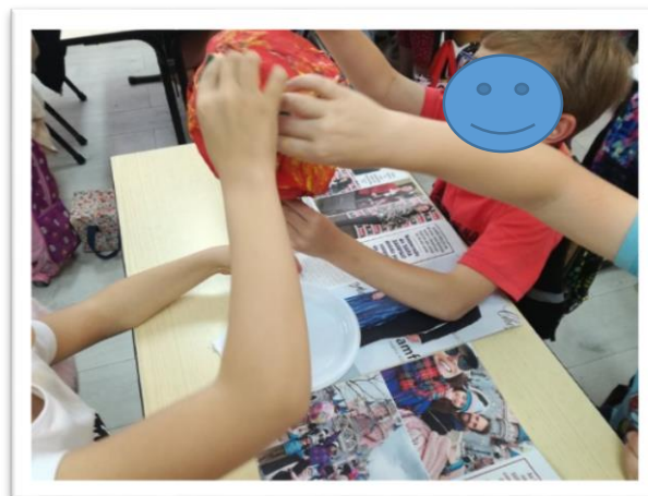
Figura 7- Construção da maquete do sistema solar