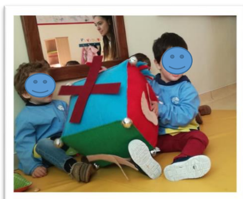
Figura 3- Atividade do cubo das cores

Considerou-se que o projeto implementado enriqueceu a nossa capacidade de analisar de uma forma mais reflexiva, bem como planear atividades que serão uteis futuramente.