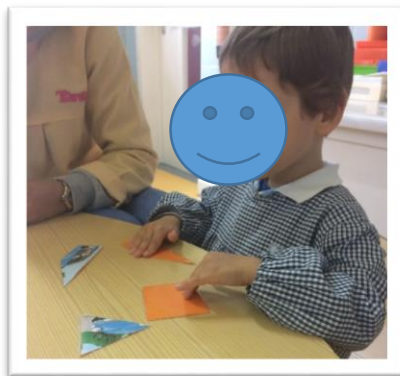
Figura 5- Atividade dos puzzles

Outra atividade destacada foi a realização de vários puzzles com imagens alusivas à história, que teve como principal objetivo desenvolver a capacidade de correspondência.