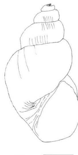
Figura 4 – Morfologia da concha de Galba truncatula (Biscaíno). Barra: 0,5 cm.

Apenas num único biótopo não foram encontrados moluscos e nos restantes Galba truncatula foi identificada em três ( Fig. 4 ). Não foram observadas formas larvares de Fasciola hepatica em nenhum dos exemplares coletados.