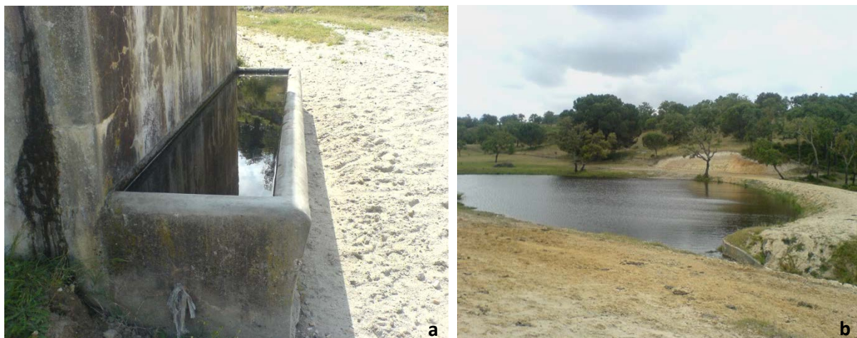
Figura 3 – Biotopos prospectados. a – antrópico; b – tipo misto.

represamento por intervenção humana, consistindo em valas de drenagem ou de irrigação, açudes, barragens, nascentes e pântanos. Apresentavam água com maior ou menor quantidade, dada a época do ano em que incidiram as observações, sendo uns de caráter permanente e outros temporários.