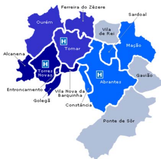
Figura 1. Mapa da Localização do concelho do Entroncamento

O Concelho do Entroncamento, está localizado no centro do País, o Entroncamento, de características essencialmente planas, situa-se na transição entre a Charneca e a Zona de Pinhal e integra-se no clima moderado do Vale do Tejo.