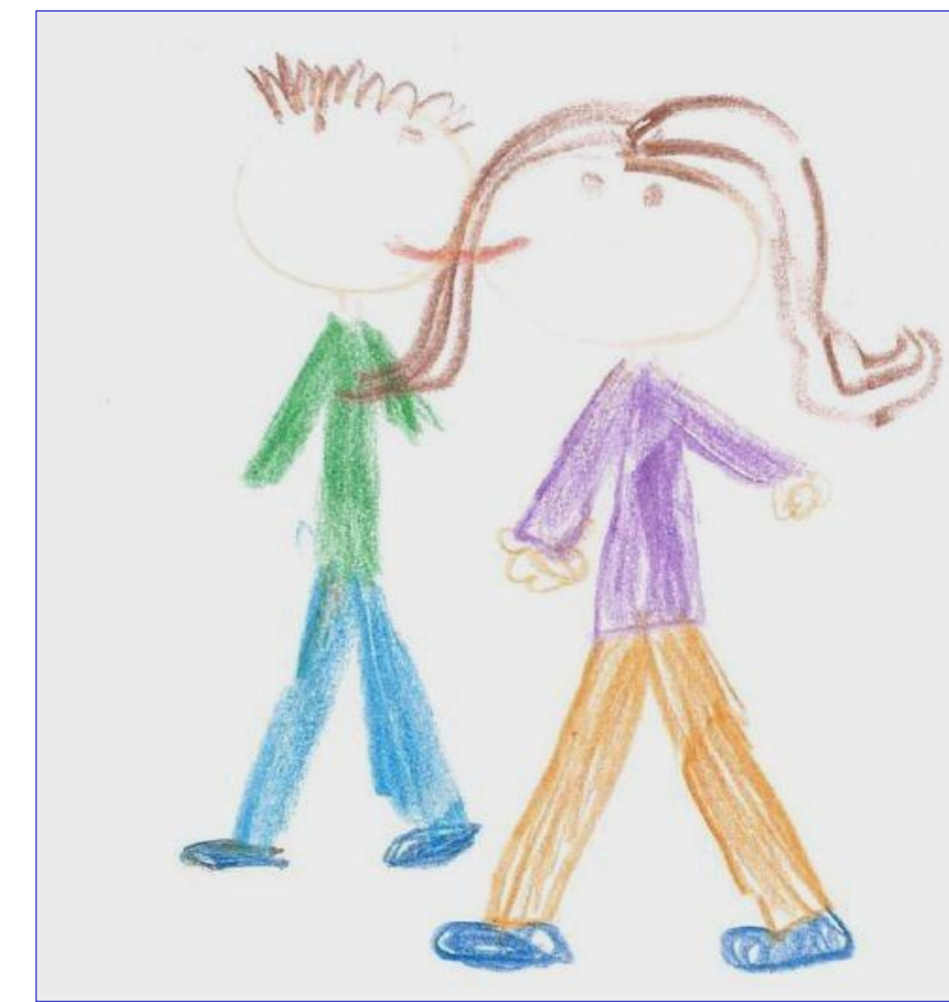
Figura 5. Desenho sobre a origem dos bebés ("...um homem e uma mulher que gostam um do outro", Progenitores-afetivo).