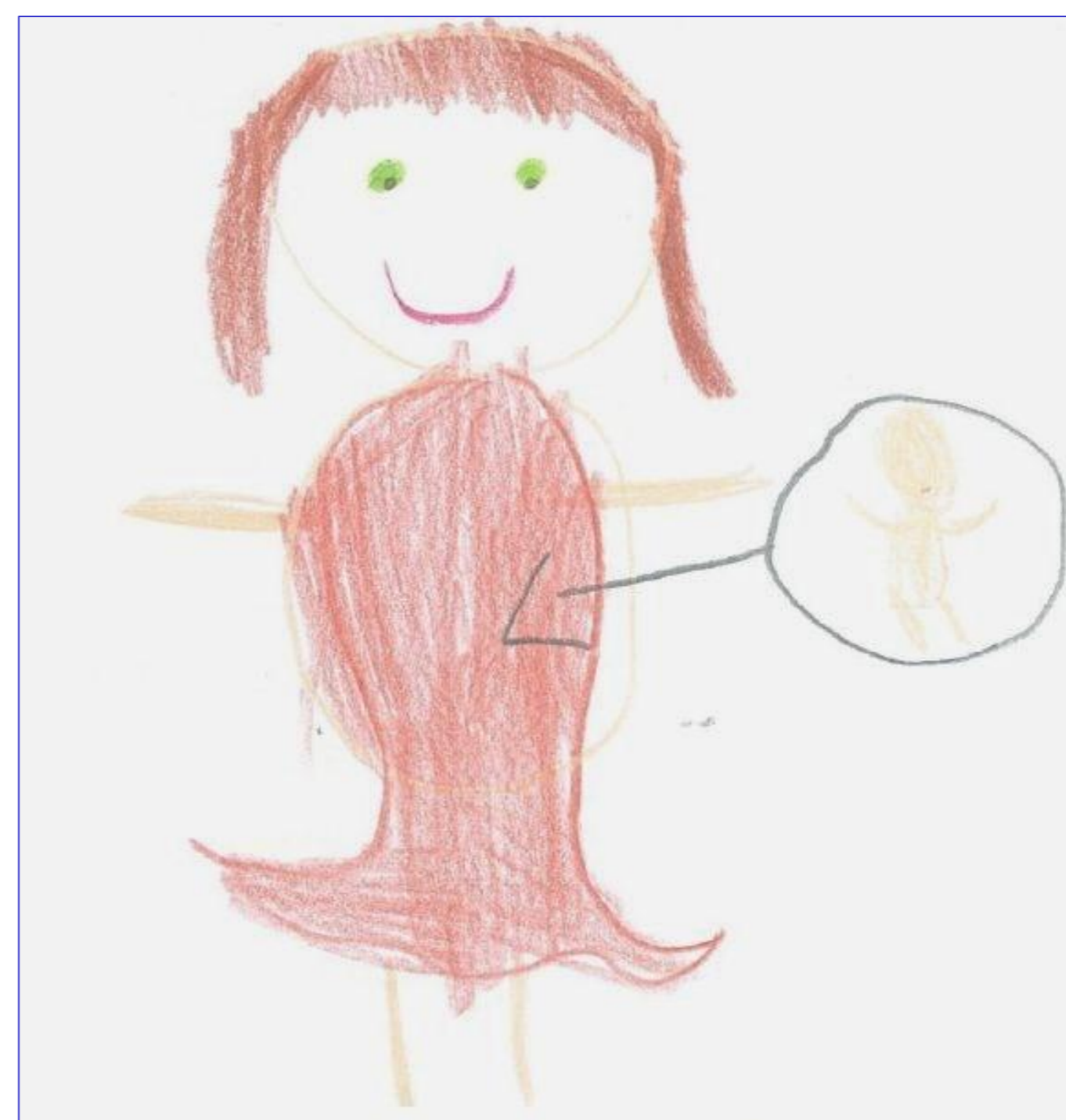
Figura 2. Desenho sobre a origem dos bebés ("Eu desenhei uma mãe grávida", Progenitora-afetividade).