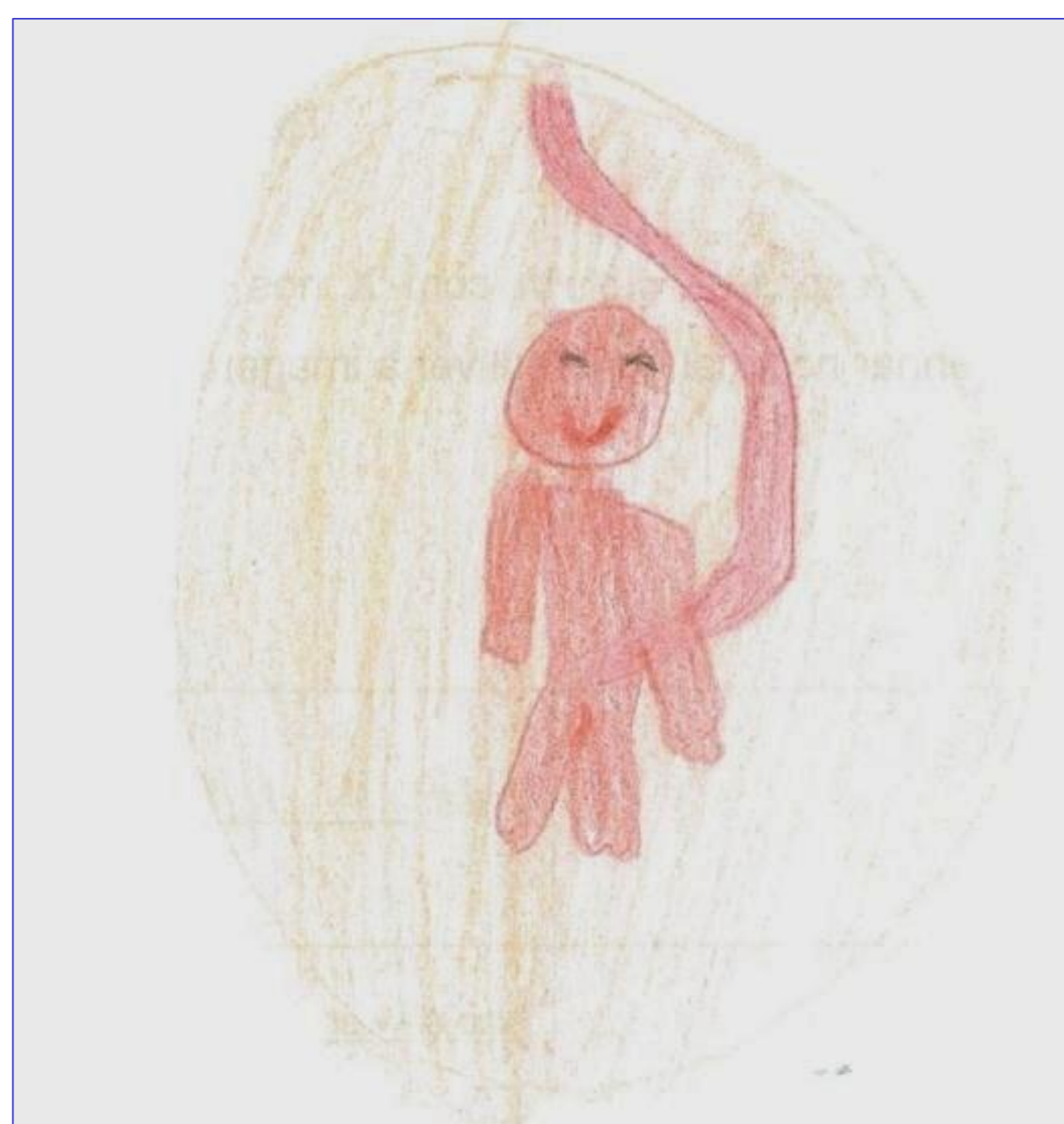
Figura 3. Desenho sobre a origem dos bebés ("Eu desenhei um bebê na barriga da mãe", Progenitora-biológico/afetivo).