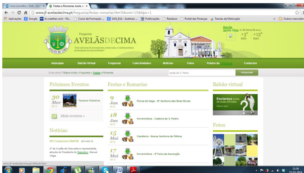
Figura n.º 4 – Aspeto geral do sítio da junta de freguesia, com referência às Festas e Romarias

Consideram-se atores de governança de terceira geração, muito interventivos e seletivos na forma de atuar, pois têm privilegiado e criado formas distintas de comunicar com os seus municípios, apostando nas relações de proximidade, de trabalho em parceria e de informação. Enaltecem a disponibilidade e abertura ao público, diária, dos serviços da junta de freguesia, alguns dos quais gratuitos, como a certificação de documentos. Destacam a estrutura e conteúdos do sítio próprio (figura n.º 4 e n.º 5), dinâmico e atualizado com muita regularidade, com visualização integral e documental das principais intervenções privadas e públicas que envolvam a freguesia, aludindo inclusive aos documentos emanados das assembleias de freguesia e respetivos editais públicos, assim como a qualquer evento a realizar numa associação local ou festividade local. São seus desejos, a criação, ainda durante este mandato, de eventos culturais coletivos.