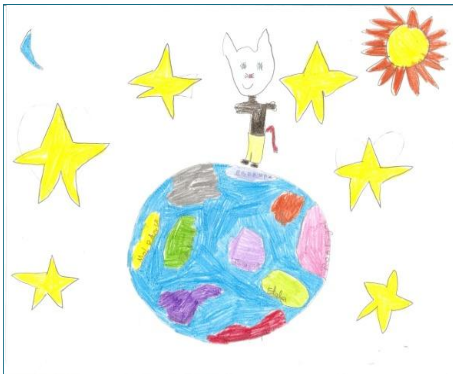
Figura 7. Localização geográfica do lobo.