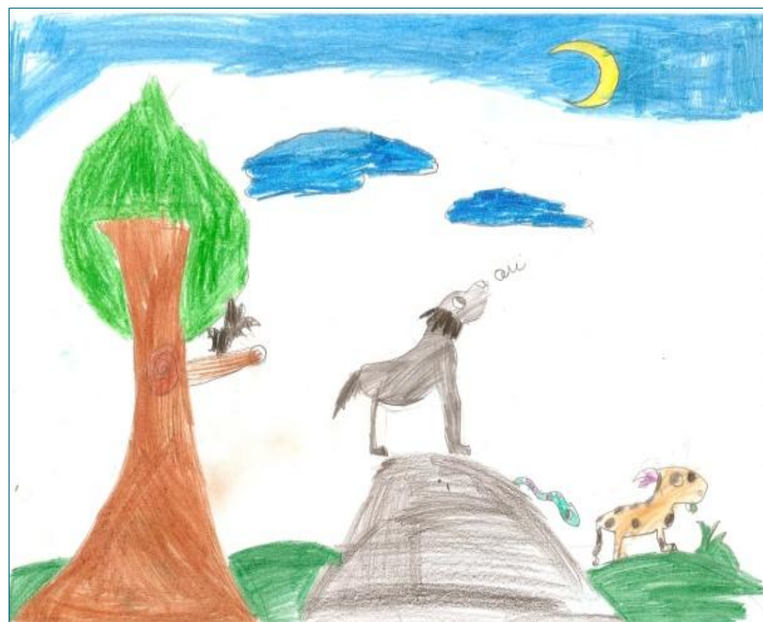
Figura 2: O lobo a uivar e/ou ao luar.