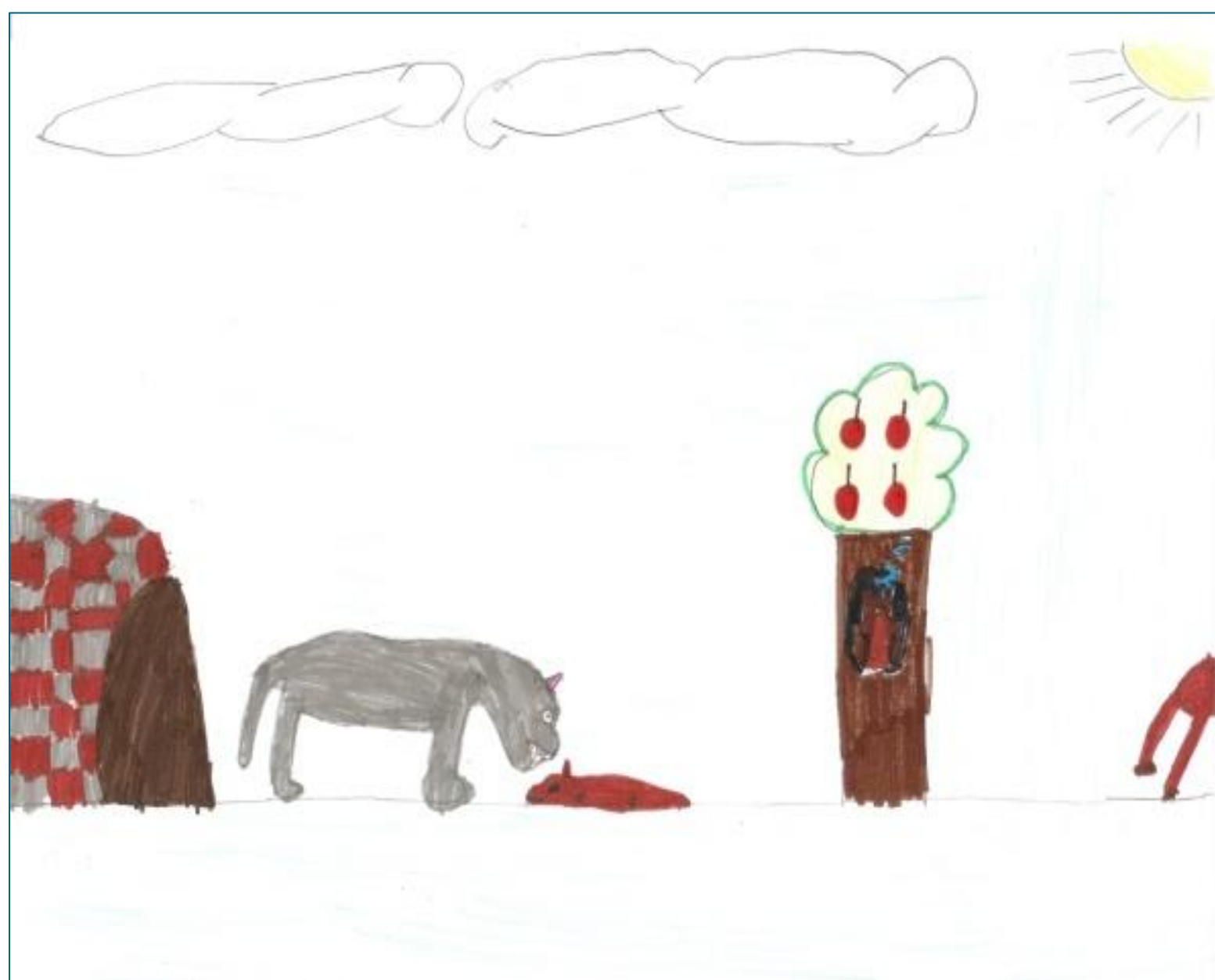
Figura 5. O lobo predador.