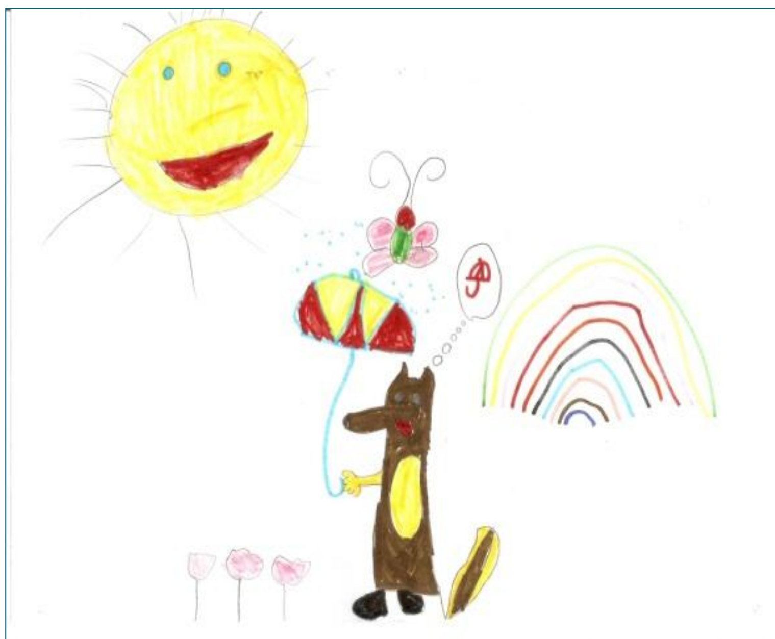
Figura 3: O lobo e/ou o seu contexto personificado.