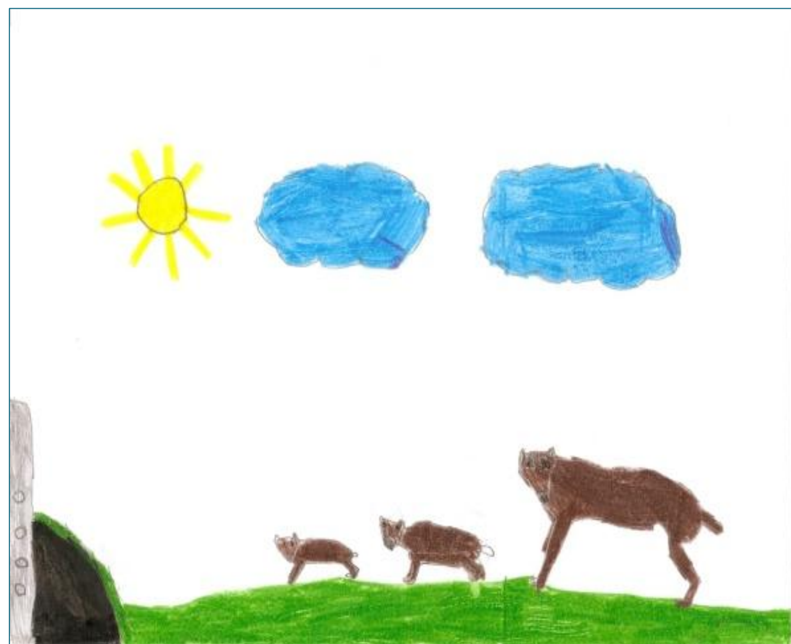
Figura 6. O lobo em alcateia.