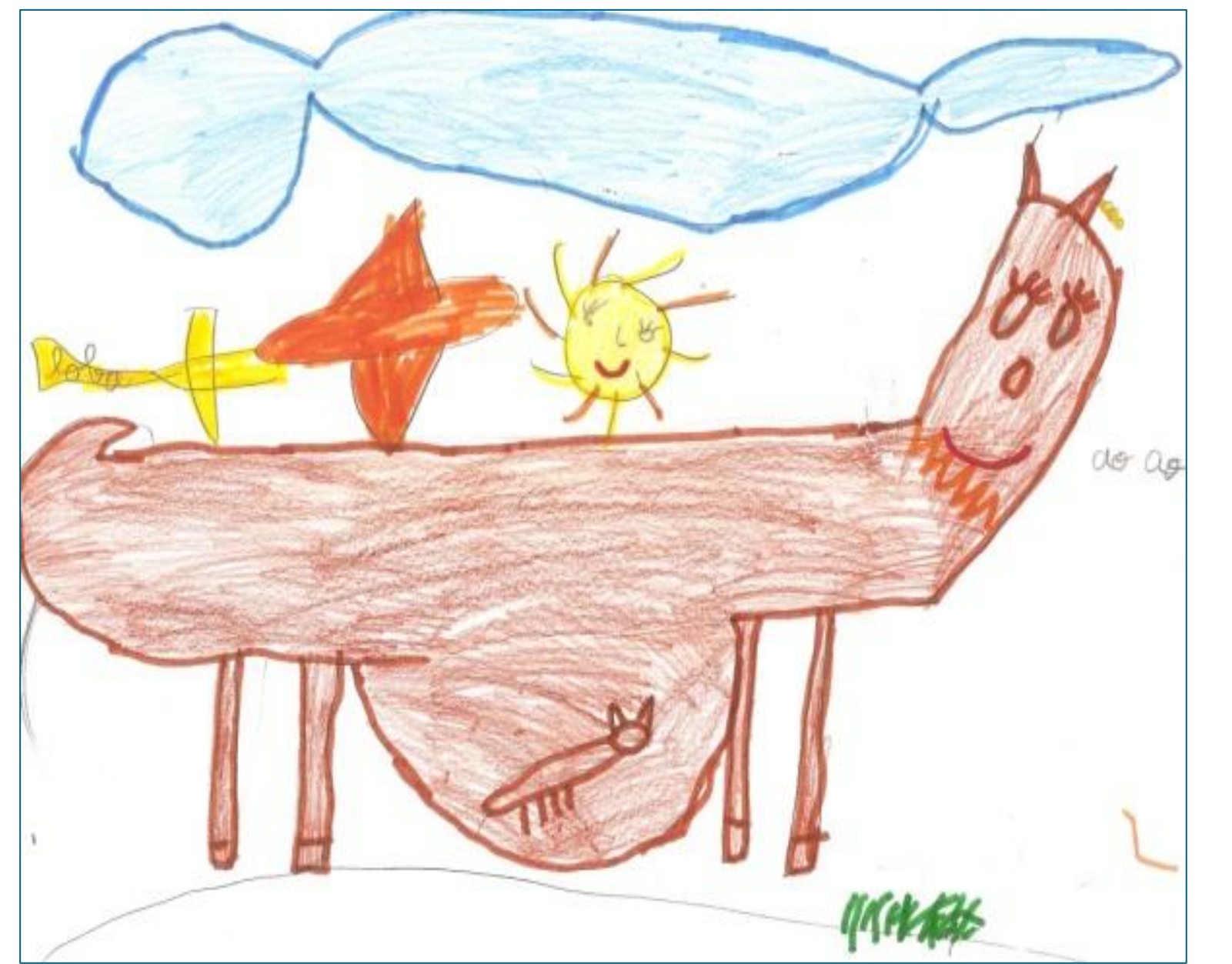
Figura 8. A reprodução do lobo.