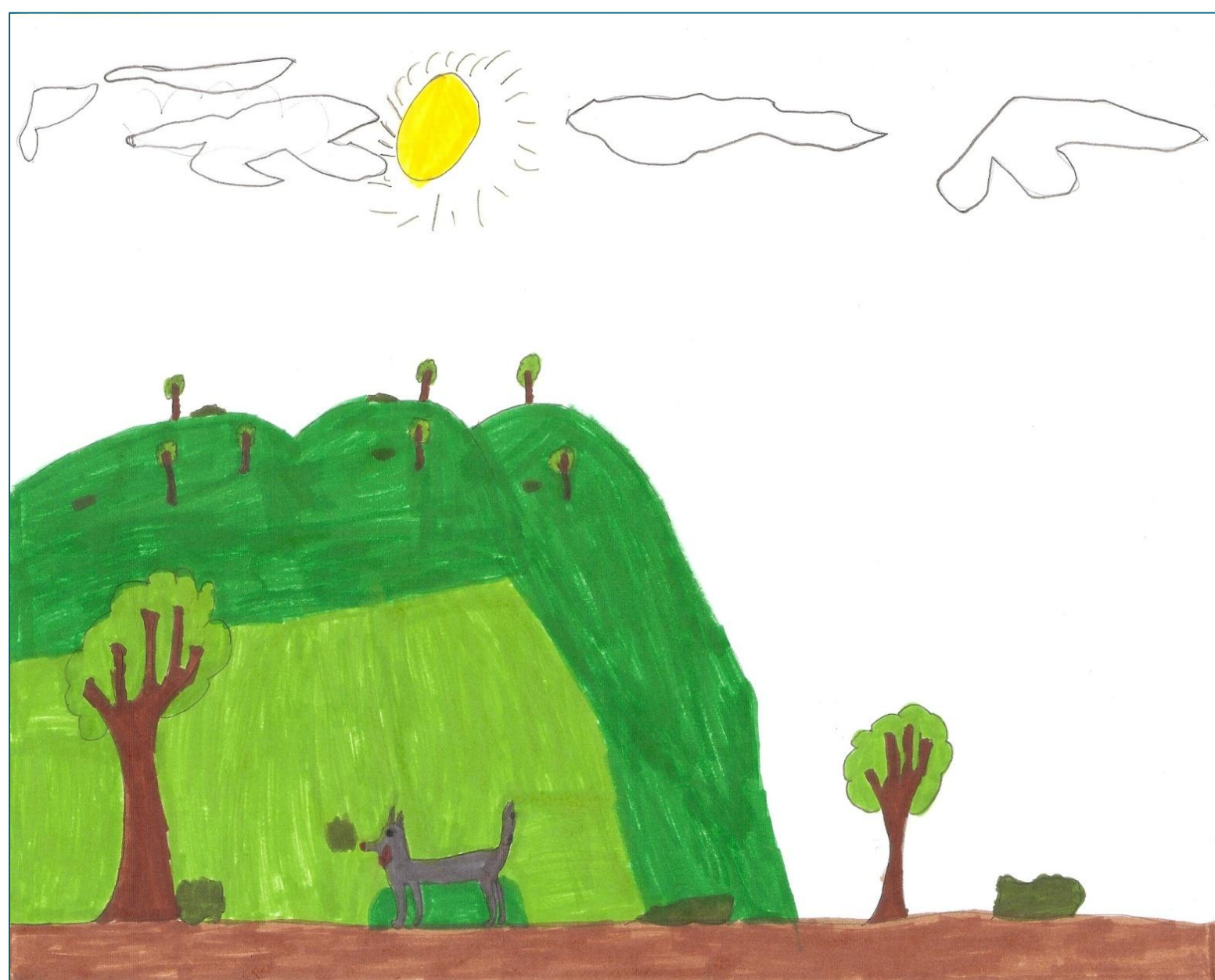
Figura 1. Enquadramento ecológico do lobo.

Para aferir quais as conceções dos alunos do 1.º CEB acerca do tema, foi utilizada como metodologia a análise iconográfica dos seus desenhos, tendo por base categorias de codificação das representações do lobo. Para tal, foram classificados 164 desenhos de alunos dos 1.º e 2.º anos, com idades compreendidas entre os 6 e os 8 anos, utilizando as seguintes categorias de análise: 1) Enquadramento ecológico do lobo; 2) O lobo a uivar e/ou ao luar; 3) O lobo e/ou o seu contexto personificado; 4) O lobo mau; 5) O lobo predador; 6) O lobo em alcateia; 7) Localização geográfica do lobo; 8) O lobo em cativeiro; 9) O lobo e o caçador; e 10) A reprodução do lobo.