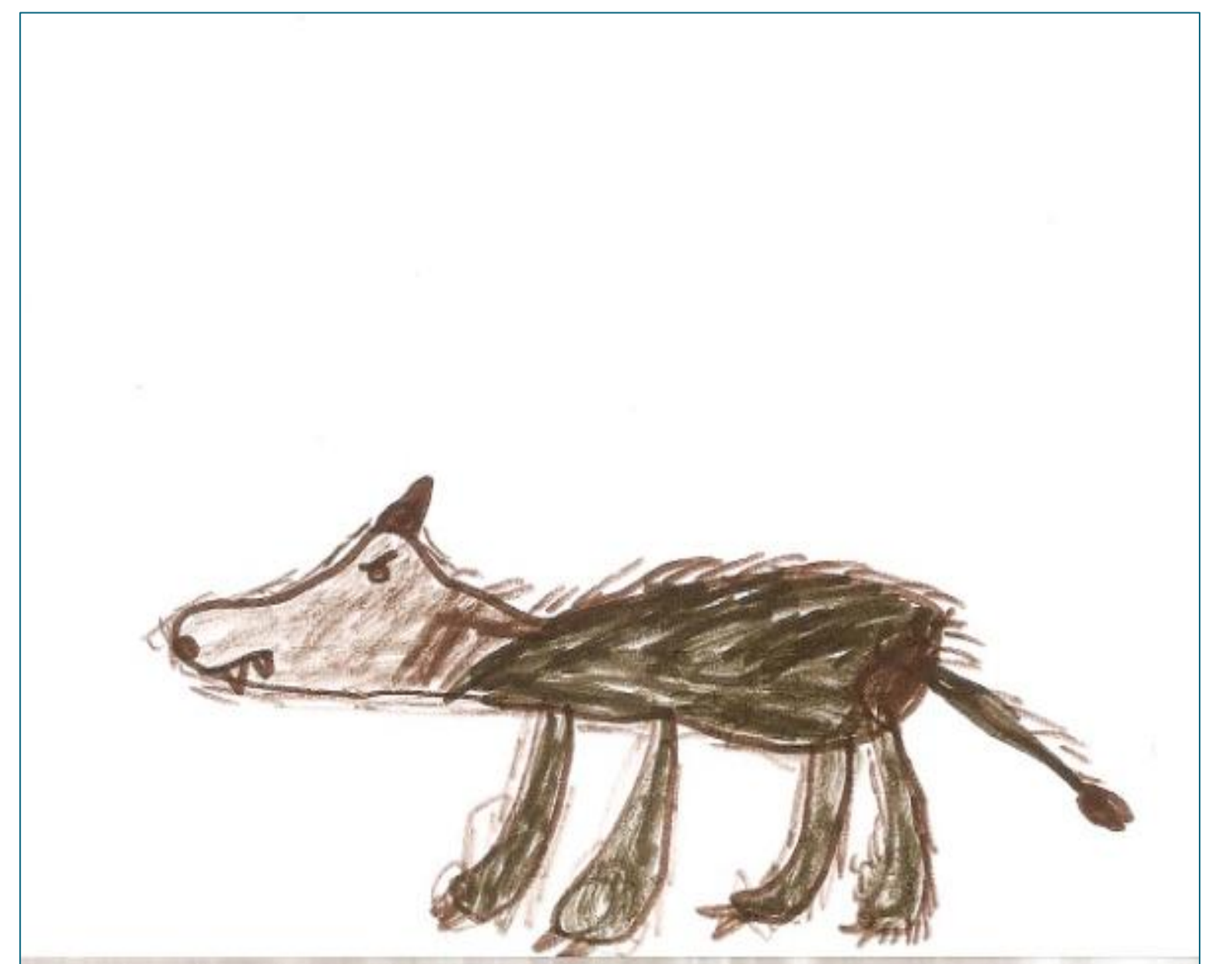
Figura 4: O lobo mau.