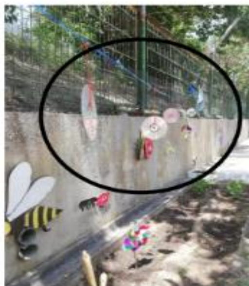
Figura XX- “Resultado da Atividade- “Proteção da horta” ”