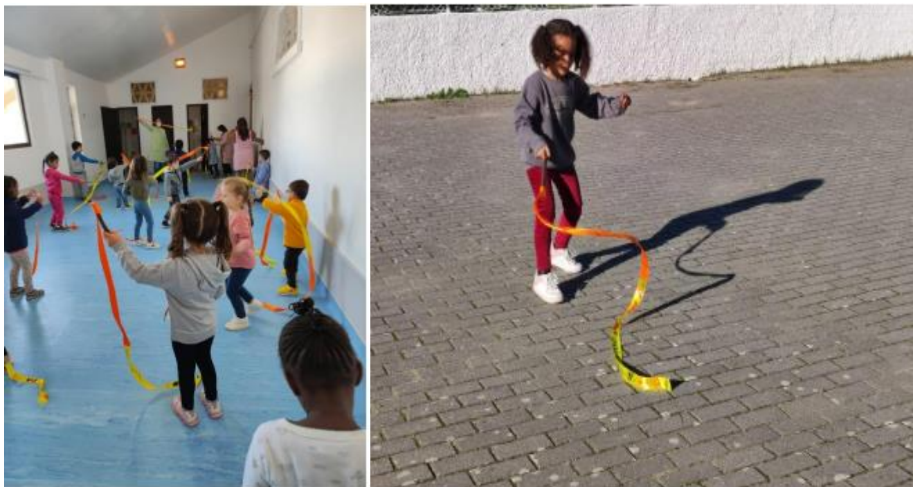
Figura XXIX- “Resultado da Atividade- “Ritmicamente felizes” ”