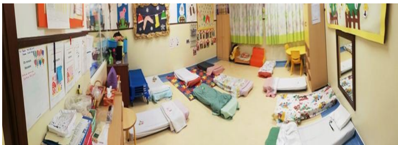
Figura VIII- "Imagem da Sala de creche"