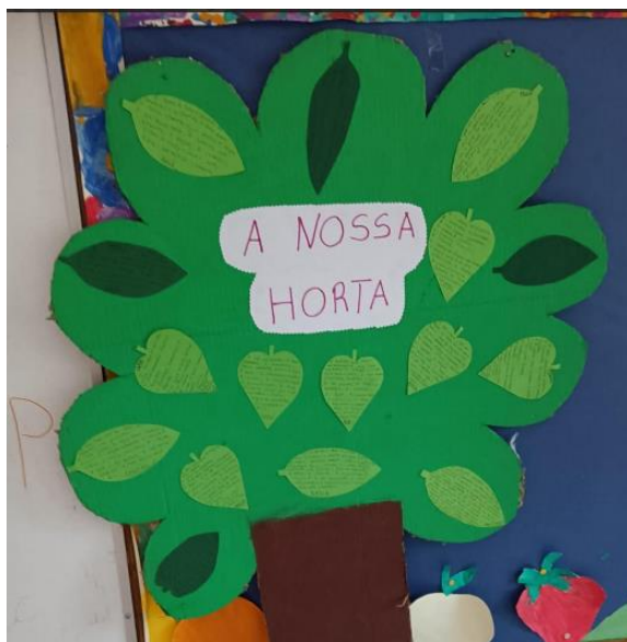
Figura IV- "Atividade Avaliação do Projeto"

De certo modo, embora tenha sentido que foi uma tarefa de maior dificuldade o envolvimento do grupo, penso que consegui um bom resultado porque as respostas das crianças permitiram compreender a avaliação que fizeram do nosso projeto e senti que foi um processo muito positivo na sua vida. Com a conclusão deste projeto e em especial nesta atividade tinha alguns objetivos que foram atingidos pelo grupo tais como serem capazes de participar nas decisões sobre o seu processo de aprendizagem, cooperarem com outros no processo de aprendizagem e desenvolverem uma atitude crítica e interventiva relativamente ao que se passa no mundo que os rodeia.