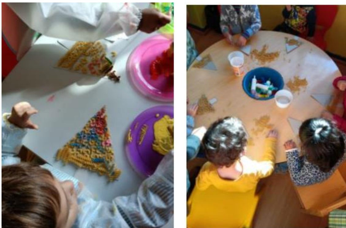
Figura XXIII- “Resultado da Atividade- “Árvores de Natal diferentes” ”