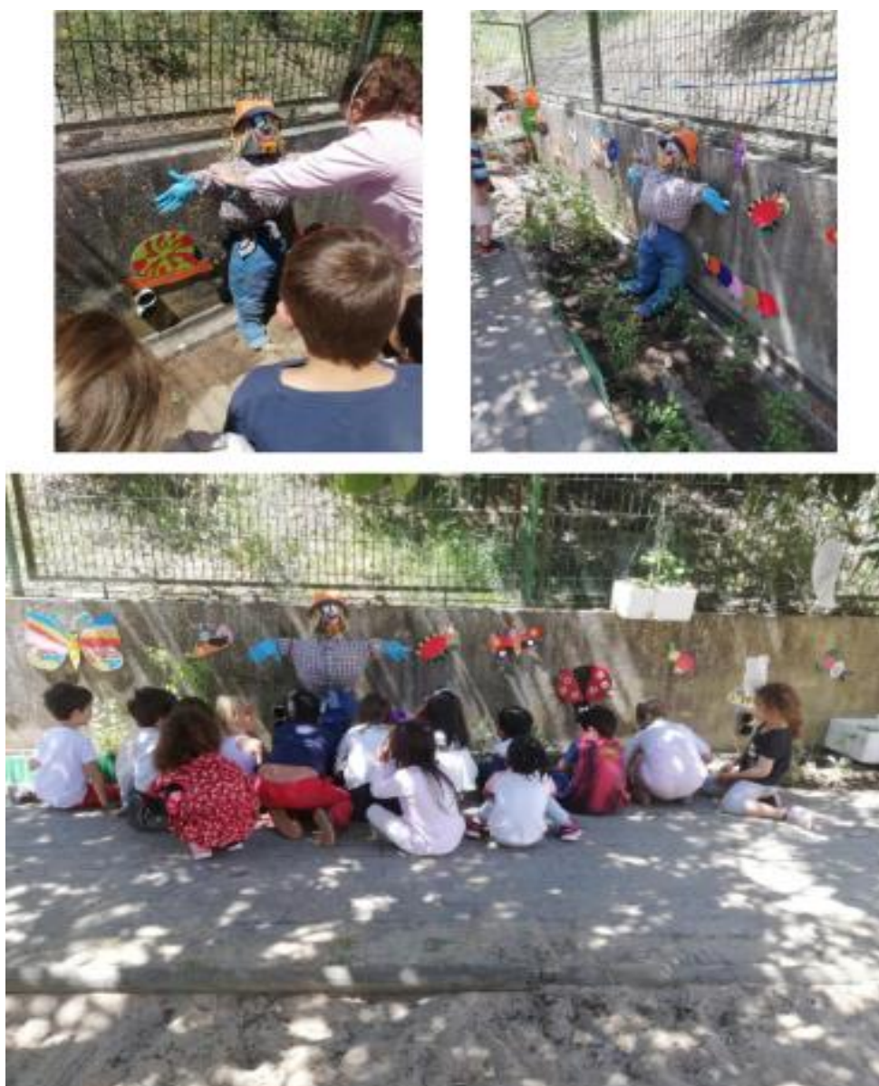
Figura XVIII- “Resultado da Atividade- “Construção de um espantalho” ”