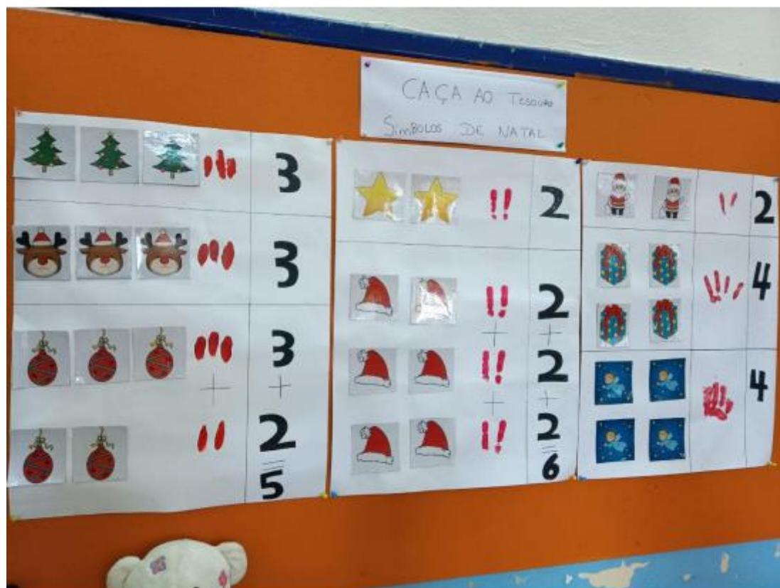
Figura XXV- “Resultado da Atividade- “Caça ao Tesouro” ”