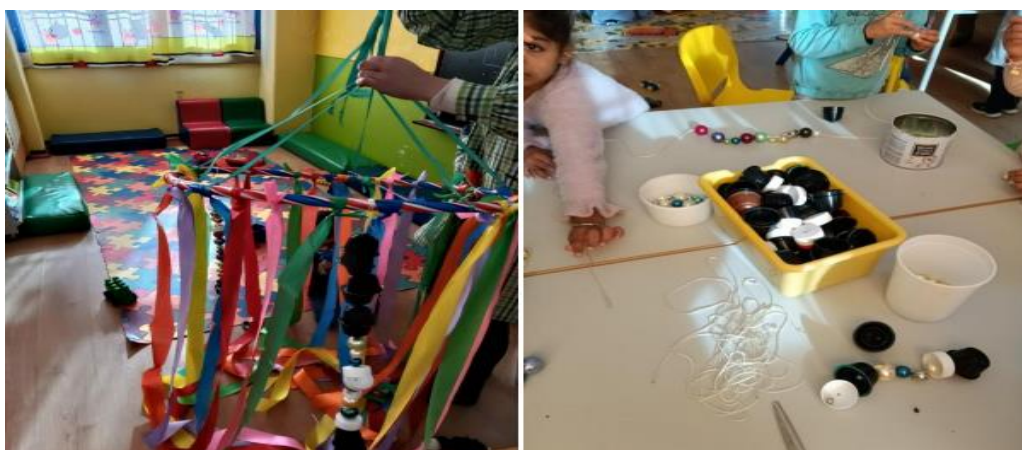
Figura VI- "Atividade Teatro da Arcos da Amizade"

que para além dos objetivos de a atividade terem sido conseguidos, as crianças conseguiram ainda adquirir capacidade de participar nas decisões sobre o processo de aprendizagem, adquiriram capacidade de cooperar uns com os outros no processo de aprendizagem, adquiriram e desenvolveram capacidades expressivas e criativas através de produções plásticas e manifestaram ainda comportamentos de preocupação com a conservação da natureza e respeito pelo ambiente.