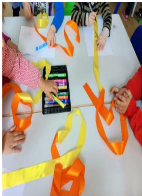
Figura XXVII- “Resultado da Atividade- “À descoberta da dança” ”