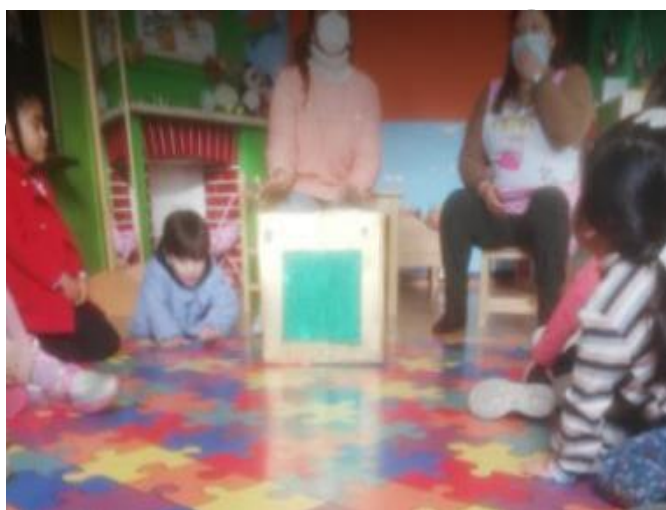
Figura V- “Atividade Caixa Mágica”