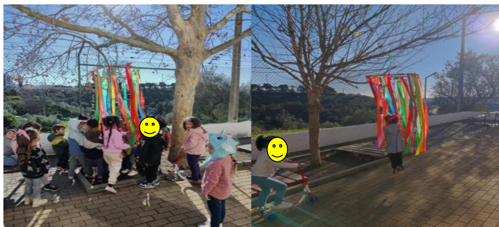
Figura VII- "Atividade Arcos da Amizade"

Em jeito de conclusão, a realização destes três estágios foi muito positiva, pois consegui experienciar contextos socioeducativos diferentes e ter a oportunidade de observar educadoras cooperantes com métodos de trabalho totalmente distintos.