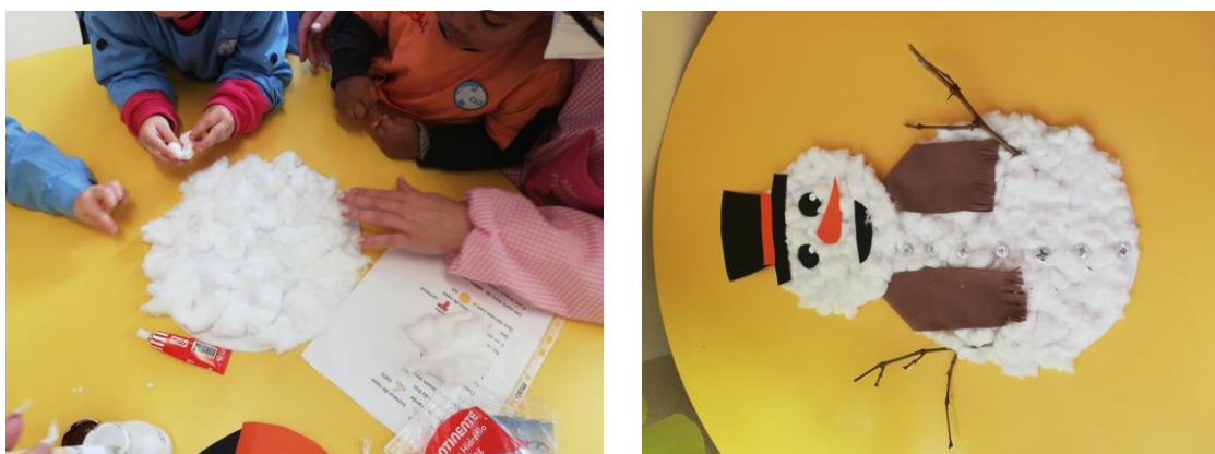
Figura I- "Atividade Boneco de Neve"

Decidi colocar apenas esta atividade, embora tenhamos criado várias para o projeto de intervenção, porque foi a única a ser implementada do projeto. Não a protagonizei, porque eu iria implementar a atividade seguinte, mas o estágio foi cancelado devido à pandemia covid 19.