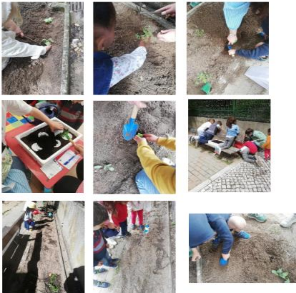
Figura XVI- “Resultado da Atividade- “Plantar e semear na nossa horta” ”