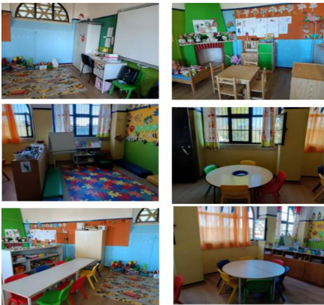
Figura XXI- "Imagens da sala de Jardim de Infância"