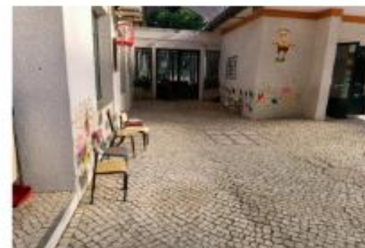
Figura XII- "Imagens da sala e espaço exterior do Jardim de Infância"