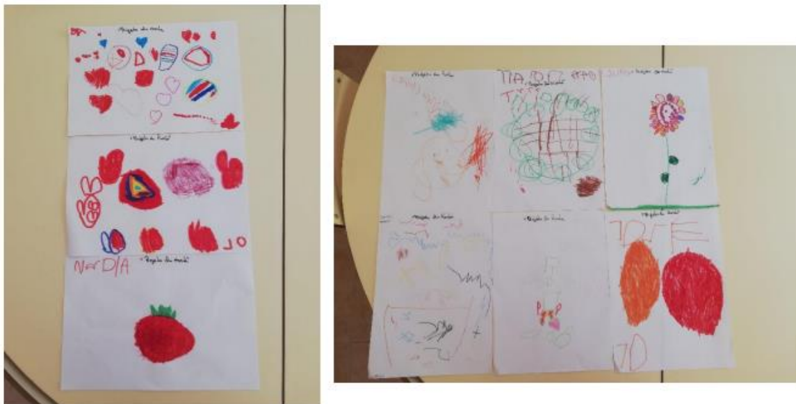
Figura XIV- “Resultado da Atividade- “Introdução ao tema” ”