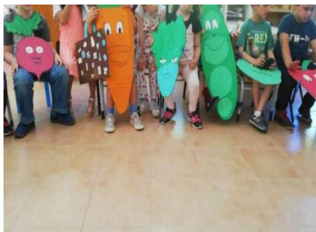
Figura III- “Atividade Teatro da Revolta dos Vegetais”