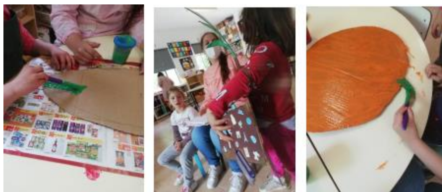
Figura II- "Atividade Teatro da Revolta dos Vegetais"

No dia em que realizei o teatro com as crianças houve uma criança que se sentiu muito nervosa para participar e tive de alterar as personagens momentos antes. Consegui que todos participassem, o que para mim penso ter sido um grande objetivo realizado, outro dos objetivos que senti que foi realizado foi a união e o trabalho em grupo que consegui promover, mesmo com um grupo heterogéneo e com algumas crianças com necessidades educativas especiais, todos participaram e demonstraram interesse em realizar as tarefas. Propus alguns objetivos que foram cumpridos com a realização desta atividade tais como recriar uma história em atividades de jogo dramático individualmente e com outros, representar personagens e situações através da recriação de uma história, aprender a apreciar espetáculos teatrais dando a sua opinião e desenvolver capacidades expressivas e criativas através da recriação em desenho, acabando por compreender que maioritariamente foram cumpridos os objetivos com a realização desta atividade.