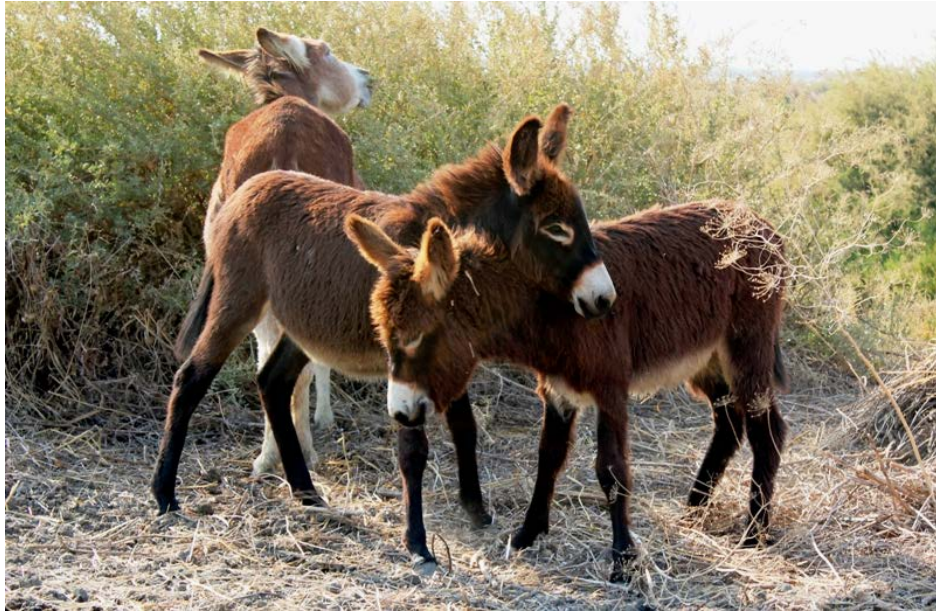
Figura 1 – Três exemplares do núcleo de asininos residente nas Salinas do Samouco, Alcochete.

Os animais são mantidos em sistema semiextensivo e estão sujeitos ao mesmo tipo de estabulação e à mesma alimentação e pastagem. Passam o dia na pastagem e ao fim da tarde são recolhidos para um abrigo onde permanecem durante a noite.