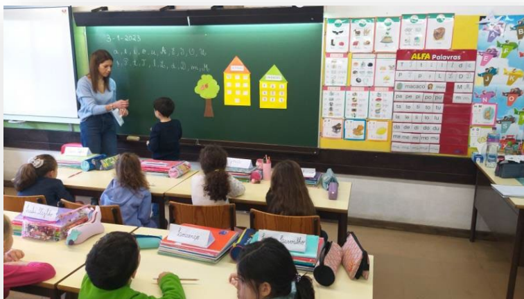
Figura 6 - Atividade de Revisão da Dezena com Recurso a Materiais Manipuláveis

Apesar do envolvimento geral positivo, foi notória alguma dificuldade por parte de dois alunos na realização dos cálculos quando questionados individualmente, o que foi tido em consideração na elaboração das posteriores atividades e momentos de intervenção.