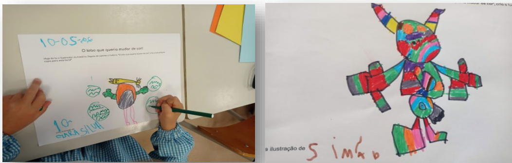
Figura 3 - Capas criadas pelas crianças para o livro "O Lobo que queria mudar de cor"

No decurso da leitura, foi possível identificar algumas dificuldades relacionadas com a sucessão dos dias da semana, nomeadamente na compreensão das noções de anterioridade e posterioridade. Esta observação revelou-se relevante para o ajustamento das práticas pedagógicas, tendo sido decidido incorporar, nos momentos de marcação de presenças, um pequeno jogo de perguntas que visa reforçar esta aprendizagem: “Se hoje é quarta-feira, que dia será amanhã?” ou “E ontem, que dia foi?”. Esta estratégia pretende consolidar a sequência temporal dos dias da semana de forma lúdica e contextualizada, promovendo a construção de saberes significativos e ajustados ao nível de desenvolvimento do grupo.