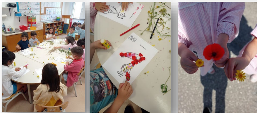
Figura 4 - Passeio ao campo para a recolha de elementos naturais e decoração do lobo da história "O Lobo que queria mudar de cor"

A avaliação foi realizada através de instrumentos que procuraram captar de forma abrangente o envolvimento e a evolução das crianças ao longo da intervenção. A observação direta das atividades constituiu uma das principais estratégias, permitindo-nos analisar como as crianças interagiram, participaram e se expressaram durante as propostas pedagógicas. Complementarmente, efetuámos registos fotográficos com o objetivo de documentar momentos significativos da prática e possibilitar uma análise mais aprofundada das dinâmicas individuais e grupais.