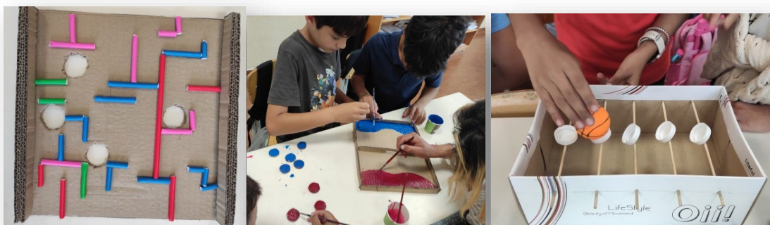
Figura 8 - Atividade de construção de jogos no âmbito da proposta STEM

A segunda atividade centrou-se numa abordagem STEM, integrando áreas como Tecnologia, Engenharia, Matemática e Ciências Sociais. Os alunos foram organizados em grupos e seguiram um guião orientador que incluía a definição de problemas sociais, visualização de um vídeo, registo de situações observadas e proposta de soluções. Cada grupo concebeu um jogo diferente para o Ponto de Encontro , atribuiu-lhe um nome e apresentou-o aos colegas. Apesar das condições meteorológicas terem impedido a utilização dos jogos no exterior, os alunos demonstraram envolvimento e cooperação ao jogá-los na sala de aula.