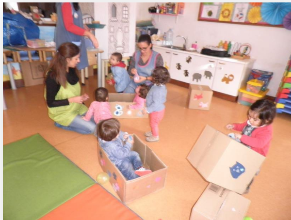
Figura 2- Atividade de Expressão Motora

A avaliação do projeto foi sustentada por diversos instrumentos, incluindo a observação direta, registos escritos e a recolha de evidências fotográficas e videográficas que documentaram o envolvimento das crianças nas atividades. Destaca-se também a utilização do diário de bordo, que funcionou como um instrumento de registo e reflexão contínua. Nele foram anotadas observações relevantes, decisões pedagógicas, dificuldades sentidas e estratégias adotadas, permitindo uma análise crítica do percurso realizado. Este processo incluiu ainda uma autoavaliação regular, que possibilitou refletir sobre a qualidade da intervenção, a postura profissional e a capacidade de adaptação ao contexto educativo. Paralelamente, realizámos reflexões semanais sobre as planificações, analisando a adequação das propostas, as aprendizagens emergentes e ajustando as intervenções sempre que necessário.