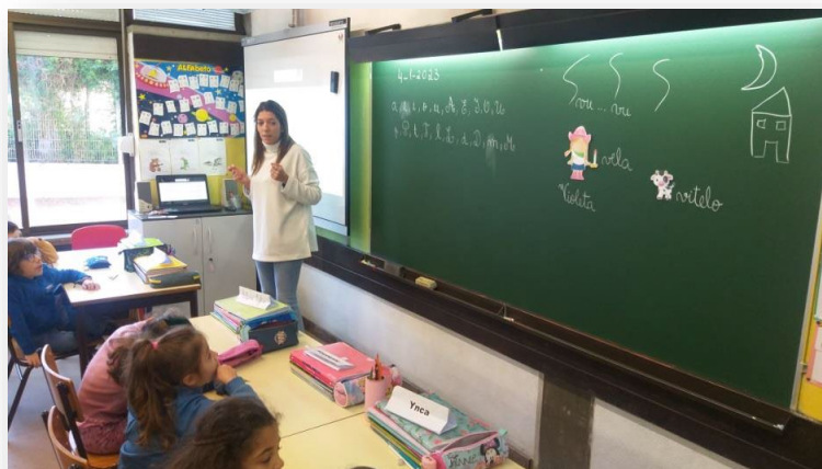
Figura 5 - Atividade de introdução à consoante "V"

Rodrigues, 2016). A associação entre imagem e palavra é uma ferramenta poderosa no processo de ensino-aprendizagem, especialmente na fase inicial da leitura.