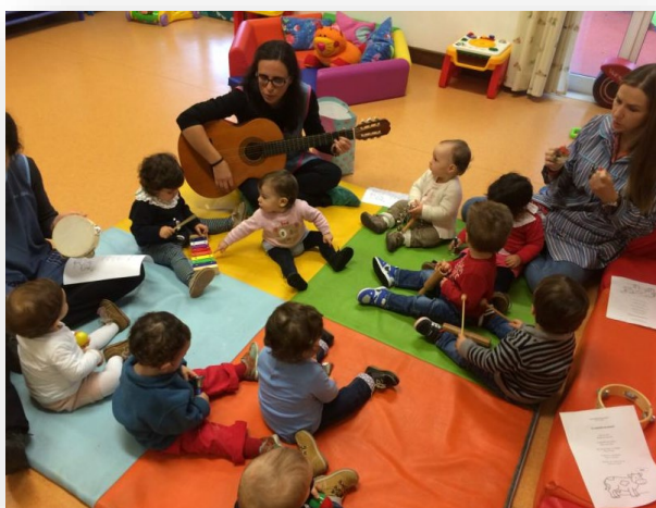
Figura 1 - Atividade musical

Os bebés mostraram grande receptividade à atividade. Demonstraram interesse visual e auditivo, participaram com entusiasmo na exploração dos instrumentos e reagiram positivamente à música. A diversidade de estímulos permitiu que cada criança se envolvesse à sua maneira, promovendo o desenvolvimento sensorial, motor e emocional de forma lúdica e significativa.