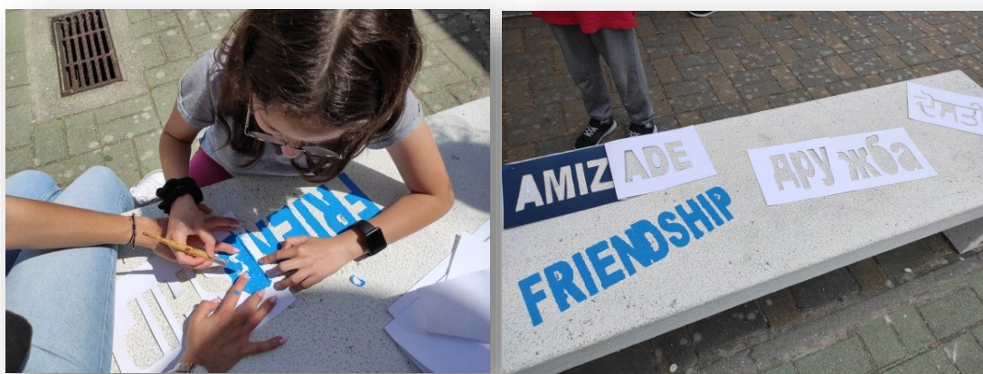
Figura 7 - Atividade de pintura do banco de recreio, designado Ponto de Encontro

A segunda atividade centrou-se numa abordagem STEM, integrando áreas como Tecnologia, Engenharia, Matemática e Ciências Sociais. Os alunos foram organizados em grupos e seguiram um guião orientador que incluía a definição de problemas sociais, visualização de um vídeo, registo de situações observadas e proposta de soluções. Cada grupo concebeu um jogo diferente para o Ponto de Encontro , atribuiu-lhe um nome e apresentou-o aos colegas. Apesar das condições meteorológicas terem impedido a utilização dos jogos no exterior, os alunos demonstraram envolvimento e cooperação ao jogá-los na sala de aula.