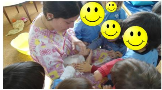
Ilustração 4 - Visita de um coelho à sala

Considerámos esta atividade importante, pois acreditamos que estas aprendizagens, nas quais a criança pode ver, tocar, cheirar são de extrema importância para desenvolver os seus sentidos, sendo que o contacto com animais para algumas crianças é um momento único, visto que, muitas crianças não têm essa possibilidade em casa.