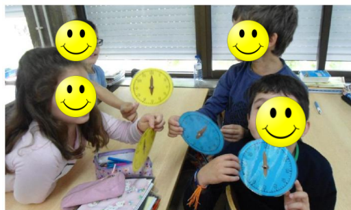
Ilustração 3 - Jogo das horas

Este jogo foi realizado várias vezes, sendo que, posteriormente, cada grupo mencionava as horas e os restantes tinham de representar com diferentes graus de dificuldade.