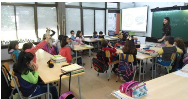
Ilustração 2 - Explicação e iniciação às horas

Para iniciar a atividade, comecei por solicitar horas exatas para que os mesmos se familiarizassem com o relógio e referissem a hora apresentada. Quando começámos a solicitar horas com minutos, quartos de hora ou meias horas, pude verificar que dentro de cada grupo existia um elemento que tinha mais facilidade em identificar o que era pedido e ajudava os que tinham mais dificuldades.