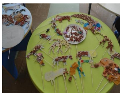
Ilustração 1 - Decoração dos fantoches da história "A que sabe a Lua?"

Na parte da tarde, depois de todas as crianças terem colorido o seu fantoche, foi realizada uma peça de teatro com os mesmos. Enquanto lia a história, cada criança tentava realizar com o seu fantoche os acontecimentos da história.