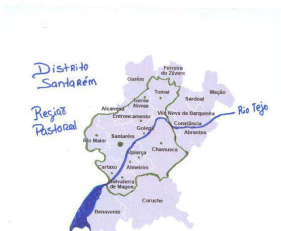
Figura 2: Limites da Diocese de Santarém

A assembleia plenária da Conferencia Episcopal do Patriarcado de Lisboa, decorreu em Fátima, de 21 a 26 de julho de 1971. Nesta assembleia foi discutida a problemática das novas dioceses e, tendo sido votada a proposta de criação da Diocese de Santarém, a qual obteve 12 votos a favor, 9 contra e 2 nulos (Ata da assembleia). Com a resignação de D. Manuel Cerejeira, em 10 de maio de 1971, fora nomeado D. António Ribeiro para o cargo de patriarca de Lisboa, tendo sido já este patriarca a presidir a esta assembleia. Após a votação, D. António Ribeiro deu por encerrado o assunto, enviando os resultados à Santa Sé.