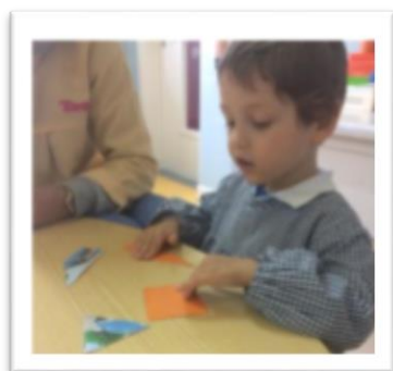
Figura 4 - Atividade sobre os meios de transporte (puzzle)

Perguntámos no final de cada puzzle concretizado, qual o meio de transporte que eles encontraram, todos conseguiram mencionar corretamente, no entanto, a maior parte teve dificuldades em formar a imagem correta, colocando muitas vezes as peças de “pernas para o ar” e não percebiam que o puzzle estava mal construído.