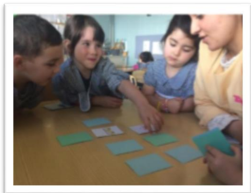
Figura 3 - Atividade sobre os meios de transporte

criança acertava, perguntávamos que meio de transporte é que tinham acertado, pelo que tinham de olhar para as suas cartas e referir qual era. A maioria conseguiu acertar.