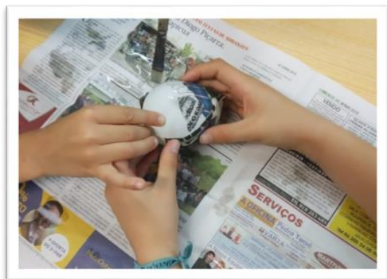
Figura 7 - Atividade sobre o sistema solar (construção dos planetas)

habituada a realizar atividades em grupo e a pares, sendo assim as atividades correram sempre bem e os alunos construíram em conjunto, partilhando os materiais.