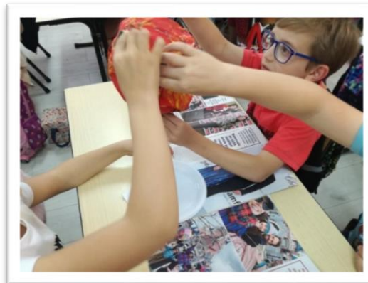
Figura 6 - Continuação da atividade sobre o sistema solar (construção dos planetas)