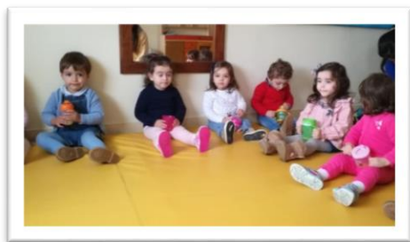
Figura 2 - Atividade sobre os cinco sentidos (paladar)

Mandei-os começar a beber todos ao mesmo tempo e só no final de todos beberem, perguntava qual era a fruta que se encontrava no sumo. Pedia para que quem soubesse pusesse o dedo no ar, que eu escolhia uma criança para responder. A maioria das crianças que questionei, acertou, mas não me soube dizer a diferença de um sumo para o outro, ou seja, a sua consistência.