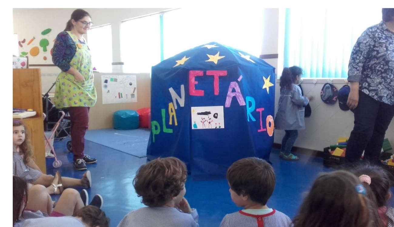
Figura 10 – Inauguração do Planetário