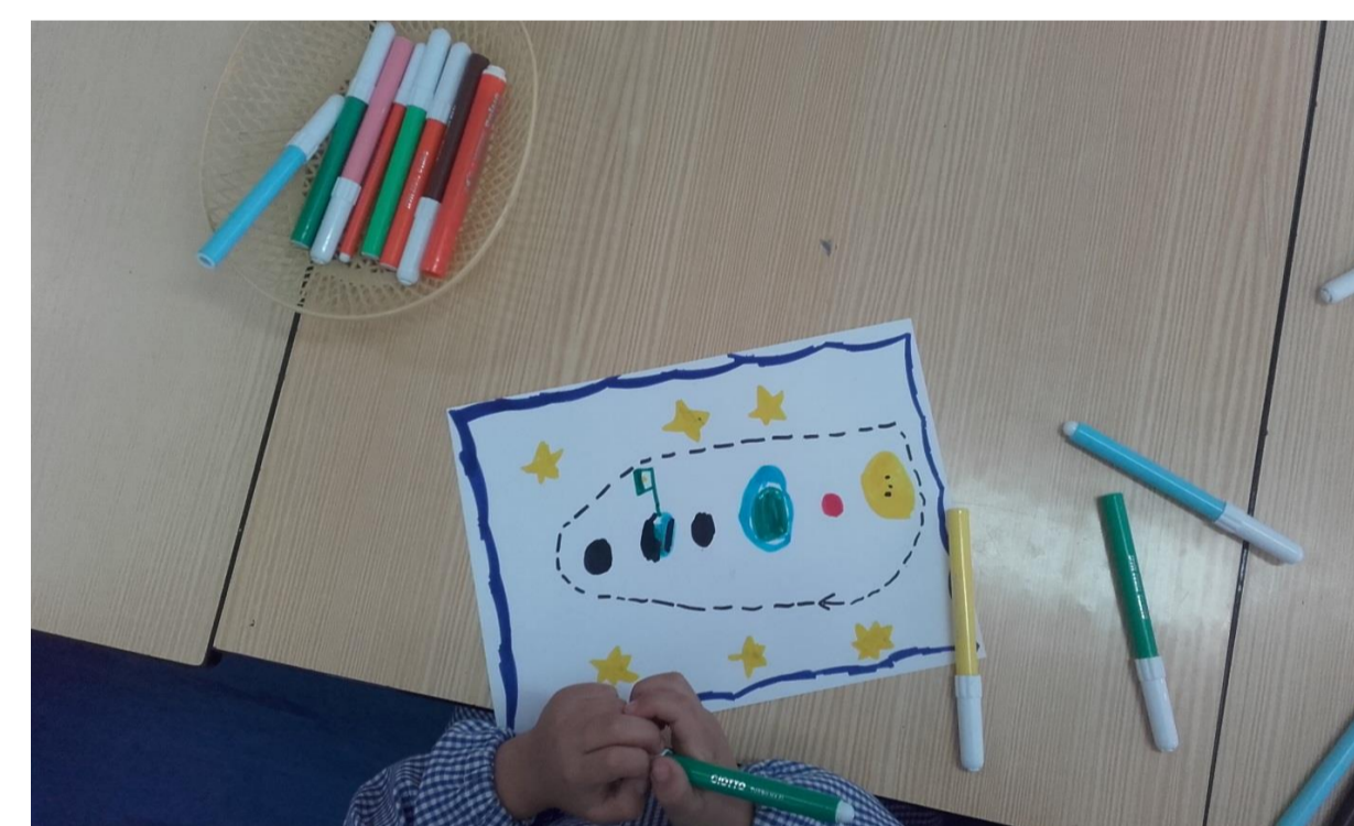
Figuras 7 e 8 – Desenho livre sobre o Sistema Solar