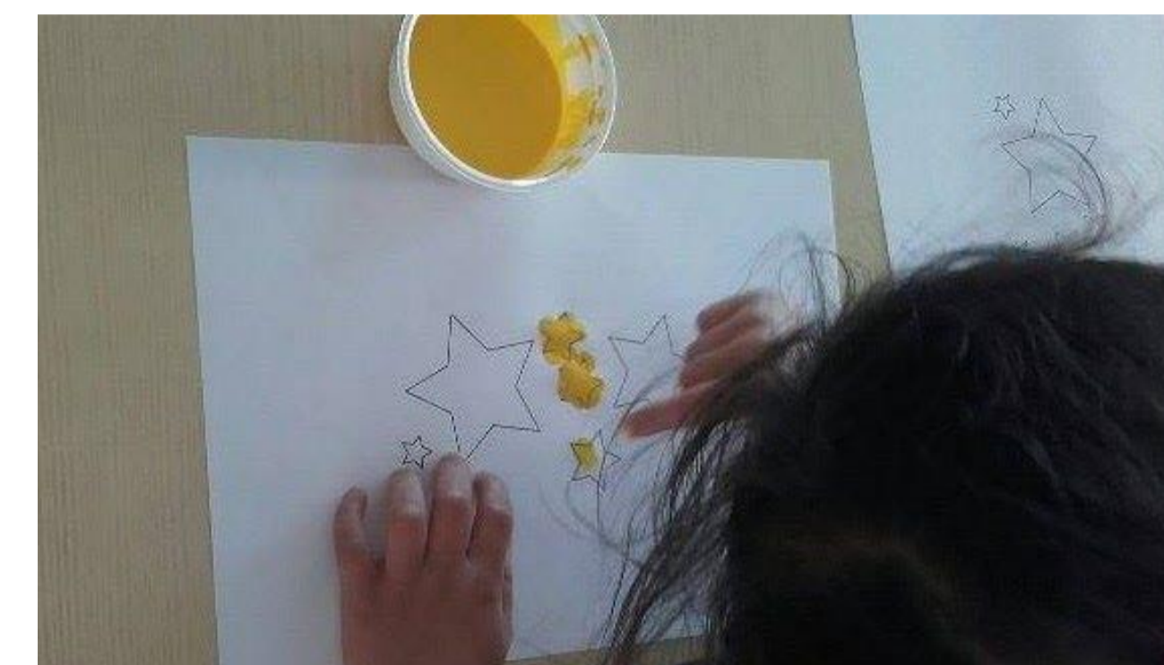
Figura 2 – Decoração das estrelas