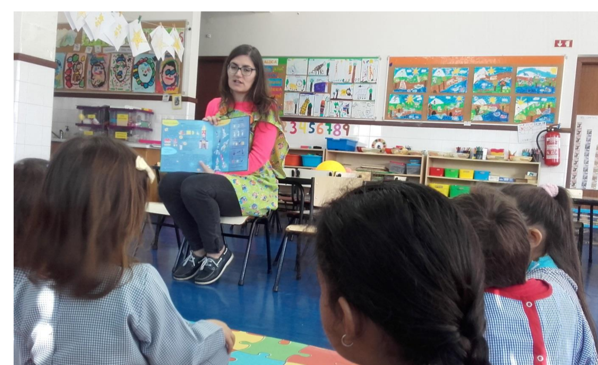
Figura 5 – Leitura do livro