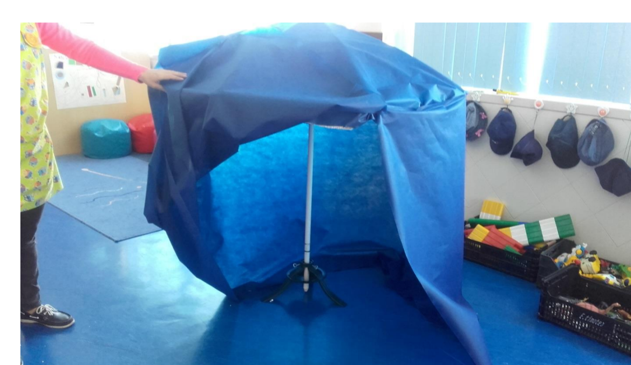
Figura 6 – Construção do Planetário