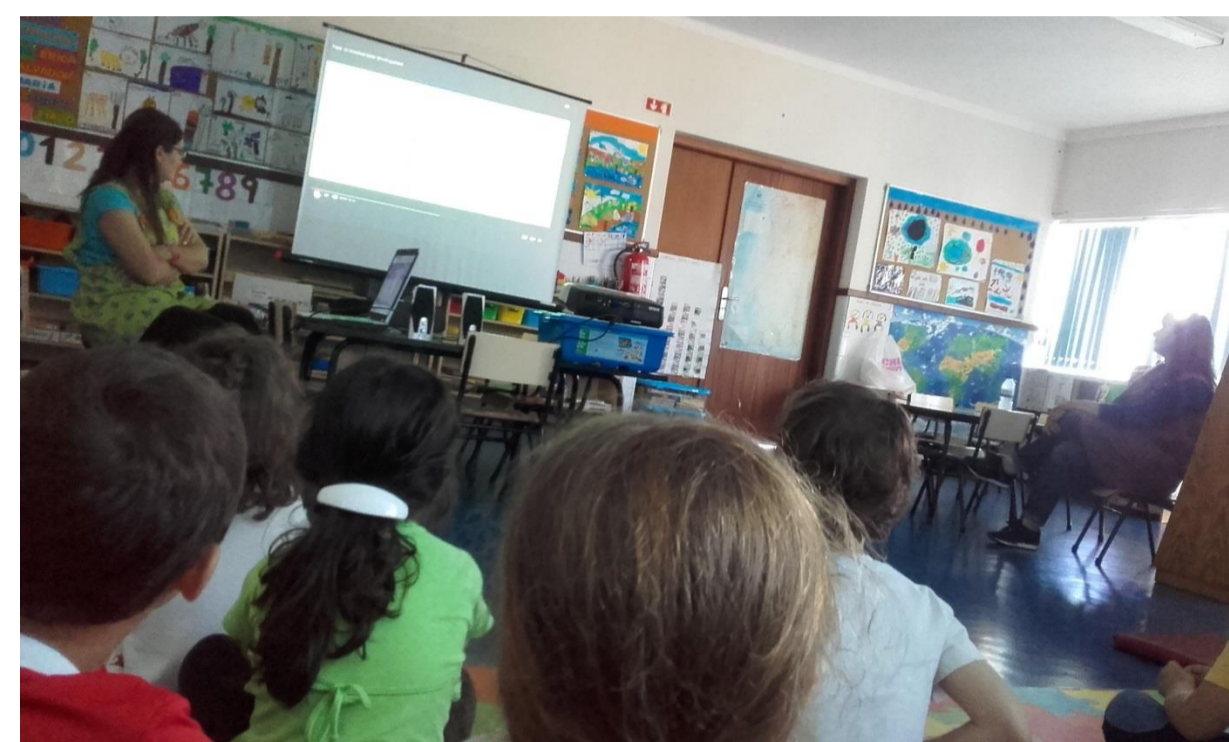
Figura 1 – Visionamento do Paxi