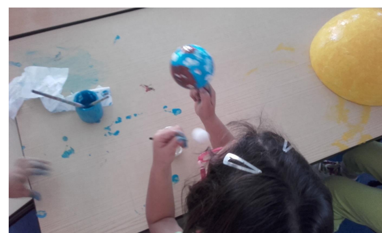
Figuras 3 e 4 – Pintura dos planetas do Sistema Solar, Sol e Lua