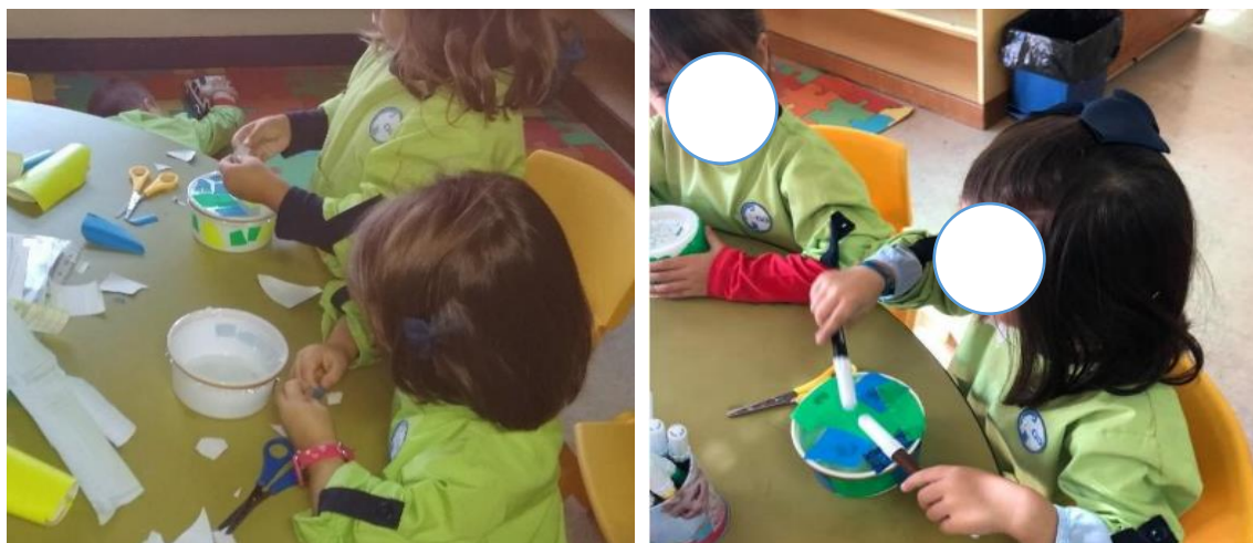
Figura 20/21- Construção dos Tambores

Desta forma, demos uma nova vida a diversos materiais existentes na sala. Cada criança teve oportunidade de realizar o seu tambor. A construção dos mesmo foi um pouco complexa no que diz respeito ao recorte de certos materiais, contudo, este tipo de atividades estimula a motricidade fina.