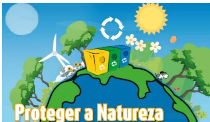
Figura 12/13-Visualização de vídeos

Após a visualização dos vídeos, realizámos um cartaz “O que devo fazer para ajudar o planeta...” Esta atividade teve como objetivo que as crianças manifestassem comportamentos de preocupação com a conservação da natureza e respeito pelo ambiente. Ao longo desta atividade foram realizados diálogos com as crianças onde cada uma teve a oportunidade de transmitir o que acontecia no seu dia-a-dia (se apagam as luzes quando saem de um determinado local da casa, se fecham a porta torneira enquanto escovam os dentes, entre outros).