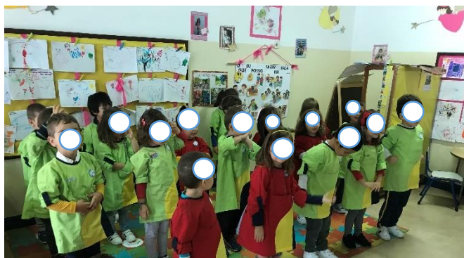
Figura 17 -Apresentação da Coreografia

Esta sequência de atividades teve como objetivos: a) a compreensão e identificação de semelhanças e diferenças entre diversos materiais (plástico, vidro, papel); b) A manifestação de comportamentos de preocupação e preservação da natureza e respeito pelo ambiente; c) Resolução de problemas do quotidiano que envolva pequenas quantidade com recurso a adição.