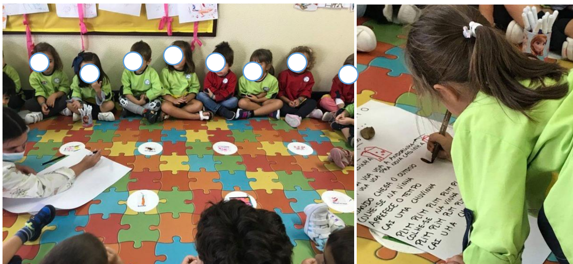
Figura 8/9- Abordagem a canção " Quando chega o Outono"

Quando terminado este exercício com a canção “Quando chega o Outono”, voltamos a repetir, mas desta vez para uma nova canção “Lá vai uma, lá vão duas” (Anexo 7). Para esta canção recorreu-se a gestos corporais.