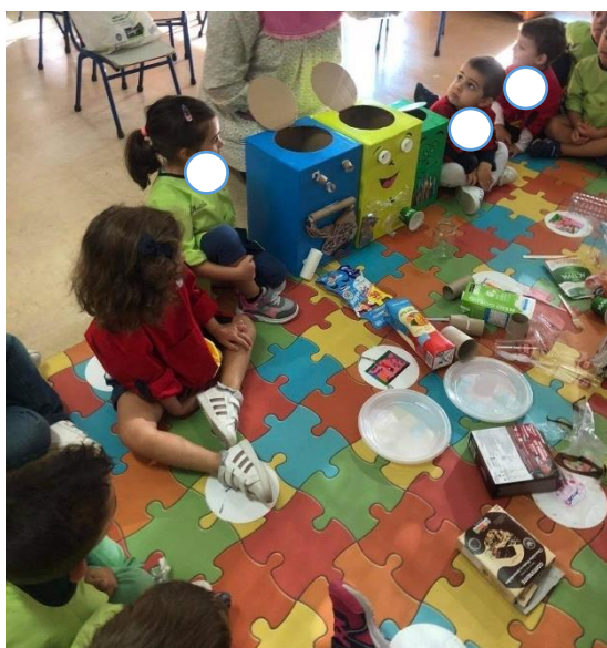
Figura 10- Reciclagem

Na minha opinião esta abordagem foi um ponto de partida para a sequência de atividades que irá suceder. Através da mesma é possível trabalhar conteúdos correspondentes a diversas áreas curriculares.