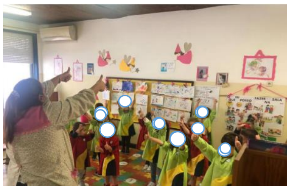
Figura 16 - Ensaio da Coreografia

Ao longo da criação da coreografia todas as crianças contribuíram com um passo/gesto. Esta atividade foi apresentada aos profissionais da sala, devido à impossibilidade de se apresentar à comunidade escolar devido à Covid-19. Este momento foi gravado pela educadora estagiária de modo a partilhar o trabalho realizado com os pais/ Encarregados de Educação.