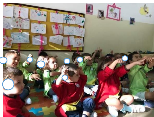
Figura 7- Canção " O quanto eu gosto de ti"