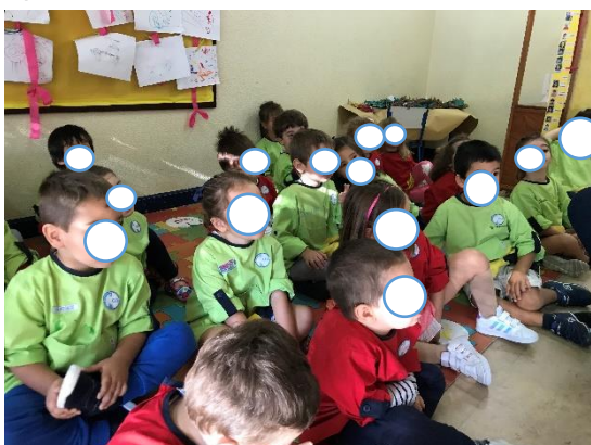
Figura 6- Abordagem da História " O sapo faz um amigo"

A nível pessoal, houve momentos em que senti alguma dificuldade principalmente na leitura da história pois estava bastante nervosa, e muitas vezes gostava de fazer mais perguntas ao grupo sobre a história, mas com o nervosismo muitas perguntas não surgiam. No que toca a abordagem da canção “ O quanto eu gosto de ti ”, apesar do nervosismo consegui abordar a canção recorrendo a gestos com o corpo o que foi uma técnica que me trouxe mais tranquilidade.