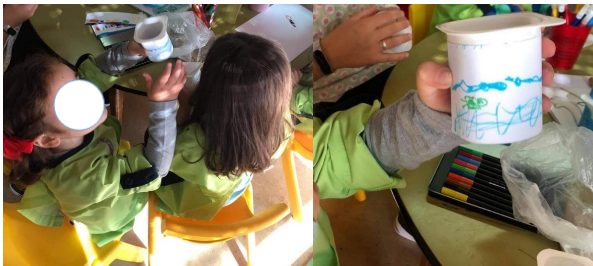
Figura 18/19- Construção das Maracas

Desta forma, começamos por construir as maracas com recurso a copos de iogurte, cada criança começou por fazer dois desenhos alusivos à temática da preservação do meio ambiente. No fim dos desenhos realizados, cada criança colou os seus à volta dos recipientes de iogurte. Por fim, cada criança colocou alguns elementos dentro dos recipientes tais como, (pedras, paus, bolotas, areia, etc)