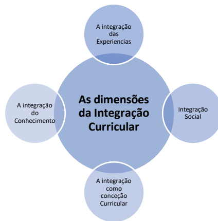
Figura 2- As Dimensões da Integração Curricular segundo Beane 2002

Para Beane (2002) a integração das experiências, considera o conhecimento que possuímos de nós próprios e do mundo que nos rodeia: as percepções, convicções, valores, etc., sendo um meio facilitador de resolução de problemas, para situações futuras. Estas aprendizagens englobam a integração de duas maneiras: o modo como ocorre a integração de novas experiências nos nossos esquemas de significação e, em segundo lugar, como integramos as experiências passadas, de maneira que estas nos ajudem em situações problemáticas futuras (Beane, 2002 p.16). A integração social contempla a importância de, numa sociedade democrática, proporcionar experiências educacionais comuns ou partilhadas aos jovens tendo em conta as suas características e vivências (Beane, 2002, p.17). Quanto à integração do conhecimento, este diz respeito ao uso do conhecimento, com o objetivo de dar resposta aos problemas e questões da vida, ligadas ao dia a dia (Beane 2002, p.18). No que diz respeito à última dimensão anunciada, a Integração como uma concepção curricular, refere-se à integração do currículo, estando ligada à questão da participação dos alunos nas planificações das suas próprias experiências (Beane, 2002, p.20).