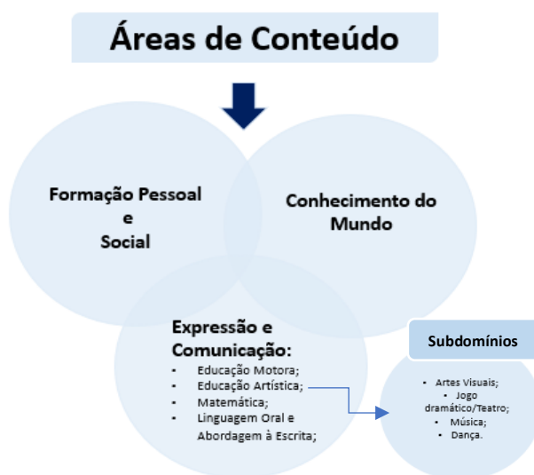
Figura 1- Áreas de Conteúdo da Educação Pré-Escolar de acordo com as OCEPE, 2016.

Este documento encontra-se dividido em três grandes áreas de conteúdo, a primeira dedicada a área da formação pessoal e social, a segunda a área de expressão e comunicação e a terceira a área do conhecimento do mundo. Relativamente a área de expressão e comunicação, esta encontra-se dividida em domínios e subdomínios como representados na figura seguinte: (Figura 1)