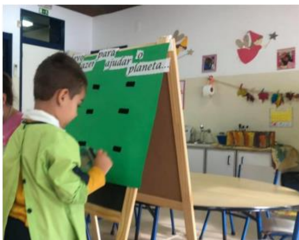
Figura 14-Elaboração do Cartaz

Após a visualização dos vídeos, realizámos um cartaz “O que devo fazer para ajudar o planeta...” Esta atividade teve como objetivo que as crianças manifestassem comportamentos de preocupação com a conservação da natureza e respeito pelo ambiente. Ao longo desta atividade foram realizados diálogos com as crianças onde cada uma teve a oportunidade de transmitir o que acontecia no seu dia-a-dia (se apagam as luzes quando saem de um determinado local da casa, se fecham a porta torneira enquanto escovam os dentes, entre outros).