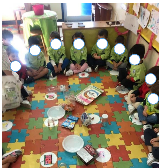
Figura 11- Divisão dos resíduos