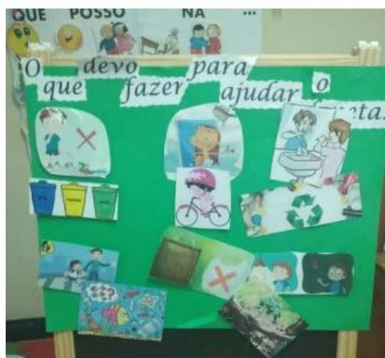
Figura 15 -Cartaz finalizado

Dos vídeos anteriormente visualizados e após dialogar com as crianças qual das músicas queriam aprender e criar uma coreografia a seleção foi para as canções “Proteger a Natureza”