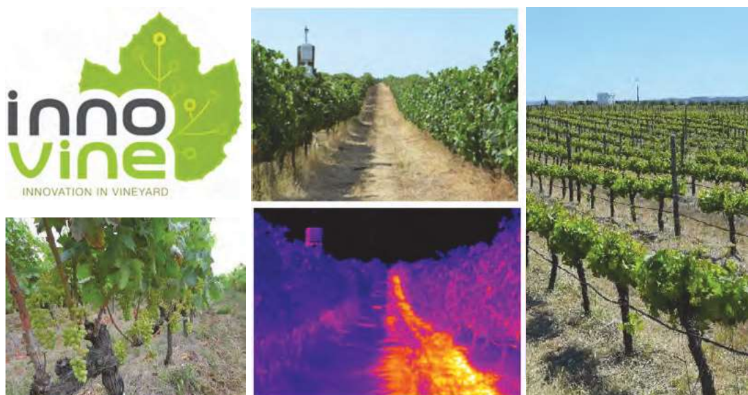
Figura 3. O projecto INNOVINE contribuiu para otimizar a gestão da vinha (ex. monitorização/previsão de doenças ou stress hídrico, modelos de previsão, sistemas de apoio à decisão) e fomentou a interação entre a academia e a indústria do vinho.

A utilização de águas residuais tratadas (ART) tem surgido como uma alternativa viável para fazer face à escassez de água na agricultura nos países Mediterrâneos. A utilização de ART não promove apenas a recuperação do recurso água, mas também de nutrientes, podendo ser visto como uma via conducente a uma economia circular. O projeto MeProWaRe tem por objetivo desenvolver uma abordagem metodológica para a reutilização de ART em culturas típicas de países mediterrânicos como por exemplo a vinha. O trabalho experimental está a decorrer em Itália, Espanha e Portugal, com atividades que incluem a monitorização e modelação da qualidade da água residual tratada; da reserva de água, condutividade eléctrica e nutrientes no perfil do solo e monitorização da ecofisiologia da cultura e avaliação da viabilidade económica. Deste modo, pretende-se determinar a melhor combinação de fatores associados à reutilização da ART não