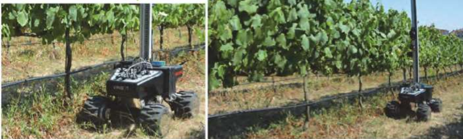
Figura 4. Protótipo de robot desenvolvido no projecto VinBot durante processo de monitorização das vinhas da Tapada da Ajuda (ISA, U. Lisboa).