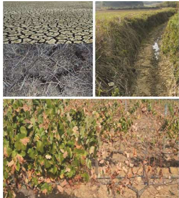
Figura 1. Efeitos de seca extrema em Portugal (Alentejo e Ribatejo e Oeste)

A videira é uma espécie adaptada ao clima mediterrâneo devido às suas raízes profundas e extensas e ao eficiente controlo estomático da transpiração que permite limitar as perdas de água e os riscos de embolia xilémica (Chaves et al., 2010). Todavia, é conhecido que secura severa e elevadas temperaturas