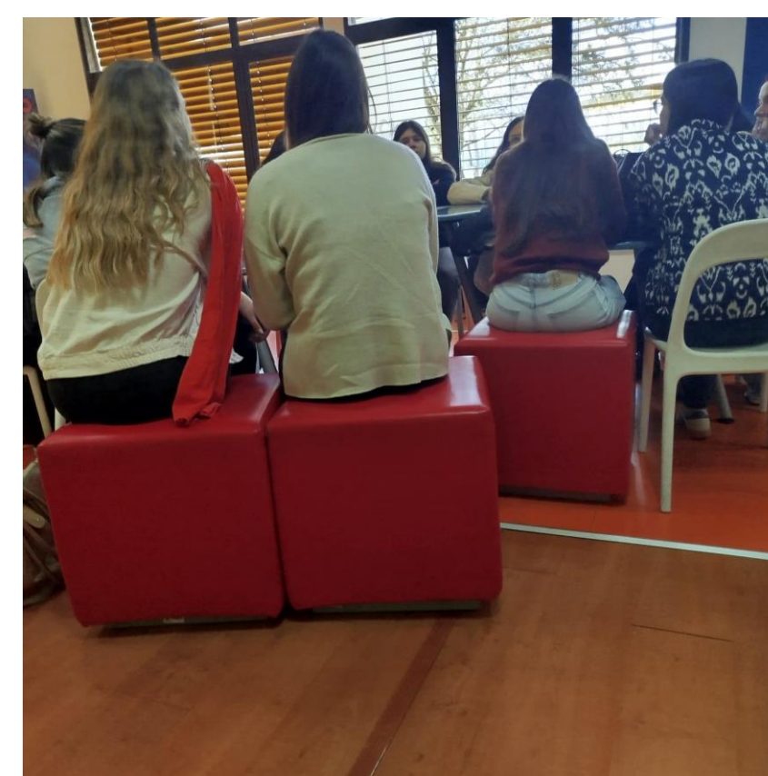
Fig. 2 Recolha de dados

Globalmente o Projeto "They Day Life Span Nowadays project" 2022-2030- centra-se em estudos quantitativos e qualitativos dos problemas associados à proteção e promoção de um ciclo de vida, especialmente para os mais vulneráveis à doença, de acordo com o modelo psicológico e conceito ético (Skevington et al., 2004; WHOQOL, 1998; Esther Vilalta, et al., 2023; Neves & Ricou, 2024) incluindo o direito à educação, apoio social, com vista à educação de qualidade, redução de desigualdades; cidades e comunidades sustentáveis; e parcerias para a implementação das metas defendidas pela ONU. De acordo com Galinha (2024) é premente conhecer e preservar, o bem-estar desde os primeiros vínculos maternos passando pelas várias transições ao longo do ciclo de vida. Estas mudanças afetam particularmente grupos populacionais mais vulneráveis.