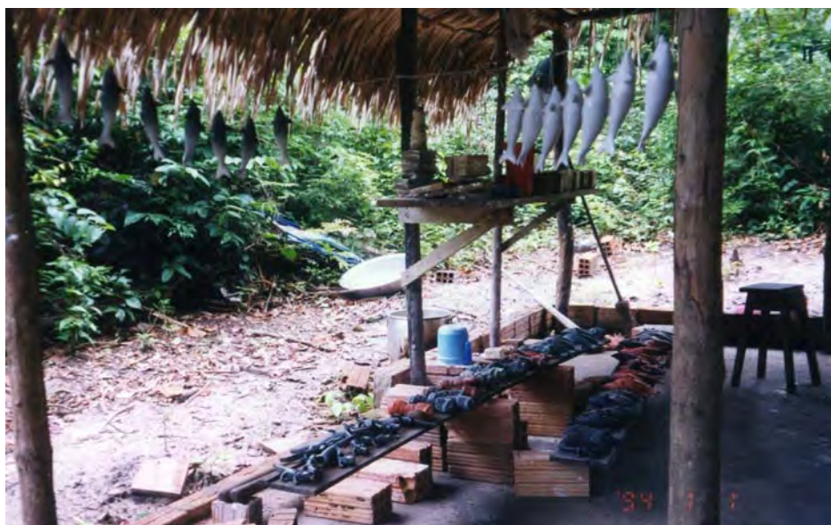
Foto 1: Produtos artesanais da comunidade de Maguary. Silva, Marilena. 2005.

“É tudo aquilo que se faz para adquirir sobrevivência na comunidade, como agricultura e artesanato.” (Comunitária B, 2005)