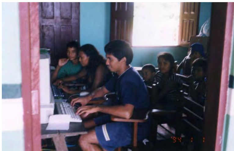
Foto 3: Laboratório de Informática da comunidade de Maguary - Flona Tapajós. GAMA, Margareth, 2004.

Verifica-se uma tentativa muito interessante da parte dos professores de construírem alternativas metodológicas para que os alunos se percebam como sujeitos do processo educativo, capazes da construção de sua palavra, de seu texto, com base na análise de sua realidade. Percebe-se a valorização dos alunos enquanto sujeitos capazes de expressão de um pensamento que deve ser trabalhado pela escola, de modo prazeroso, retirando do processo de construção de conhecimento a sua face de processos de burocratização do saber. Constrói-se aqui uma possibilidade nova para a educação formal adequar-se as necessidades e demandas da realidade sócio-ambiental.