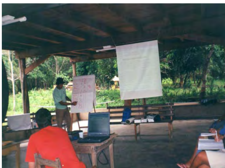
Foto 2: Moradores da FLONA Tapajós participando de curso de Manejo Florestal Comunitário promovido pelo ProManejo/IBAMA. Silva, Marilena. 2005.

“[...] É um projeto que sustenta as pessoas trazendo benefícios para a comunidade. [...] Fazer trabalhos comunitários.” (Presidente de comunidade, 2005).