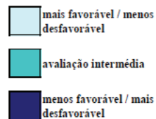
Figura 3. Resultados da avaliação ambiental desenvolvida para a totalidade dos fatores críticos de decisão; COBA (2007a,b,c)