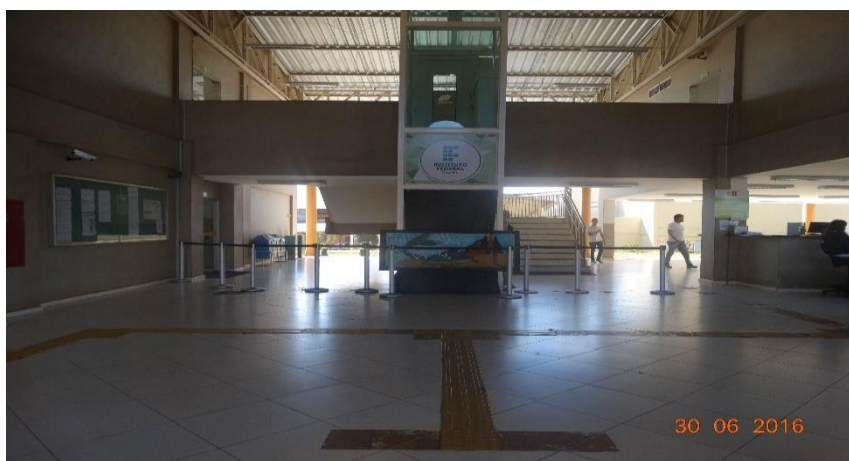
Fotografia 1 – Entrada principal do Campus – Piso tátil

Para ilustrar o contexto da infraestrutura do Campus , incluíram-se fotografias, para demonstrar a acessibilidade física no local, uma vez que esta foi declarada por alguns dos entrevistados como não acessível. Na realidade, esta ainda não é a estrutura ideal, consoante determina a Associação Brasileira de Normas Técnicas (ABNT) e a Norma Brasileira (NBR) de 2004, mas percebe-se a preocupação de gestores do Campus , para atender a esses requisitos - proporcionar estrutura acessível a todos.