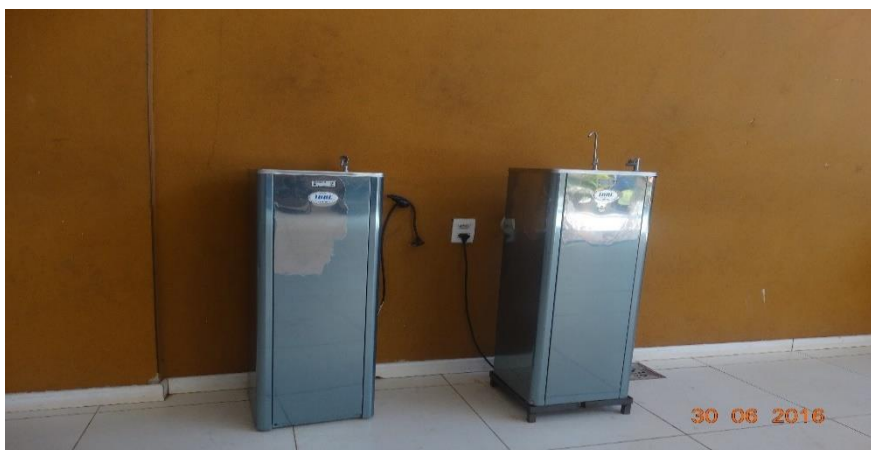
Fotografia 3 – Bebedouro, instalado na entrada principal

Este elevador foi instalado há pouco tempo; antes o acesso da comunidade acadêmica à biblioteca e ao bloco administrativo ocorria exclusivamente pela escada, o que impossibilitava ou dificultava as pessoas com deficiência e mobilidade reduzida desse espaço, ou esse acesso era feito conforme se verifica melhor a seguir no contexto da análise de dados.