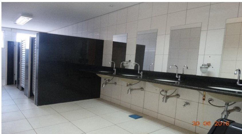
Fotografia 6 – Banheiro feminino do bloco de salas de aula

as áreas de circulação devem ter superfície regular, firme e antiderrapante; quando houver escadas, degraus ou rampas, manter obrigatoriamente a instalação de corrimãos nos dois lados, além de toldo cobrindo a entrada em que transitam pessoas em cadeira de rodas.