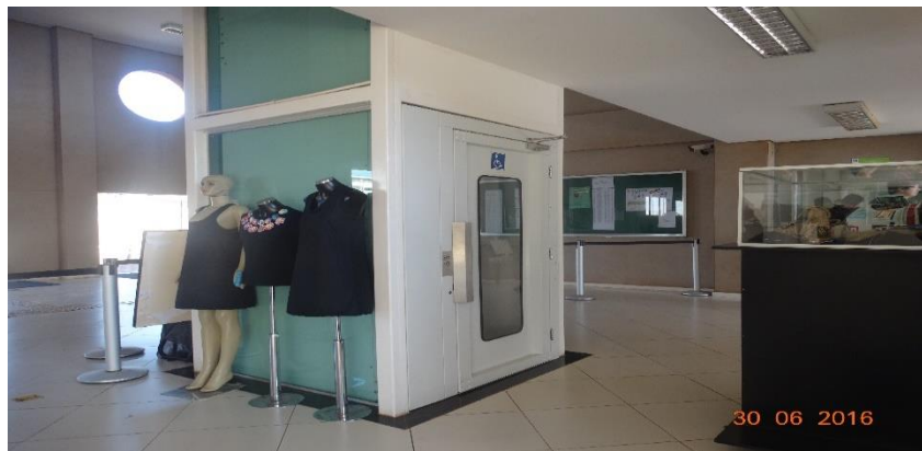
Fotografia 2 – Elevador de acesso à biblioteca e ao bloco administrativo Fonte: Pesquisadora, 2016.

superfície do piso existente e a superfície do piso implantado deve ser chanfrado e não exceder 2 mm; b) quando integradas, não deve haver desnível.