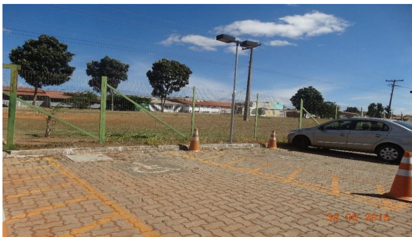
Fotografia 8 – Vagas de estacionamento para pessoas com deficiência

Ainda segundo a ABNT 9.050 (2015), as maçanetas devem ser do tipo alavanca, para abertura exclusivamente com um movimento, exigindo força não superior a 36 Newton (N). Devem ser, ainda, instaladas entre 0,90 m e 1,10 m de altura em relação ao piso. Consta-se que a maçaneta não segue as orientações para acessibilidade; todas as maçanetas são do mesmo modelo da Fotografia 7.