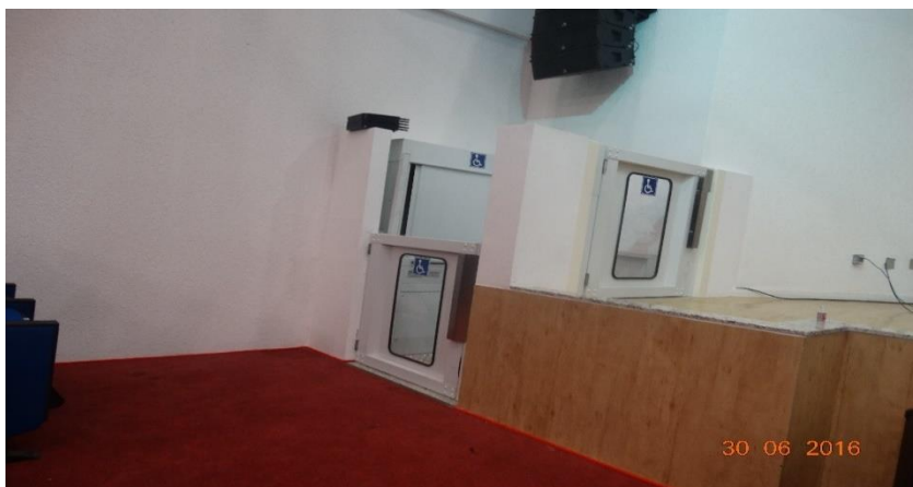
Fotografia 4 – Plataforma elevatória, Auditório