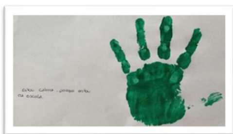
FIGURA 3 - ATIVIDADE "MONSTRO DAS CORES"

Sem ser o objetivo principal também era importante que com o trabalho todo realizado, em cinco semanas de estágio, todas as crianças conseguissem aprender a lidar um pouco melhor com as suas emoções, mas também que compreendessem que podem sentir emoções diferentes em diversos momentos do seu dia e que isso é normal.