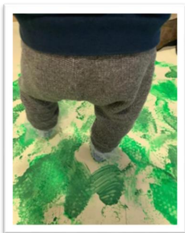
FIGURA 1 - ATIVIDADE "PINHEIRO MÁGICO"

Em relação ao projeto, é bastante importante definir a diferença entre sensações e perceções, pois foi falado muitas vezes de sensações, as sensações que proporcionamos às crianças, mas ainda não falámos de perceções que também são muito importantes. É através das sensações que a criança começa a formar as suas perceções em relação ao que a rodeia, Reis (2004, p.64) afirma “a distinção que pode ser estabelecida entre sensação e perceção é que, a primeira pressupõe receção de estímulos e a segunda, sua interpretação.” As perceções são o resultado, por assim dizer, das sensações que as crianças têm acesso. Por definição, a sensação é basicamente uma resposta de um recetor sensorial a estímulos externos, ou seja, é uma resposta fisiológica do organismo. É um processo em que os sentidos humanos convertem a energia de um estímulo em mensagens neurais que provoca reações. Segundo Miranda (2018, p.25) “A perceção, por outro lado, é o julgamento dado pela criança com base nas informações das sensações”. É a interpretação por parte de cada criança do que foi captado pelos sentidos.