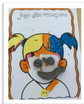
FIGURA 4 - ATIVIDADE DO "JOGO DAS CARAS"