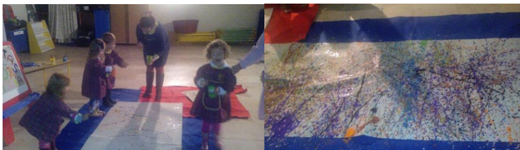
Figura 2- Atividade Pintar Como Pollock