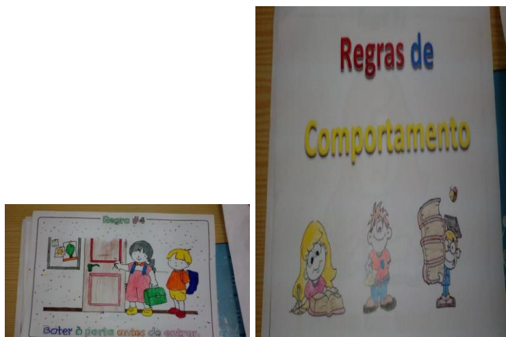
Figura 4- Atividade da área Curricular de Educação para a Cidadania

Esta atividade mostrou-se bem-sucedida, pois a maioria dos alunos já conseguia identificar quais as regras de sala, bem como as de educação, pois nos dias seguintes já colocavam em prática algumas, nomeadamente, bater à porta antes de entrar e dizer sempre bom dia e boa tarde