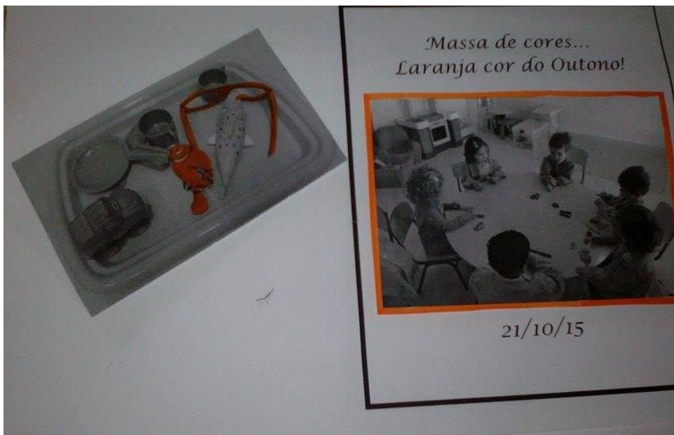
Figura 8- Massa de cores- Cor de Laranja

Desta forma elaborámos a atividade “Massa de cores- Cor de Laranja” para que o grupo para que o grupo conseguisse trabalhar a motricidade fina e tivesse ao mesmo tempo contacto com a cor. Iniciámos a atividade mostrando a massa e perguntando ao grupo se conheciam a cor, como era esperado alguns conseguiram responder corretamente, mas alguns elementos do grupo só repetiram a cor que os colegas referiram. Posteriormente recolhemos alguns objetos da sala que representavam a cor em questão e fizemos a associação à massa de cores.