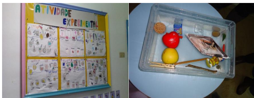
Figura 1- Atividade Flutua e Não Flutua

Com esta atividade conseguimos perceber que as crianças conseguiram entender que alguns objetos flutuam e outros não, pois nos dias seguintes muitas das crianças traziam objetos para colocar dentro da caixa, que ficou na sala por mais uns dias, de forma a ver se o objeto flutuava ou não.