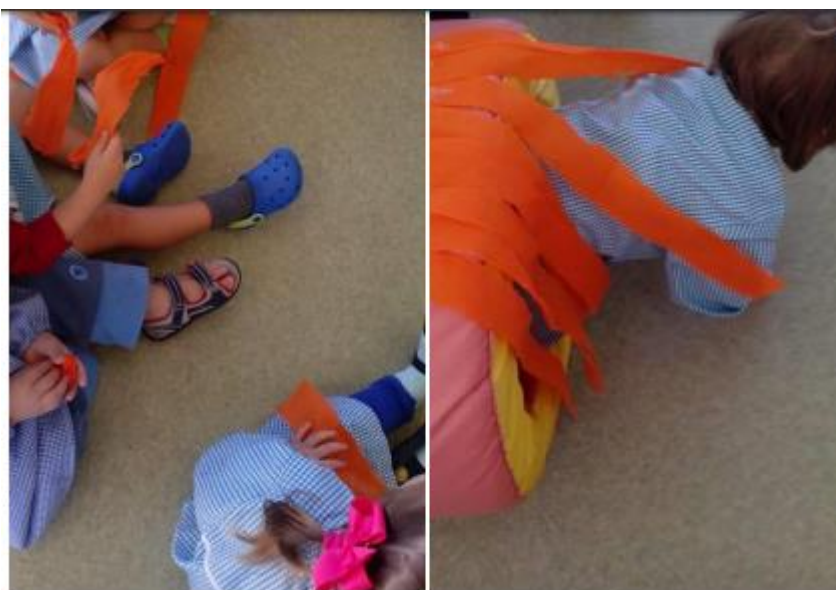
Figura 7- Movimento Criativo

Esta atividade não foi muito bem-sucedida, pois como as crianças estavam num espaço diferente do habitual queriam explorar o espaço, dispersando muitas vezes dos objetivos pretendidos.