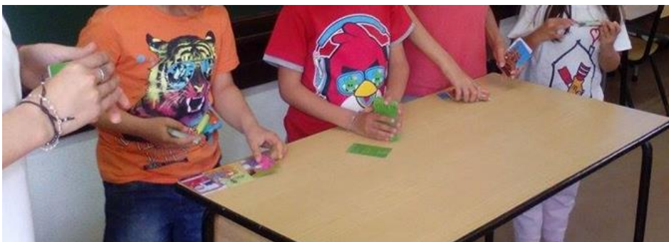
Figura 3- Atividade da área Curricular de Matemática