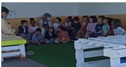
Figura 3 – História casa da mosca fosca

ser executada na sala, foi realizada no exterior da escola e as crianças manifestaram bastante entusiasmo, uma vez que, era a primeira vez que uma história era lida na rua.