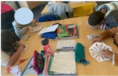
Figura 4 - Construção dos flocos de neve

Com a “Elaboração dos flocos de neve” pretendíamos estimular e trabalhar algumas áreas artísticas como a dobragem e o recorte. Para a realização desta atividade, iniciei a aula, com uma breve discussão sobre a estação do ano em que nos encontrávamos, conduzindo a conversa até que as crianças chegassem ao tema da neve.