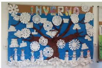
Figura 6 – Painel concluído

momento foram inumeradas as atividades que elas, individualmente ou em pequeno grupo, poderiam realizar. Após as crianças efetuarem as suas escolhas, as que optaram por iniciar a decoração do painel, começaram, com a supervisão de um adulto, por colar, os materiais que já estavam preparados ou que iam sendo terminados pelos colegas, tais como, as árvores genealógicas, os flocos de neve, as letras da palavra “inverno” e os bonecos de neve. À medida que as crianças iam acabando as outras atividades foram recortando aos bocadinhos o papel crêpon castanho para colar no tronco e nos ramos da árvore.