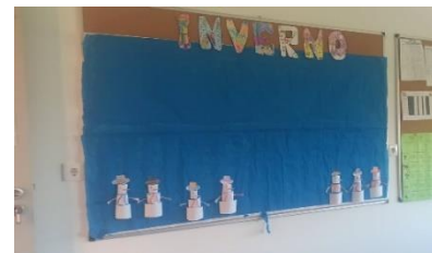
Figura 5 – Painel em construção

A segunda atividade que gostaria de referir é da “Montagem do painel de inverno”, durante a qual, foram construídos os restantes elementos de decoração, bem como, efetuadas as colagens no placard. Esta atividade, foi dividida em dois momentos. Num primeiro momento foi explicado às crianças o que iríamos fazer. Já num segundo