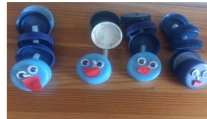
Figura 2 – Lagartas concluídas

No terceiro dia as crianças compararam as suas lagartas e o grupo percebeu que existiam lagartas de diversos tamanhos, conseguindo identificar, com relativa facilidade, as que eram “maiores que” e “menores que” e utilizar, adequadamente os referidos termos.