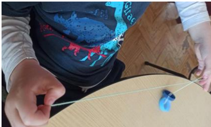
Figura 1 – Construção das lagartas

O grupo demonstrou grande interesse e motivação durante a realização desta atividade, sendo que, mesmo após a sua conclusão, algumas das crianças mostravam vontade de fazer mais e, aquelas que, devido a apresentarem mais dificuldades, ainda não tinham conseguido terminar, questionavam, constantemente, quando seria a sua vez de obterem a explicação individual, para concluírem a respetiva lagarta.