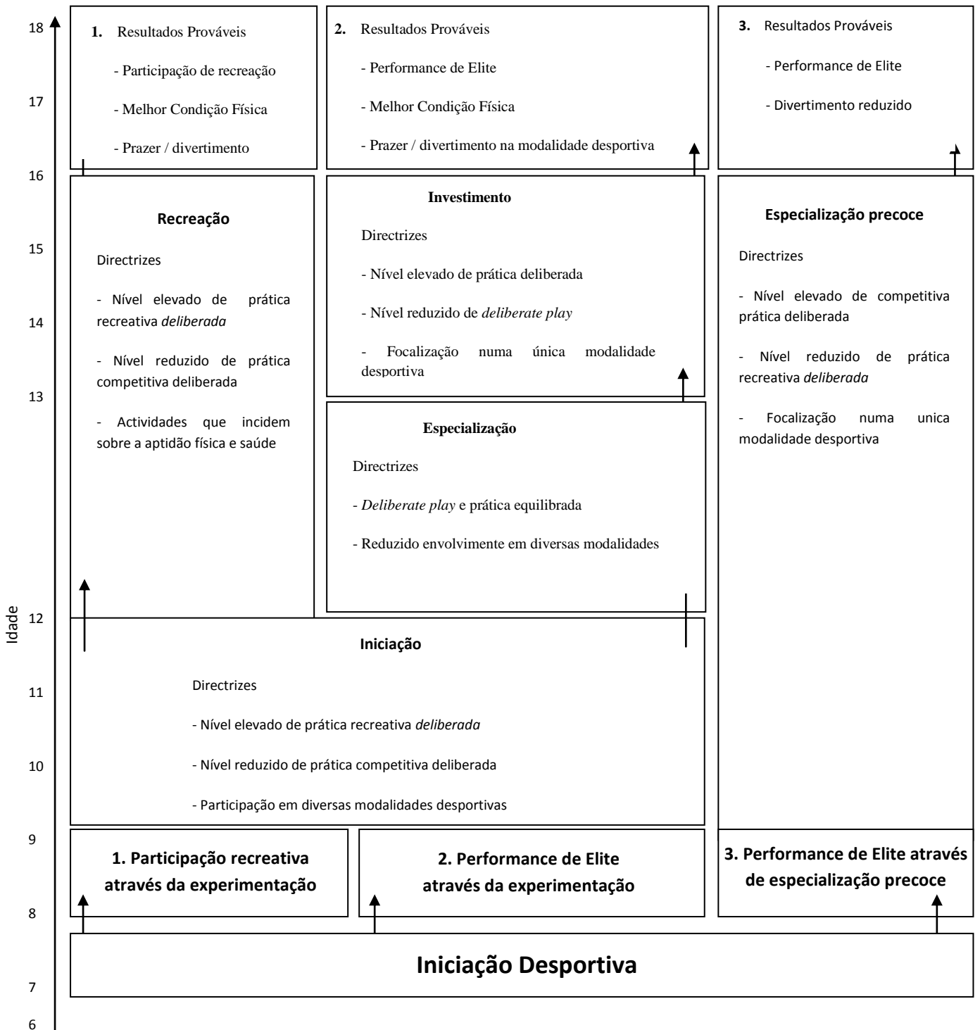
Figura 3: Modelo de desenvolvimento da participação desportiva (Traduzido e Adaptado de Côté et al , 2007, p. 197).