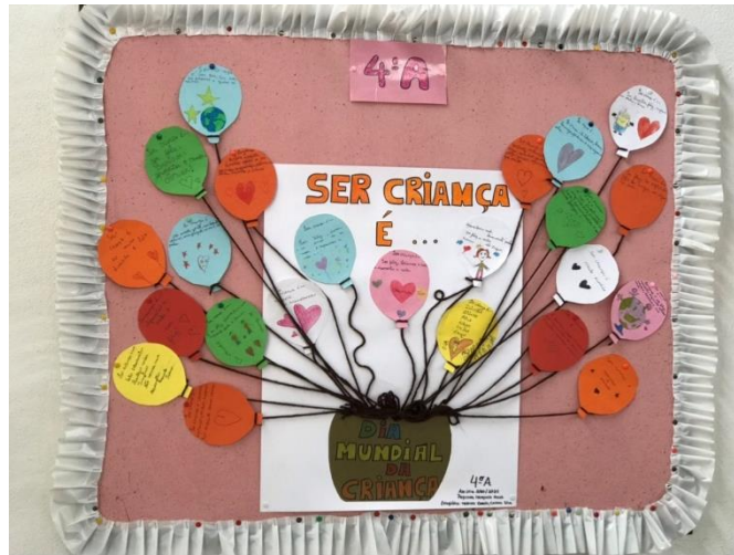
Figura 10 Dia da Criança

Na segunda atividade, de forma a dar vida ao texto dramático que estava a ser abordado naquela semana, foram formados grupos de 3 elementos. O texto dramático foi dividido em 3 partes e, aleatoriamente, através de um sorteio, cada grupo tirou um papel e teria de, através de mímica, dramatizar o episódio que lhe calhou. Cada elemento ficaria com uma personagem. Esta atividade foi pensada de forma a incluir uma aluna que tinha mutismo seletivo e, desta, forma, enquadrá-la numa atividade de expressão dramática que, normalmente, usavam a voz. O feedback por parte da professora e dos alunos foi bastante positiva.