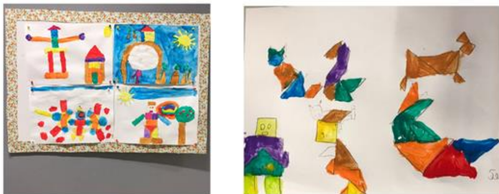
Figura 7 Criações dos alunos

A segunda atividade, foi a única realizada no espaço exterior. Foi uma atividade pensada de forma a complementar a letra que tinham aprendido durante aquela semana, a letra X. Fomos para o espaço exterior. Normalmente havia alguns alunos que sofriam episódios de menos agradáveis, sendo postos de parte, nunca eram escolhidos durante a realização das equipas e, para evitar que ficassem para último, elegi duas dessas crianças para serem capitãs. Cada uma escolheu o mesmo número de elementos e, posteriormente, expliquei a atividade. Tinha um saco onde cada equipa, à vez, teria de tirar um pequeno papel aleatoriamente. Nesses papéis estavam escritas palavras começadas por X, tendo os alunos de ler e ajudar-se uns aos outros para fazerem, através de mímica, o que estava escrito, de forma a que a equipa adversária adivinhasse. Esta atividade fez com que houvesse uma entreaajuda entre elementos da própria equipa e que aprendessem mais palavras começadas com a letra X. O feedback quer por parte das crianças, quer por parte da professora cooperante foi bastante positivo.