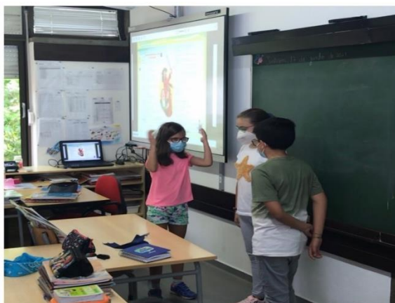
Figura 11 Dramatização de texto dramático através de mímica

Na segunda atividade, de forma a dar vida ao texto dramático que estava a ser abordado naquela semana, foram formados grupos de 3 elementos. O texto dramático foi dividido em 3 partes e, aleatoriamente, através de um sorteio, cada grupo tirou um papel e teria de, através de mímica, dramatizar o episódio que lhe calhou. Cada elemento ficaria com uma personagem. Esta atividade foi pensada de forma a incluir uma aluna que tinha mutismo seletivo e, desta, forma, enquadrá-la numa atividade de expressão dramática que, normalmente, usavam a voz. O feedback por parte da professora e dos alunos foi bastante positiva.