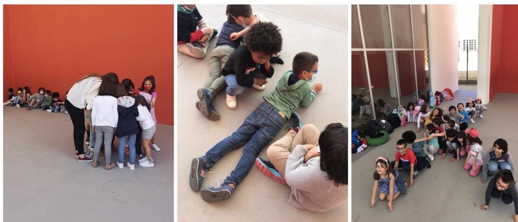
Figura 8 Atividade de mímica da letra X

A segunda atividade, foi a única realizada no espaço exterior. Foi uma atividade pensada de forma a complementar a letra que tinham aprendido durante aquela semana, a letra X. Fomos para o espaço exterior. Normalmente havia alguns alunos que sofriam episódios de menos agradáveis, sendo postos de parte, nunca eram escolhidos durante a realização das equipas e, para evitar que ficassem para último, elegi duas dessas crianças para serem capitãs. Cada uma escolheu o mesmo número de elementos e, posteriormente, expliquei a atividade. Tinha um saco onde cada equipa, à vez, teria de tirar um pequeno papel aleatoriamente. Nesses papéis estavam escritas palavras começadas por X, tendo os alunos de ler e ajudar-se uns aos outros para fazerem, através de mímica, o que estava escrito, de forma a que a equipa adversária adivinhasse. Esta atividade fez com que houvesse uma entreaajuda entre elementos da própria equipa e que aprendessem mais palavras começadas com a letra X. O feedback quer por parte das crianças, quer por parte da professora cooperante foi bastante positivo.