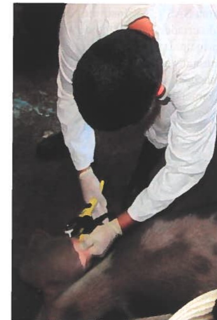
Figura 3 – Brincagem de uma fêmea, com recolha de ADN, após pontuação ao livro de adultos do LGMA

Desde a implementação do LGMA iniciou-se a pontuação para o livro de adultos de todos os candidatos a reprodutores, segundo uma grelha de classificação morfológica (Tabela 1) constante do regulamento do LGMA, aprovado pela DGAV. Os animais são avaliados fenotipicamente, identificados com um brinco numerado do LGMA, procedendo-se simultaneamente à colheita de material biológico (tecido da pele e cartilagem da orelha) (Figura 3) para controlo de filiação por análise de ADN, realizado pelo Laboratório de Genética Molecular da Fonte Boa - INIAV. Desta forma, o LGMA possui informação molecular de todos os reprodutores existentes, credibilizando os pedigrees registados e permitindo uma caracterização genética da população, por intermédio de marcadores moleculares. Adicionalmente, no mesmo laboratório, alguns animais de diferentes produtores têm sido genotipados para características indesejáveis, como é o caso do gene do halotano, tal como consta do programa de conservação e melhoramento de recursos genéticos animais,