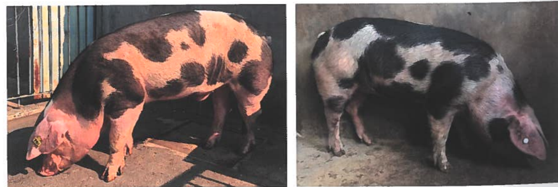
Figuras 1 e 2 – Varrasco e porca da raça Malhado de Alcobaça

Estes animais são criados tradicionalmente na região do Ribatejo e Oeste de Portugal, apresentando um efetivo adulto atual muito restrito, que ronda as 200 fêmeas reprodutoras e 12 varrascos, em somente 7 criadores ativos. Os animais desta população apresentam boa corpulência, com um esqueleto forte e um temperamento calmo e dócil (Cabral, 1959). São dotados de cerdas fortes, compridas e grossas de cor branca e preta, formando malhas bem definidas, mas de tamanho e forma irregulares disseminados por todo o corpo. A pigmentação do corpo tende a reduzir-se com a idade dos animais. Caracterizam-se por serem animais com cabeça de tamanho médio, grossa e perfil côncavo e orelhas compridas largas e pendentes chegando mesmo a cobrir os olhos. O esqueleto é bem desenvolvido, com linha dorso-lombar convexa, sendo animais longilíneos de garupa estreita, pouco comprida e membros altos (Reis, 2003) (Figuras 1 e 2). Estes animais apresen-