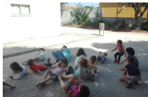
Figura 11 - Crianças a realizar a atividade.

Ao início, sentimos alguma dificuldade em planificar para todo o grupo, uma vez que tínhamos várias idades, em fases de desenvolvimento diferentes dentro da sala. Pois sabíamos que as crianças mais pequenas precisavam de uns estímulos e os mais velhos precisavam de outros.