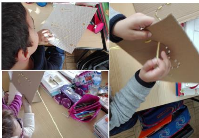
Figura 12 - Alunos a tecer a letra n em cartão.

Para a avaliação desta atividade, utilizámos os registos fotográficos e a grelha de observação.