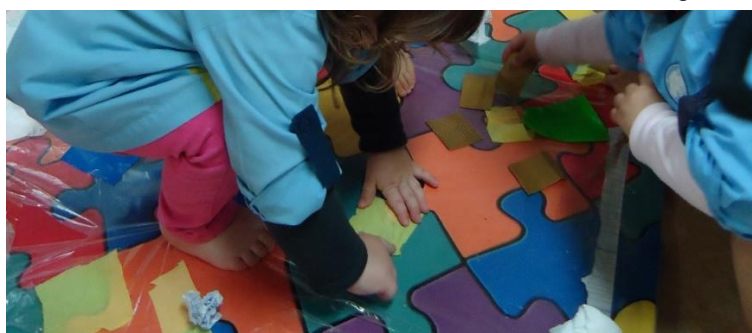
Figura 3 - Crianças a colar os bocadinhos de papel.