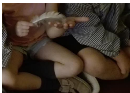
Figura 7 - Criança a sentir a textura da pena.

Esta atividade foi muito interessante pelas descobertas que as crianças fizeram e pelas afirmações que tiveram ao longo de todo o processo.