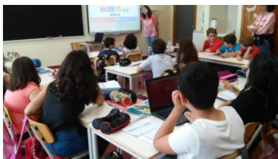
Figura 17 - Análise das respostas corretas e erradas.

Na primeira atividade explicámos à turma como funcionava a aplicação, neste caso direcionada para o Português, e colocámos uma primeira questão para exemplificar a sua utilização. O grupo desde logo percebeu e começou por realizar as diferentes questões. No entanto teve alguma dificuldade em funcionar com a plataforma. Uma vez que quando erravam voltavam a recarregar a página, para alterarem a resposta, o que fazia com que saíssem do jogo. Através da aplicação conseguimos perceber que existiam falhas ao nível da gramática e, por essa razão, à medida que um exercício terminava, víamos as respostas e revíamos aquele conteúdo, para que os elementos que erraram perceberem o porquê. Os objetivos deste exercício era eles perceberem a gramática que estava a ser trabalhada, mas, também, a interação entre pares porque estavam a trabalhar dois a dois. O primeiro objetivo foi cumprido, mas o mesmo não aconteceu com o segundo, uma vez que os pares tiveram dificuldade em dialogar e aceitar que o outro tinha ideias diferentes. Para avaliarmos esta atividade, utilizámos o registo de observação e a resolução de exercícios.