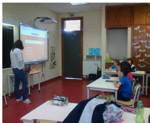
Figura 19 - Análise dos pontos.