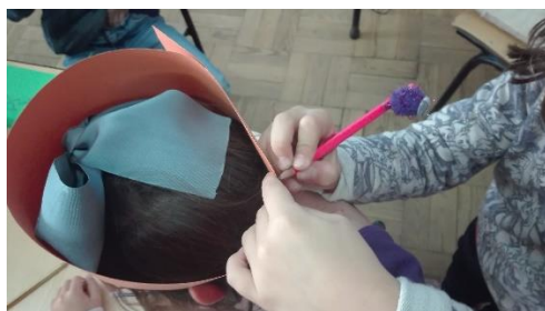
Figura 13 - Criança a delinear a cabeça do colega.

Para a avaliação desta atividade, utilizámos os registos fotográficos, a observação direta e o produto final.