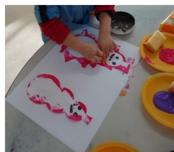
Figura 5 - Criança a colocar o cachecol no boneco de neve.