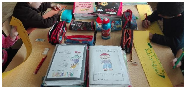
Figura 14 - Crianças a decorar a coroa.