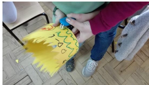
Figura 16 - Criança a agrafar a coroa.