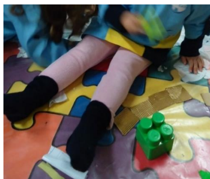
Figura 2 - Criança produzir som com o lego.