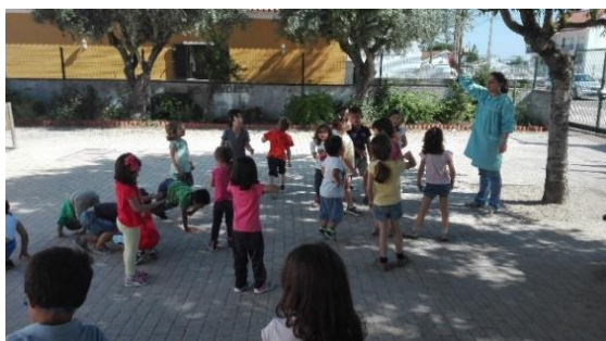
Figura 10 - Grupo a observar o cartão.

Esta atividade foi muito engraçada porque todo o grupo aderiu e era visível o bem-estar do mesmo. A avaliação da atividade foi muito positiva e foi notória a evolução que houve dos conhecimentos, tendo sido os objetivos iniciais da atividade cumpridos. Para avaliar esta atividade, recorreremos aos registos fotográficos, a uma grelha de observação e à observação direta.