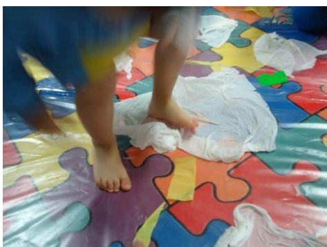
Figura 1 - Criança a explorar o papel autocolante com os pés.

Para a avaliação desta atividade recorreremos à observação direta, ao registo fotográfico e à grelha de observação.