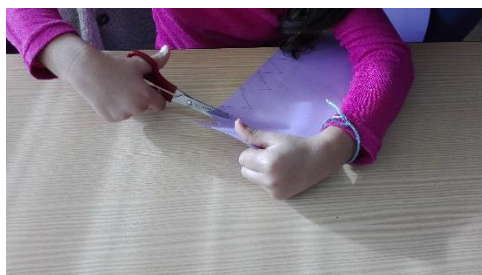
Figura 15 - Criança a cortar os bicos da coroa.