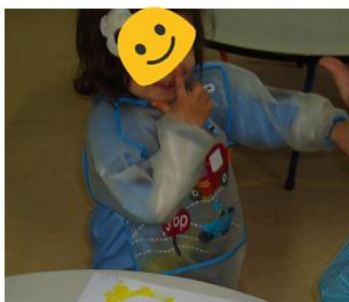
Figura 6 - Criança a identificar o que falta no boneco de neve.