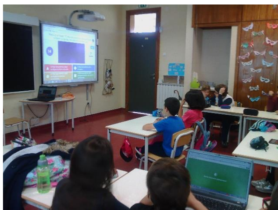
Figura 18 - Observação da questão.

Na segunda atividade, voltámos a aplicar recorrendo à gramática do Português e já notámos uma maior evolução. A gramática utilizada pertencia a um novo conteúdo, mas, mesmo assim, a turma conseguiu perceber e acertar na maioria das questões. O grupo já demonstrou mais à vontade com a plataforma e a maior parte dos grupos já conseguiu interagir entres eles e discutir sobre qual a resposta mais correta. Visto isto, os objetivos inseridos nesta atividade são os mesmos que os da atividade anterior, mas neste já podemos referir que já foram mais cumpridos que na atividade anterior. Para avaliar esta atividade, recorremos ao registo de observação e à resolução de exercícios.