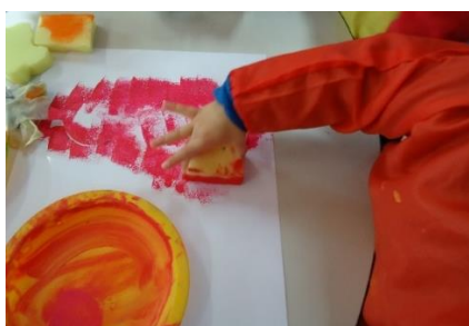
Figura 4 - Criança a delinear o boneco de neve.

Nesta atividade, considerámos que nem todos os objetivos foram atingidos, uma vez que algumas crianças não tiveram diálogo com as estagiárias. Para a avaliação da mesma utilizámos os registos fotográficos, a observação direta e o produto final.