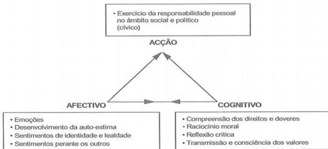
Figura 1 - Triângulo da Cidadania (adaptado de Rowe, 1993 in Reis, (2002). p110)