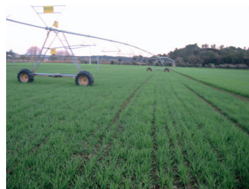
Figura 1 – Aspecto geral das parcelas do campo experimental de Tomar (Marmeleira).

No ano de 2008/2009 foram instalados dois campos de ensaio de variedades de trigo mole, na Quinta do Bonito (39° 36' N; 8° 59' W) freguesia de S. Vicente do Paul, concelho de Santarém, e numa parcela localizada no Marmeleiro, freguesia de Madalena, concelho de Tomar (39° 33' N; 8° 26' W) respectivamente.