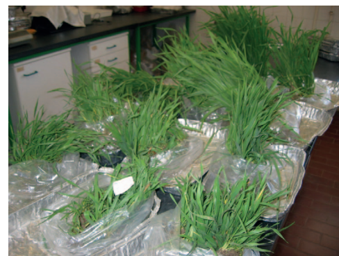
Figura 3 – Observação do número de plantas, caules e quantificação de biomassa em plantas recolhidas nos campos de ensaio.

Ao longo do ciclo cultural efectuaram-se as seguintes observações: registo das datas das principais fases de desenvolvimento; quantificação, por unidade de área, do número médio de plantas emergidas e do número de caules na fase final de afillamento; avaliação da biomassa na fase do início do desenvolvimento, afillamento, encanamento, espigamento, e no final da colheita; determinação do número médio de espigas por unidade de área (Figura 3). No final do ciclo avaliou-se o rendimento final em grão e alguns parâmetros de qualidade. Cada uma das parcelas experimentais foi colhida individualmente, com o auxílio de uma ceifeira-debulhadora, e o seu grão foi pesado, utilizando um tegão equipado com balança.