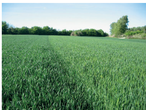
Figura 2 – Aspecto geral do campo experimental de Santarém (Quinta do Bonito).

riedades Bancal, Botticelli, Ester e Hyxo (variedade híbrida).