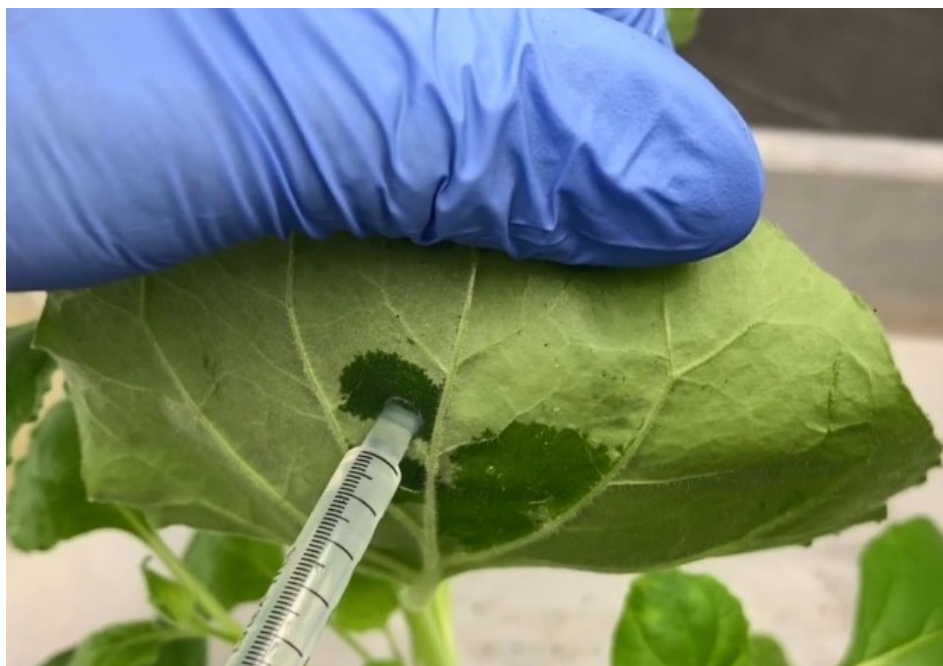
Figura 1. Agroinfiltração do gene GFP na face abaxial da folha de N. benthamiana 16c.