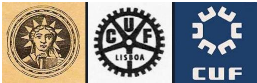
Logotipos da CUF