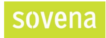
Logotipos da Nutrinveste e da Sovena