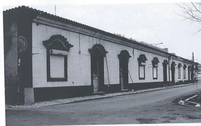
Bairro Operário da CUF no Barreiro