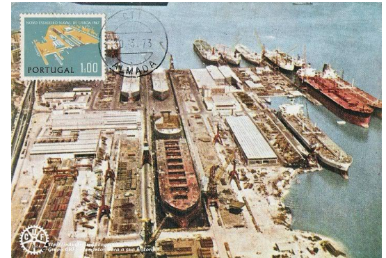
Lisnave – Fundação dos Estaleiros Navais da Margueira (Almada), 1967