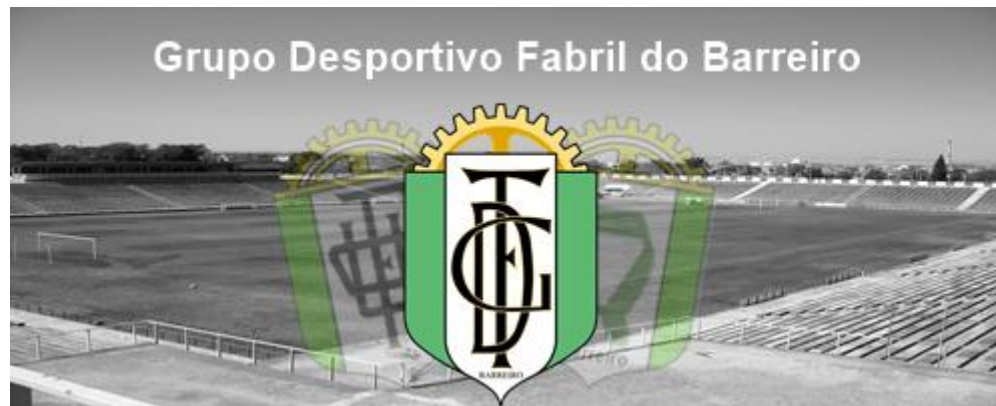
Emblema do Grupo Desportivo Fabril do Barreiro e Estádio Alfredo da Silva