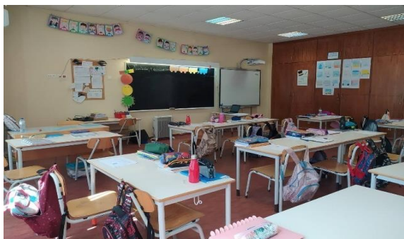
Figura 5 - Disposição geral da sala e respetivos equipamentos

Num dos lados da sala, encontra-se um grande armário que acompanha toda a parede. Neste armário estão guardados todos os componentes pedagógicos dos alunos, bem como materiais didáticos e pertences pessoais dos mesmos.