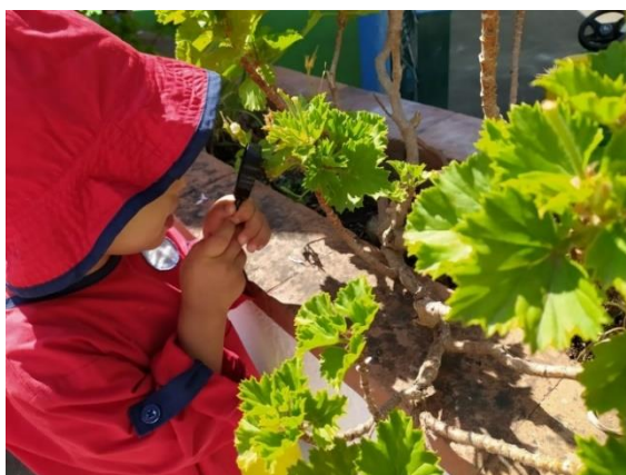
Figura 3 Criança a observar flores com a lupa

Os objetivos desta atividade foram proporcionar às crianças aprendizagens adquiridas no exterior. Partindo da história “O Nabo Gigante” onde surgem alguns elementos naturais, foi possível dinamizar esta experiência outdoor. Pretendeu-se que as crianças ficassem a conhecer melhor os diversos elementos naturais que se encontravam no exterior da sala, as suas características, as suas diferenças e semelhanças.