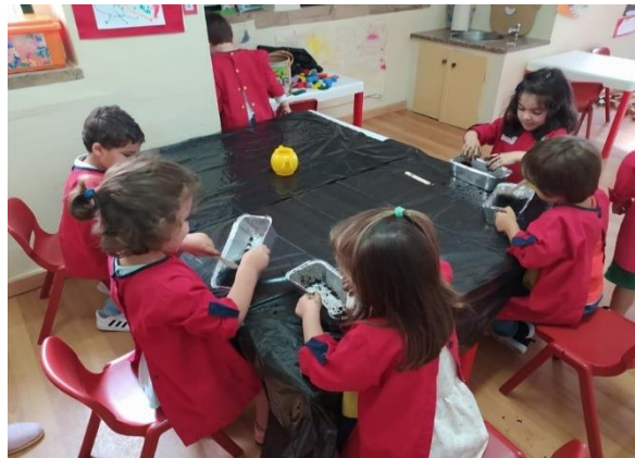
Figura 4 - Crianças a manusear a terra molhada

embalagens de alumínio e um saco de terra. Distribui por cada criança uma embalagem onde havia previamente colocado um pouco de terra. As crianças tiveram oportunidade de manusear a terra. Posteriormente, foi adicionado à mesma um pouco de água e as crianças voltaram a manusear a mesma. Com esta experiência, as crianças tiveram oportunidade de sentir as diferenças entre a terra seca e a terra molhada; puderam perceber que as respetivas texturas eram diferentes. As aprendizagens pretendidas com esta atividade eram a exploração da terra, através do manuseamento de diferentes texturas e dos seus resultados. Acredito que a atividade levada a cabo foi positiva em conseguir obter os resultados pretendidos, através da observação da terra seca e molhada, o que levou à apreciação das suas diferentes características, neste caso concreto da textura e do cheiro, para não falar da alegria das crianças ao realizar a atividade.