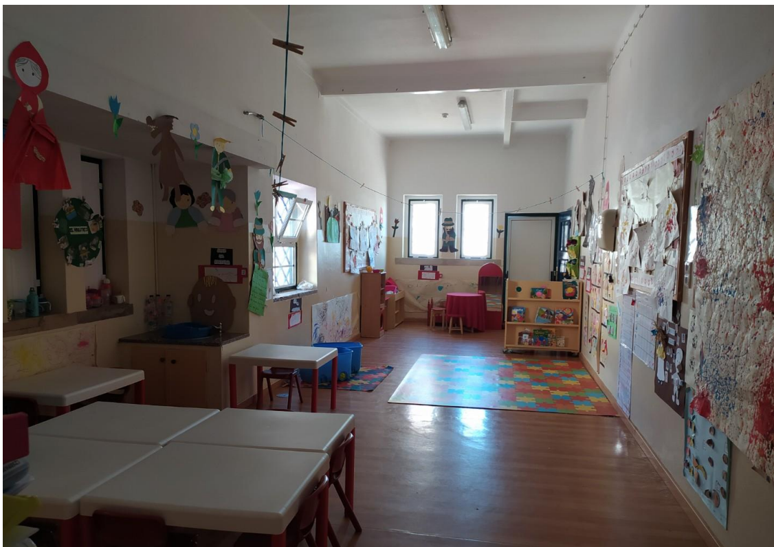
Figura 1 Visão geral da sala com as diferentes áreas

A sala dos 3 anos, onde se realizou o estágio curricular, é a sala do Bibe Vermelho. Apesar de ser denominada “sala dos 3 anos”, importa referir que tem a denominação também de sala de 3-4 anos, dada a faixa etária do grupo.