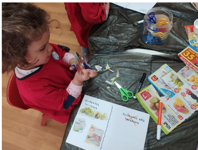
Figura 2 - Criança a manusear a tesoura para recortar

posteriormente colados numa folha. A folha estava dividida ao meio e cada criança colava num dos lados da folha os alimentos saudáveis e do outro lado os alimentos não saudáveis. As crianças aprenderam sobre quais os alimentos saudáveis e não saudáveis e o objetivo da atividade foi conseguido.