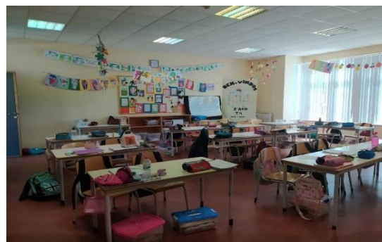
Figura 6 - Outra perspetiva da disposição da sala