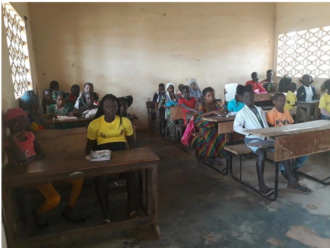
Fig. 07 - alunos de 3º ano