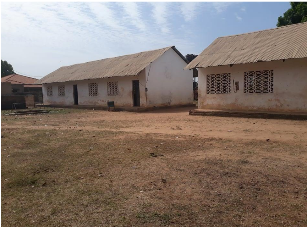
Fig. 03 parte exterior da escola