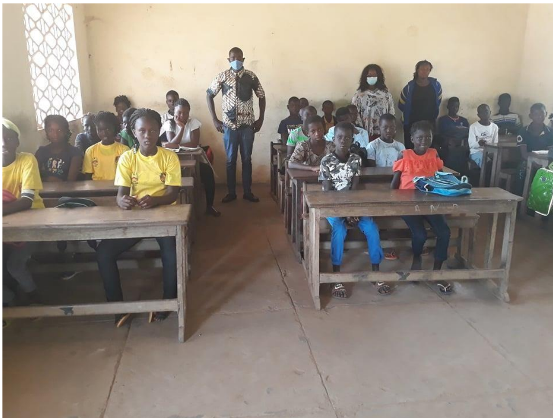
Fig. 09 Alunos de 2º ano