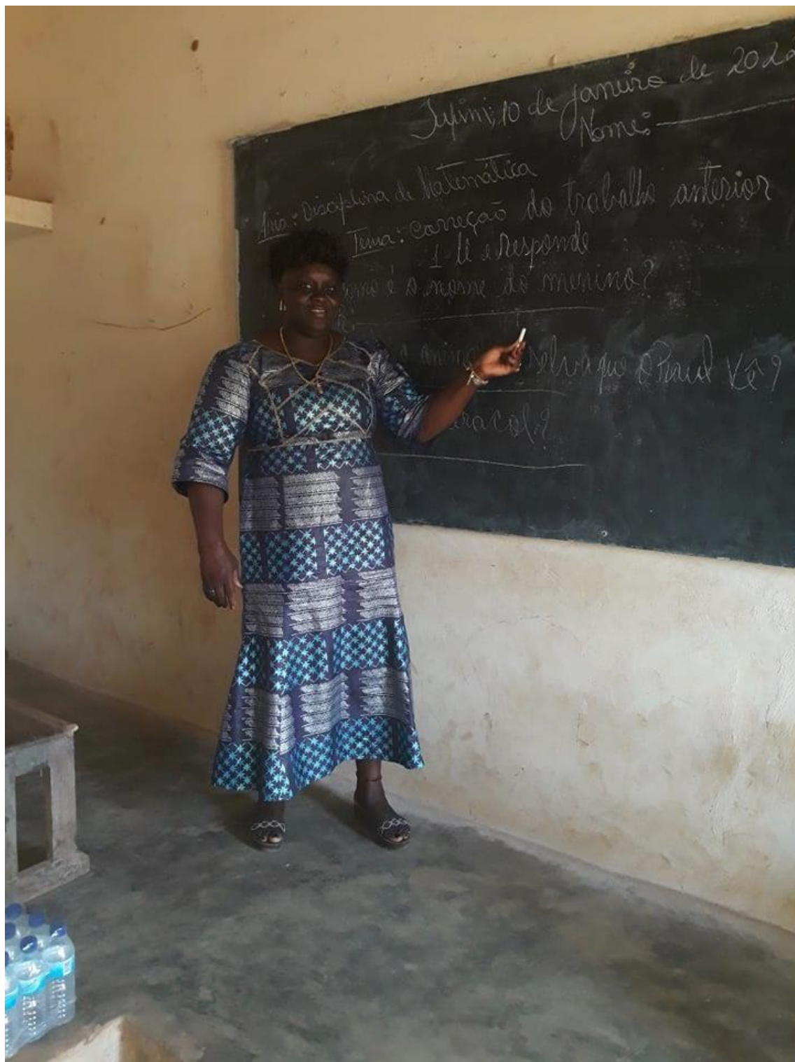
Fig. Professora de 06- 3º ano