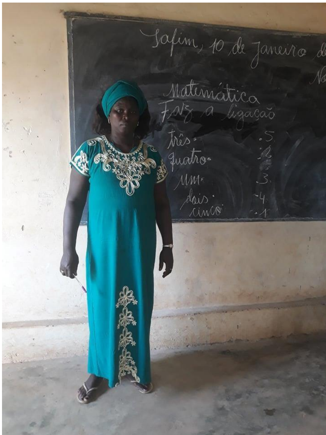
Fig. 04- Professora de 1º ano