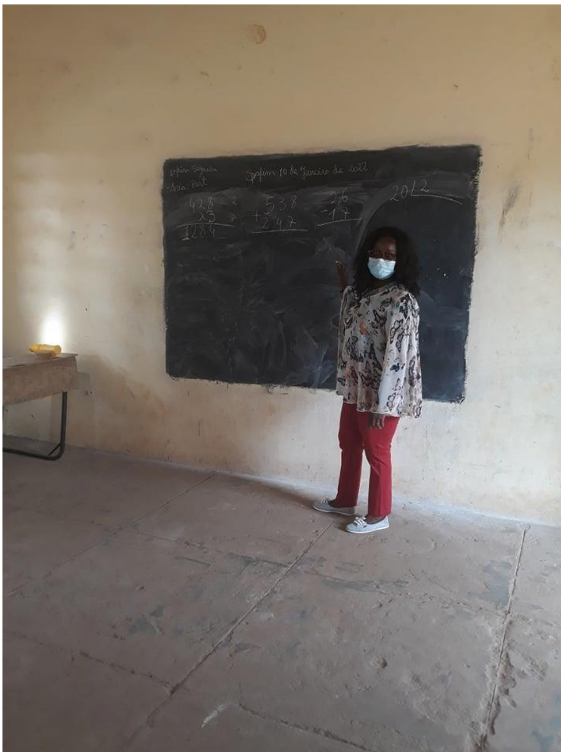
Fig. 08 – Professora de 2º ano