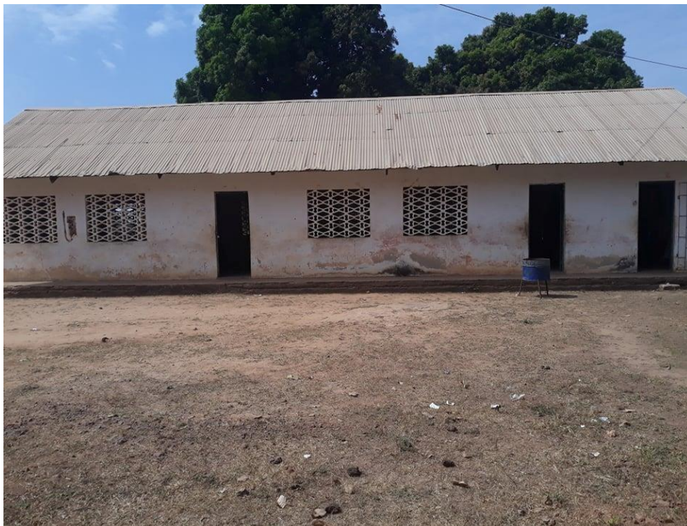
Fig. 02 trata-se da parte exterior da escola