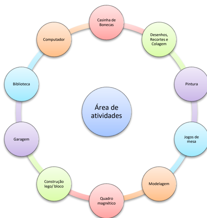
Figura 2 - Área de atividades

As áreas devem estar bem definidas e os materiais colocados em local próprio, para que as crianças saibam utilizá-los e arrumá-los de uma forma autónoma. A organização da sala será feita através da sua divisão por áreas, delimitadas pela disposição das mesas.