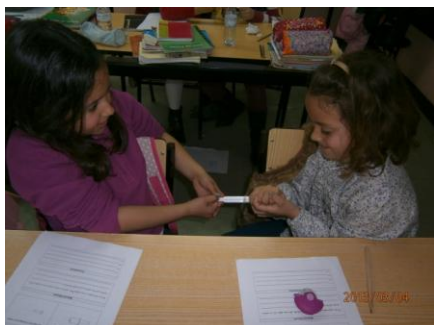
Ilustração 5 - Atividade pedagógica (Experimentação e folha de registos)

achavam que iria acontecer, fazendo, assim, uma previsão que era, posteriormente, representada na folha de registo. Após todas as crianças terem preenchido a folha de registo com a previsão era então feita a experiência, algumas das atividades as crianças