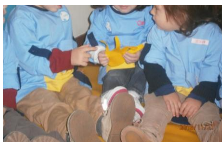
Ilustração 6 - Atividade pedagógica (sentido do tato)

crianças retirarem de dentro do saco das surpresas um puzzle, contruído previamente, que continha os vários sentidos trabalhados naquele dia. No dia seguinte foi trabalhado o sentido do tato em que as crianças apalpam dois tipos de materiais e foram dizendo as suas características, tendo em conta as questões colocadas.