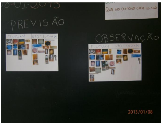
Ilustração 3 - Atividade Pedagógica (Registos)

De seguida, foi mostrado uma tira de plasticina e perguntado às crianças o que achavam que iria acontecer, sendo