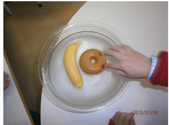
Ilustração 2 - Atividade pedagógica (Experimentação)

Finalizada a atividade foi perguntado às crianças o que era então flutuar, se todos irão ao fundo quando colocados dentro de água, se os objetos mais pequenos iam todos ao fundo ou não e os grandes.