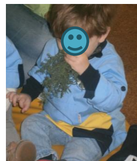
Ilustração 8 - Atividade pedagógica (sentido olfato)

Das várias atividades desenvolvidas ao longo deste estágio, gostaria de destacar a atividade dos sentidos. A atividade foi realizada em grande grupo e no tapete. O primeiro sentido foi