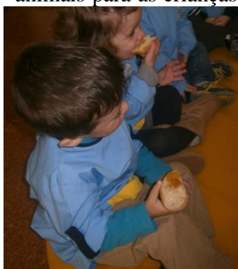
Ilustração 7 - Atividade pedagógica (sentido paladar)

a audição, onde foram colocados vários sons de animais para as crianças identificarem. Após todos os sons identificados trabalhámos o olfato em que foi dado às crianças a cheirar alecrim. Para trabalhar o sentido do paladar foi levado um doce que, posteriormente, foi colocado num pedaço de pão para as crianças provarem. Caso as crianças gostassem poderiam repetir ou até colocar no resto do pão que tinham na mão. O ultimo sentido a ser trabalhado foi a visão, e consistia em as