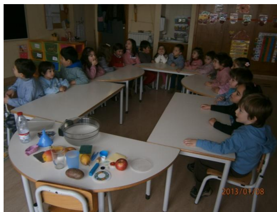
Ilustração 1 - Atividade pedagógica (Disposição da sala)

A atividade foi iniciada perguntando às crianças se sabiam o que significava flutuar. As crianças responderam ao que lhes foi