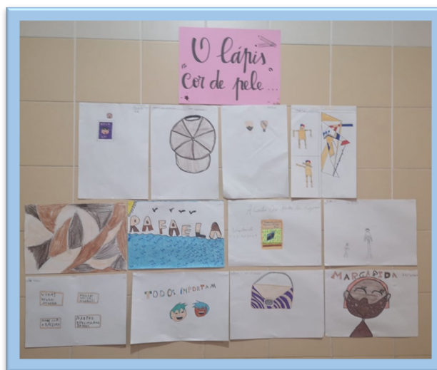
Figura 11. Atividade "O Lápis Cor de Pele"