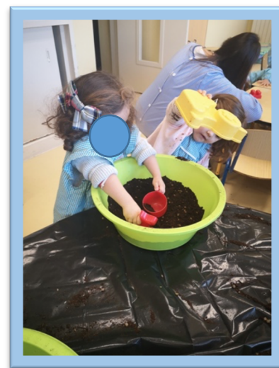
Figura 3. Atividade "Brincar com a terra"