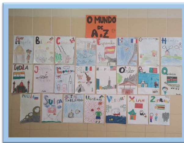
Figura 12. Atividade "O Mundo de A a Z"