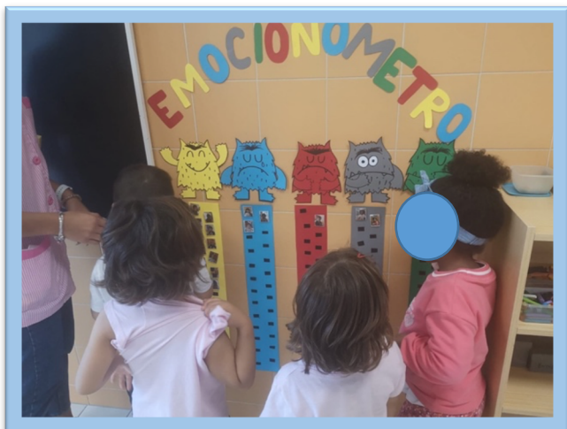
Figura 4. Atividade "Emocionómetro"

algun se sentia menos bem (Figura 4). Destaco, ainda, as atividades intituladas “Tapete Matemático da Lagartinha Comilona” (Figura 5) e “Jogo da Memória do Lobo que queria Mudar de Cor” (Figura 6), por se tratarem de atividades que considero que foram bem-sucedidas, uma vez que verifiquei o empenho das crianças ao realizarem as atividades, atingindo os objetivos propostos.