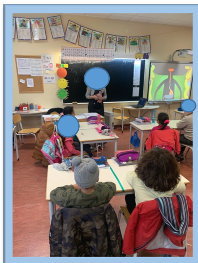
Figura 9. "Apresentação do Corpo Humano"