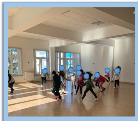
Figura 8. Atividade "Jogo do Covid-19"