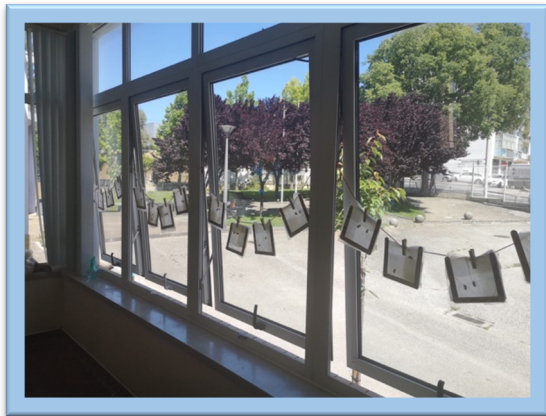
Figura 7. Atividade "Germinadores"

Das atividades realizadas no âmbito do projeto, saliento a atividade “Germinadores”. Esta atividade, veio na sequência de um estudo sobre as plantas, feito com a professora titular, a partir do qual solicitei aos alunos a construção de um germinador, utilizando micas e papel de cozinha, permitindo assim visualizar o processo de germinação. No meu ponto de vista, a atividade decorreu de forma positiva e benéfica, visto que os alunos tinham muito interesse em visualizar o que acontecia a cada dia à sua semente e compreenderam este processo (Figura 7). Destaco, ainda, as atividades intituladas “Jogo do Covid-19” (Figura 8), realizado em educação física, e a “Apresentação do Corpo Humano” (Figura 9), recorrendo a um avental com os órgãos dos diferentes sistemas, por se tratarem de atividades que considero que foram bem-sucedidas, visto que senti o interesse e o entusiasmo dos alunos ao realizarem as atividades, atingindo os objetivos propostos e abrangendo diversas áreas.