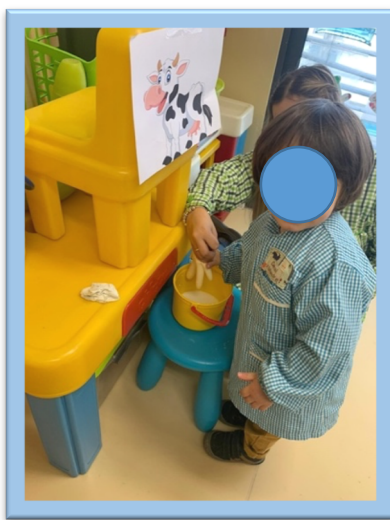
Figura 2. Atividade "Tirar o leite à vaca"