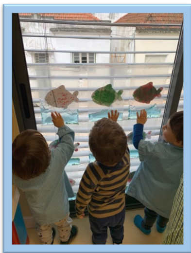
Figura 1. Atividade "Peixinhos na Água"

Das atividades realizadas no âmbito do projeto, saliento a atividade “Peixinhos na água”. Nesta atividade, cada criança pintou de forma livre um peixe e criou o seu meio ambiente dentro de um saco de plástico, com areia, missangas e água colorida. No final, os peixes eram colados na parte de trás dos sacos de plástico, e estes eram colocados nas janelas da sala, para uma possível exploração das crianças. No meu ponto de vista, a atividade decorreu de forma positiva e proveitosa, visto que as crianças tinham muito interesse na exploração dos sacos (Figura 1). Destaco, ainda, as atividades intituladas “Tirar o leite à vaca” (Figura 2) e “Brincar com a terra” (Figura 3), por se tratarem de atividades que considero que foram bem-sucedidas, uma vez que verifiquei o empenho das crianças ao realizarem as mesmas, atingindo os objetivos propostos.