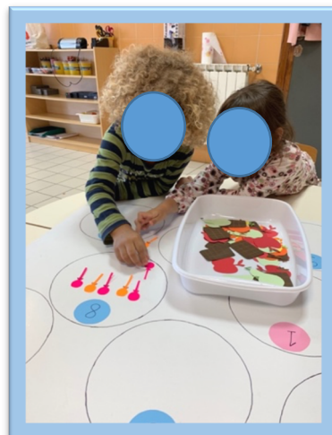
Figura 5. Atividade "Tapete Matemático da Lagartinha Comilona"