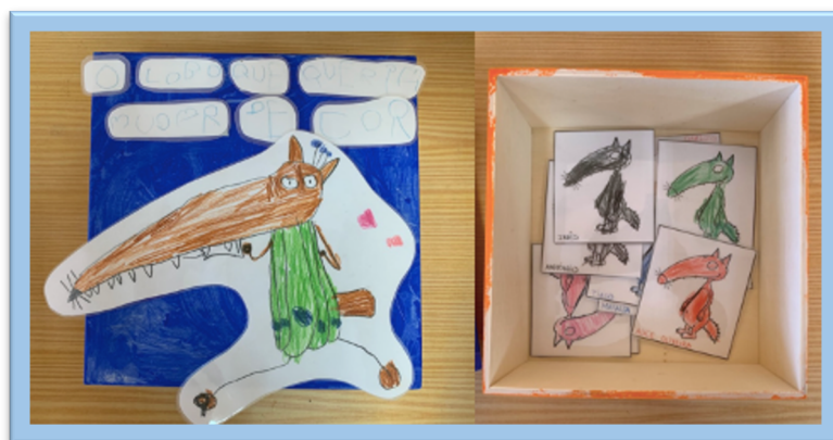
Figura 6. Atividade "Jogo da Memória com o Lobo que queria mudar de cor"