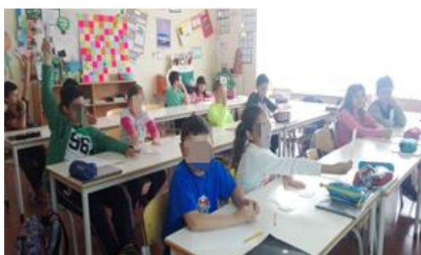
Figura 4 - Participação dos alunos no jogo "Quiz da matemática"