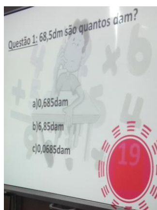
Figura 5 - Projeção do jogo "Quiz da matemática"

Esta atividade teve como avaliação a observação direta e uma tabela onde conste: o nome das equipas; respondem às questões corretamente (sempre, muitas vezes, algumas vezes, raramente); cumprem as regras do jogo (sempre, muitas vezes, algumas vezes e raramente); trabalham em equipa e discutem as respostas em grupo (sempre, muitas vezes, algumas vezes, raramente).