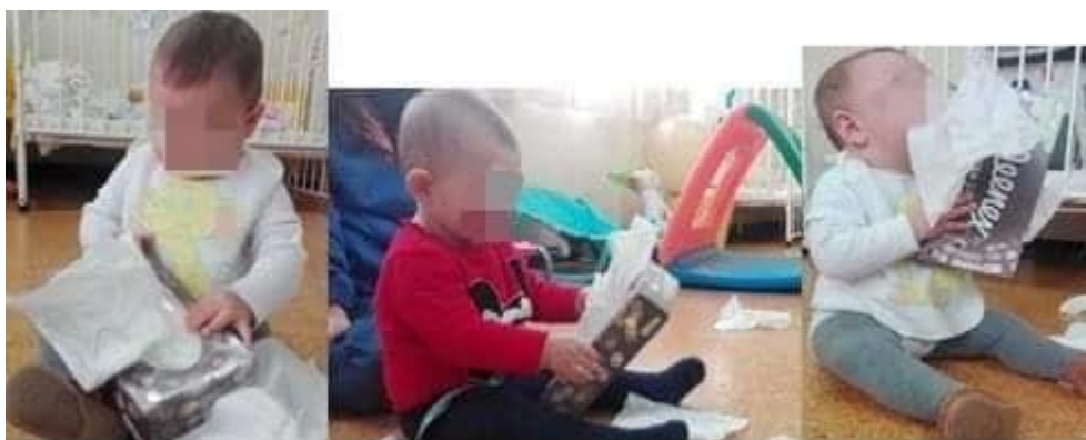
Figura 1 - atividade da descoberta sensorial

Esta atividade foi avaliada através da observação direta, registo fotográfico e diálogo com a equipa pedagógica.