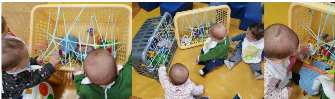
Figura 2 - atividade da caça ao brinquedo por entre linhas

Esta atividade teve como avaliação a observação direta, o registo fotográfico e o diálogo com a equipa pedagógica.