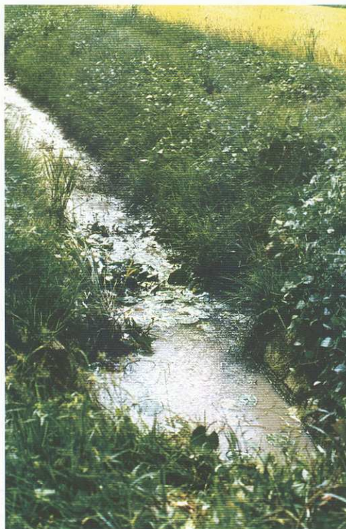
Figura 3 — Canais de irrigação secundários com abundante vegetação nas suas margens. Biótopo de moluscos dulçaquícolas (Carantabá).