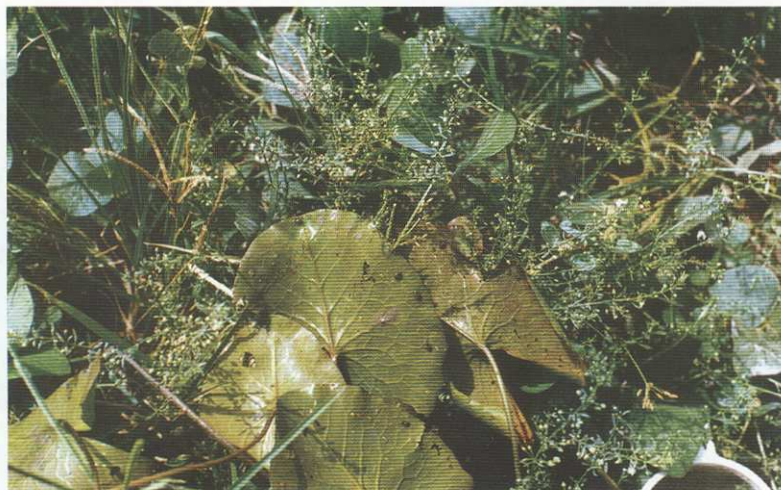
Figura 4 — Bulinus forskalii na página inferior de folhas de nenúfar (Carantabá, pormenor da figura anterior).