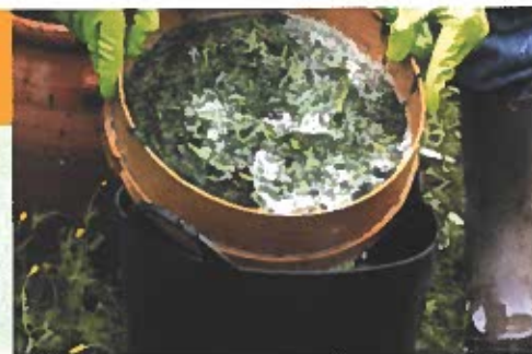
Figura 2. Distinção entre biopesticida (a usar em proteção biológica) e biopreparado (a usar em proteção química)

Solução para proteção química que tem por base substâncias químicas naturais de origem biológica ou mineral