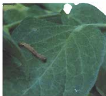
Figura 1. Modalidades de proteção biológica.

Introdução de uma espécie exótica que se estabelece na comunidade e assume valor funcional como auxiliar