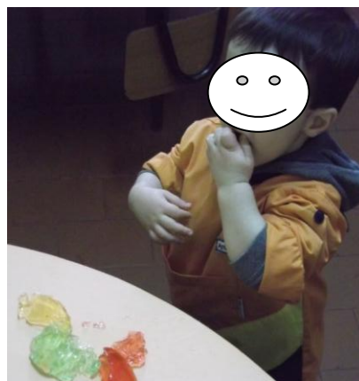
Figura 6 - Exploração da gelatina

Como estratégias principais a destacar, refiro a formação do comboio (figura 5) para que as crianças se dirigissem até ao refeitório, que era um dos objetivos a trabalhar pela educadora cooperante e que fomos trabalhando ao longo de todo o período de estágio. Para além disso, realço a atividade de exploração de gelatina (figura 6), em que as crianças tocaram, amassaram e provaram, tendo sido uma das melhores experiências que vivenciei enquanto estagiária, e que pretendeu dar resposta ao objetivo referido anteriormente, no que respeita à promoção da exploração de objetos, estimulando a curiosidade e o ímpeto exploratório das crianças.