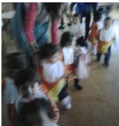
Figura 5 - Formação do comboio

Deste modo, procurámos desenvolver objetivos no âmbito das quatro áreas definidas na portaria referida acima: desenvolvimento motor, desenvolvimento criativo, desenvolvimento cognitivo e desenvolvimento pessoal e social. Como tal, definimos para o projeto de intervenção objetivos, sendo estes: “desenvolver o movimento, como forma de assegurar a satisfação das necessidades físicas das crianças (comer, dormir, movimento, entre outras)”; “desenvolver a comunicação e a linguagem”, numa perspetiva de desenvolvimento de vocabulário e estruturas linguísticas, mas também no desenvolvimento da “capacidade de controlar os comportamentos, de formas adequadas à idade(...), estabelecimento de relações, o desejo e capacidade de partilhar ideias e sentimentos com outros, sentido de cooperação” (Portugal, 2012: 5); “Promover a exploração de objetos, estimulando a curiosidade e o ímpeto exploratório das crianças”.