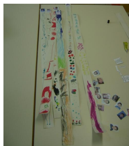
Figura 3 - Gráfico das alturas

3, respetivamente), que embora construídos em momentos distintos, se complementaram, procurando-se estabelecer comparações entre a informação presente nos dois, dado que no quotidiano, as crianças discutiam diversas vezes a relação existente entre a sua idade e a sua altura (o facto de “eu sou mais velho porque sou maior”).