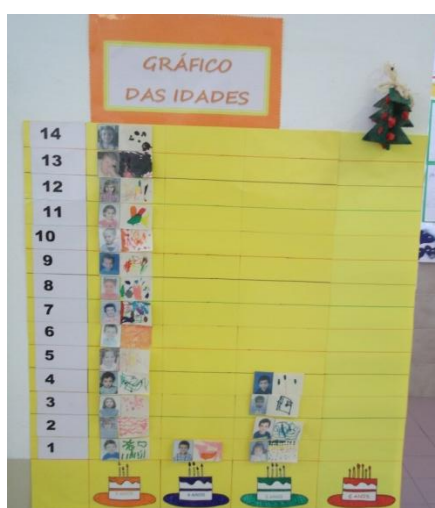
Figura 2 - Gráfico das idades