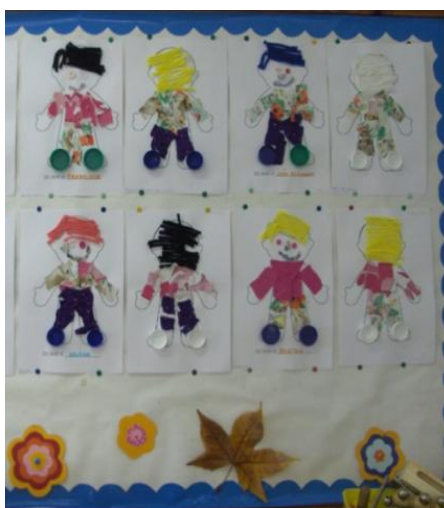
Figura 1 – Capa e contracapa do portefólio

Das diversas estratégias e atividades, destacaria a construção da capa e contracapa do portefólio (figura 1), cujo objetivo principal teve em conta que as crianças se representassem nessa mesma capa, conhecendo as suas características físicas, como a cor do cabelo, dos olhos, entre outras. Realçaria ainda a construção do gráfico das idades e das alturas (figura 2 e