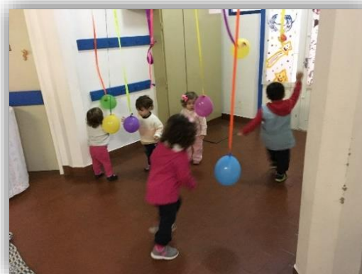
Figura 1 - Crianças a explorarem autonomamente os materiais disponíveis no hall sensorial e musical, verificando-se no registo fotográfico o envolvimento das crianças nesta atividade e o seu apreço por todos os materiais disponibilizados.