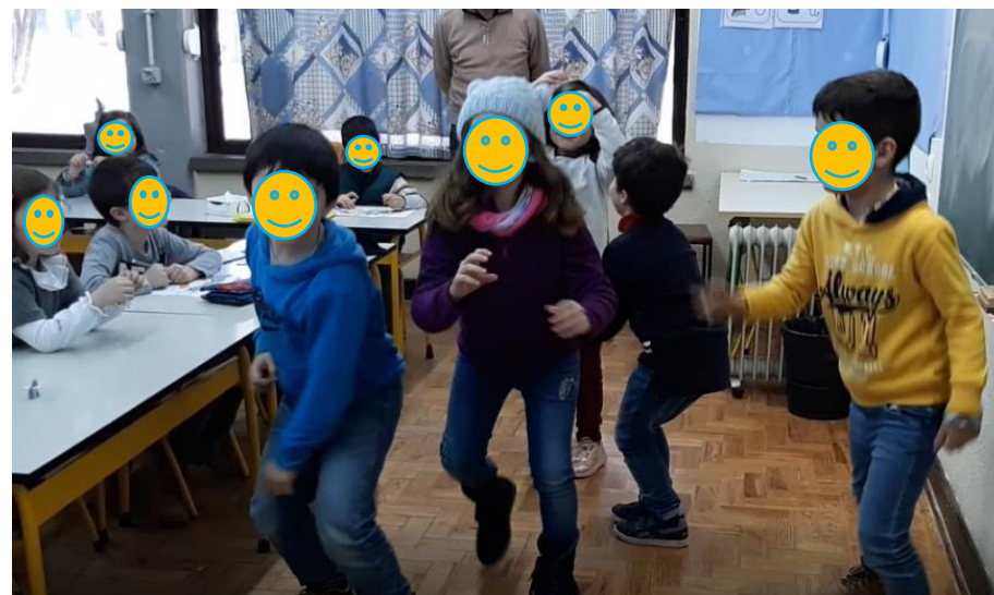
Figura 8 - Alunos a realizar as dramatizações "respeito os outros e os materiais" de acordo com os textos lidos.