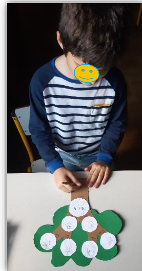
Figura 7 - Conclusão das colagens dos desenhos representativos dos elementos da família que desejaram colocar na sua árvore da família