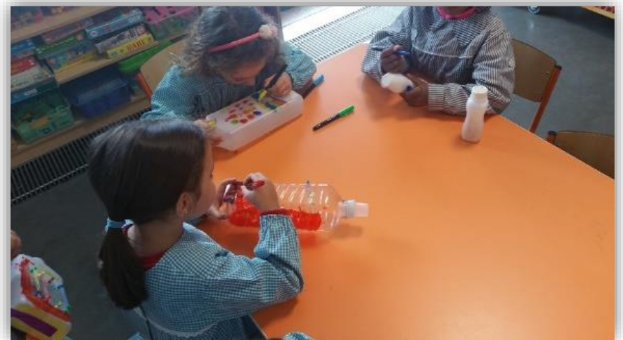
Figura 3 - Construção dos instrumentos musicais, nomeadamente decoração com pinturas e colagens.