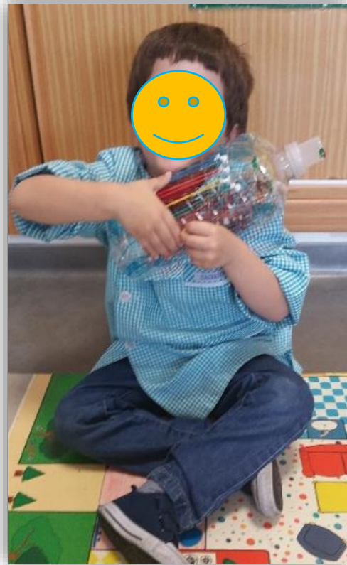
Figura 2 - Criança a brincar com o seu instrumento (guitarra) feito com material reciclado. Esta brincadeira surgiu uma semana após a conclusão da atividade, a criança num momento livre decidiu ir buscar o seu instrumento musical para brincar.