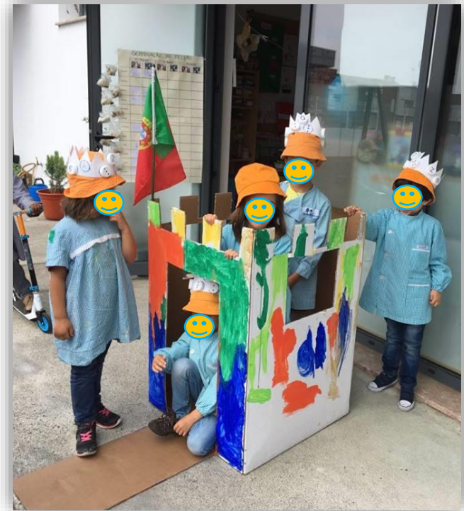
Figura 5 - Após a conclusão do castelo as crianças usaram-no para brincar no recreio com muita frequência.