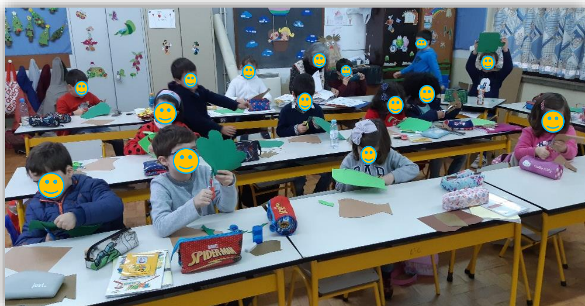
Figura 6 - Elaboração do recorte e montagem da árvore da família