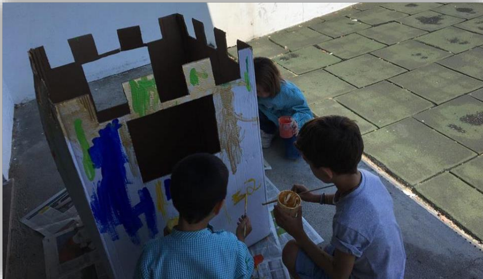
Figura 4- Pintura em pequeno grupo do Castelo de Cartão