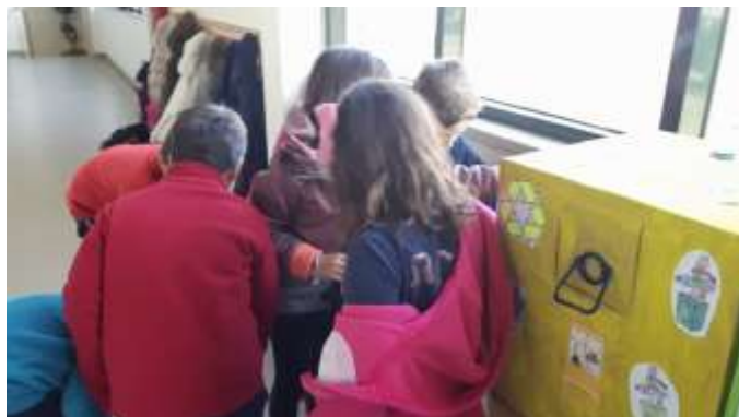
Figura 10 - Colocação dos resíduos encontrado no ecoponto correto

Para a avaliação do projeto e das aprendizagens das crianças, foi utilizada essencialmente a estratégia da observação, no qual foi registado em grelhas de avaliação criadas para cada atividade. Também houve o recurso à análise dos produtos finais, registo fotográfico, observação direta e conversas em grande grupo.