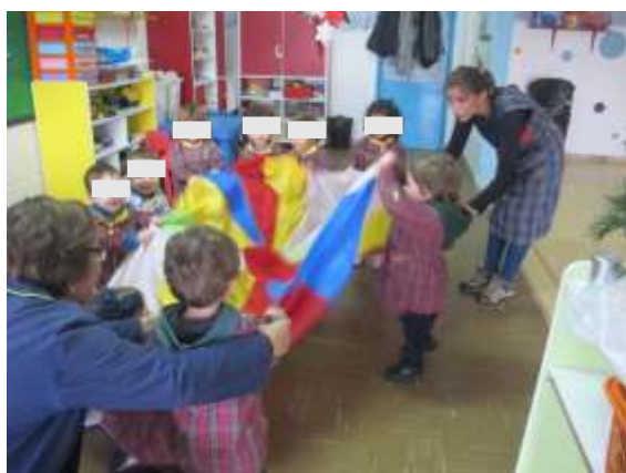
Figura 1 - Atividade pano colorido

Uma das atividades onde se evidenciou um maior envolvimento foi a do pano colorido 2 . As crianças estavam a agitá-lo consoante as indicações que se iam dando e consoante o ritmo da música. As músicas foram escolhidas de modo a que fosse possível trabalhar o ritmo - rápido e lento. A textura do pano foi escolhida com cuidado, pois tinha uma textura macia para ser agradável ao toque e leve para a movimentação ser facilitada. Para além do desenvolvimento dos órgãos sensoriais, esta atividade também permitiu o desenvolvimento motor e cognitivo – as partes do corpo (cabeça e pés), a lateralidade e a orientação espacial - cima e baixo.