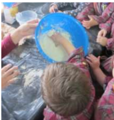
Figura 3 - Atividade massa de moldar

De uma forma geral, todas as crianças tiveram a curiosidade de experimentar à exceção de uma criança que se recusou de tocar na massa, pois não gostava de texturas pegajosas. Nesta atividade, também houve o cuidado de estar sempre presente, apoiando a criança sempre que necessário, como por exemplo disponibilizando os materiais e quando a massa estava difícil de misturar por ter um pouco de água a mais, ajudava a unificar a massa para esta ficar moldável.