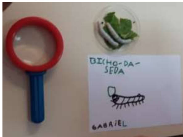
Figura 6 - Atividade de exploração do bicho-da-seda

Uma outra atividade realizada no âmbito do projeto foi a experiência do flutua não flutua 6 , que partiu da leitura da história “Navega, Caracol”. Nesta atividade, existiam objetos disponibilizados que flutuavam e não flutuavam na água. Neste sentido, foi construída a questão-problema: “Será que flutua?”. Esta atividade foi dividida em três momentos: das conceções prévias, experimentação e conclusão. Para verificar o que as crianças pensavam que iria acontecer com os vários objetos foi dada uma tabela com todos os objetos que seriam utilizados. Após o registo foi realizada a experiência e por fim as crianças concluíam se as suas previsões estavam corretas ou não.