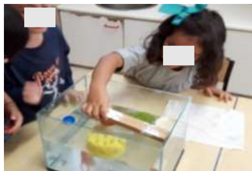
Figura 7 - Atividade flutua, não flutua