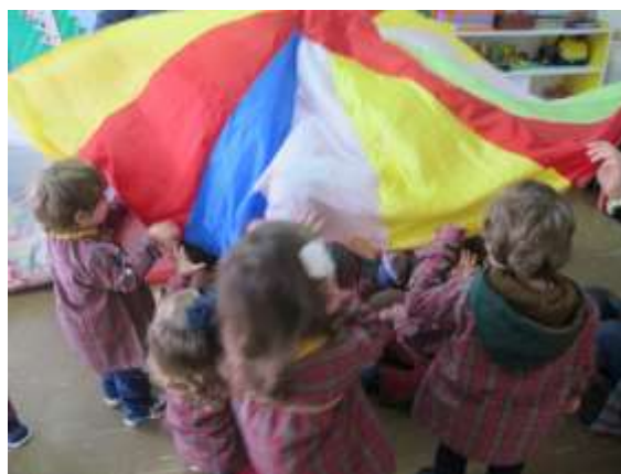
Figura 2 - Atividade pano colorido

Uma outra atividade que correu igualmente bem, foi a realização de massa de moldar 3 , mas com a massa do pão, para promover a utilização de ingredientes naturais. E uma vez