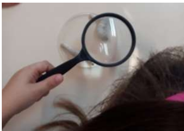
Figura 5 - Atividade de exploração do bicho-da-seda

Um momento muito curioso foi enquanto foram distribuídas as folhas brancas, às crianças dos 5 anos para realizarem, para realizarem o registo, houve duas crianças de 3 anos que pediram para o realizar também. O resultado não se podia recusar a este pedido, pois estaria a privá-los de um momento de aprendizagem.