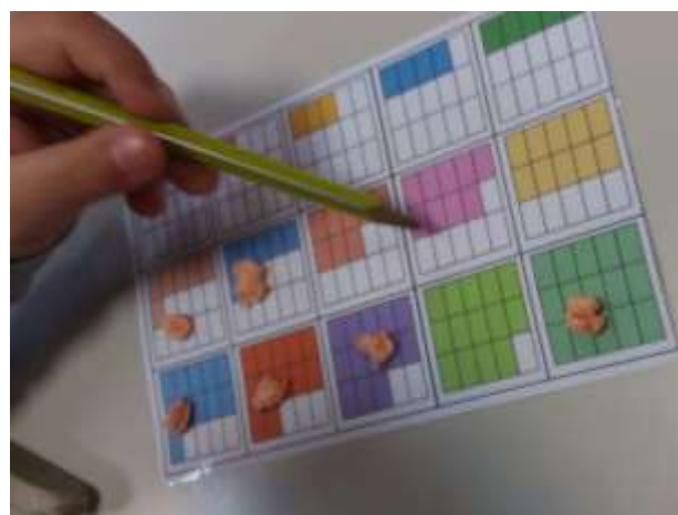
Figura 13 - Cartela com representação gráfica dos números inteiros

Uma outra atividade que se considera que teve um grande impacto foi a construção da tabela dos comportamentos 10 . Antes da construção da mesma, foi necessário pedir às crianças que escrevessem um texto sobre as atitudes que elas não gostavam que lhe fizessem, após a correção dos textos, foram escritas as categorias da tabela.