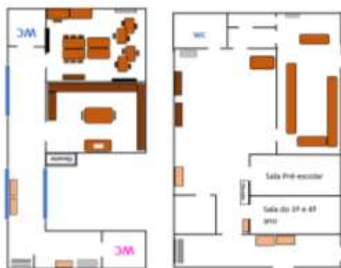
Figura 11 - Planta da escola (escala aproximada)

tinham dúvidas sobre em qual ecoponto é que deveriam colocar determinado resíduo. Pelo que foi necessário um novo esclarecimento em grande grupo para indicar o que se deve ou não colocar em cada ecoponto.