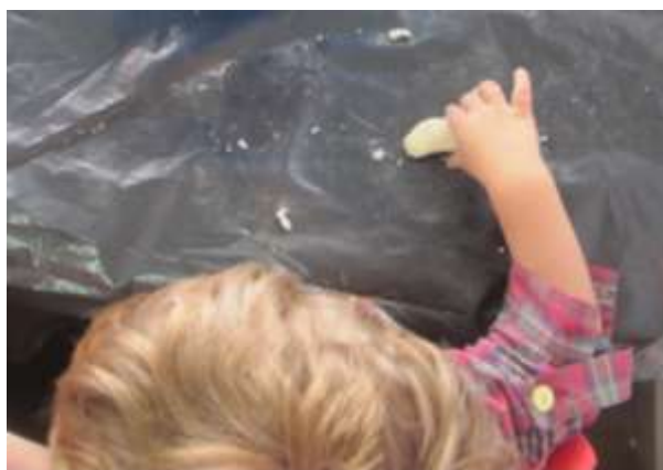
Figura 4 - Atividade massa de moldar

Para avaliar o projeto, foram construídas grelhas de observação, elaboração de diário de bordo e registo fotográfico. A realização deste tipo de documentação permite-me analisar, interpretar e refletir sobre o projeto desenvolvido, podendo identificar as potencialidades e as dificuldades das crianças (Parente, 2012).