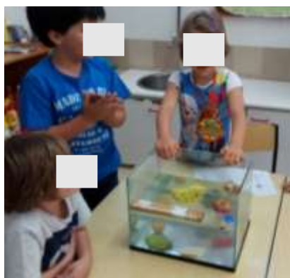
Figura 8 - Atividade flutua, não flutua

As principais aprendizagens retidas nesta experiência foi que o peso dos objetos não era um fator que influencia a flutuação, uma vez que havia uma batata que pesava menos do que uma maçã, e que a forma era relevante para o objeto flutuar através da moldagem de uma bola de plasticina.