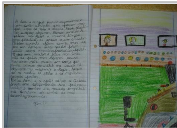
Fig. 4 - Registo do resumo do Capítulo " A Máquina do Tempo".

Durante o estágio foram realizadas diversas atividades, das quais destaco: a construção do resumo da obra “ Uma viagem ao tempo dos castelos” das autoras Ana Maria Magalhães e de Isabel Alçada 4 . Esta consistia na abordagem da leitura do capítulo, por parte da estagiária, durante este momento, os alunos ouviam e teriam de retirar os seus apontamentos dos acontecimentos mais importantes que surgiam durante o capítulo.