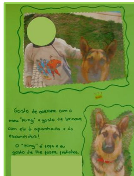
Fig. 2 – Página do livro " Os animais do nosso coração"

Posteriormente, a criança colou a fotografia numa folha colorida e a estagiária escreveu uma frase que era dita pela criança, como é possível verificar um exemplo de uma página na fig.2.