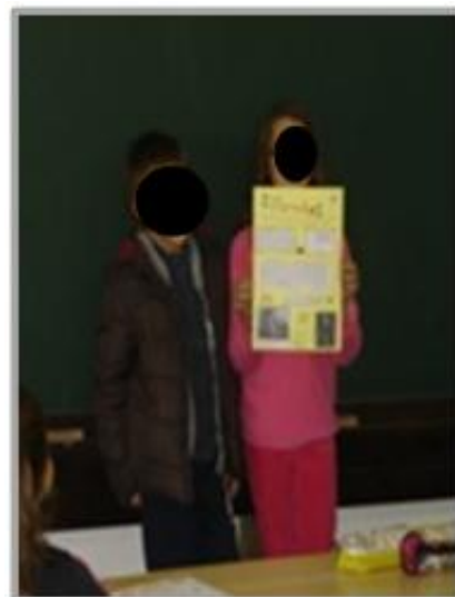
Fig.5 – Apresentação da pesquisa " Os Reis de Portugal"

Relativamente à segunda atividade que saliento a pesquisa efetuada pelos alunos sobre os Reis de Portugal. Esta foi realizada em três fases complementares, primeiramente a pesquisa através do recurso da internet e de livros, posteriormente a elaboração de um cartaz com os registos dos acontecimentos e feitos importantes de cada rei e por fim a apresentação dos reis, na fig.5 observa-se o cartaz que foi elaborado por dois alunos. Por fim, juntou-se todos os cartazes e construiu-se um livro sobre os reis, com o intuito de os alunos o consultarem sempre que fosse necessário.